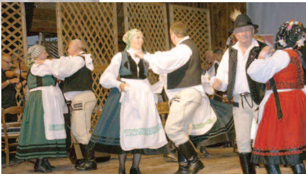
Kincses Marosszék előadás

„Az idei mikházi programunkra hatással van a járványhelyzet, mivel a szervezés kezdetén még csak egy napos nagyrendezvényekben lehetett gondolkodni, így az eseményt – mértéktartó, de gazdag programmal – augusztus 8-ára időzítettük. A Csúrszínházban – a szélesebb érdeklődői kör számára – nemcsak tartalmukban érdekes, de újrahaz-