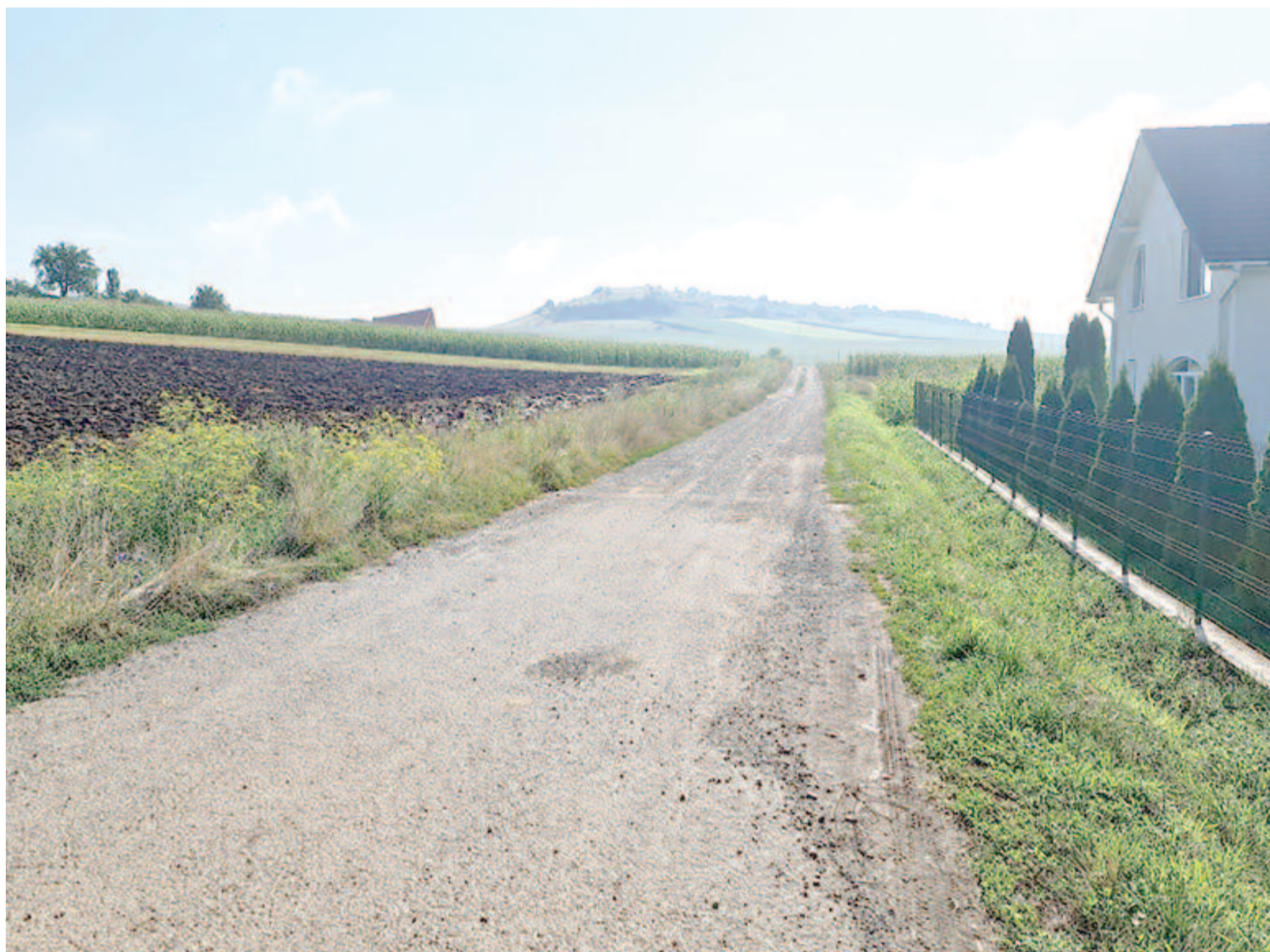
Ákosfalván a ravatalozóhoz vezető utcát aszfaltozzák le nemsokára