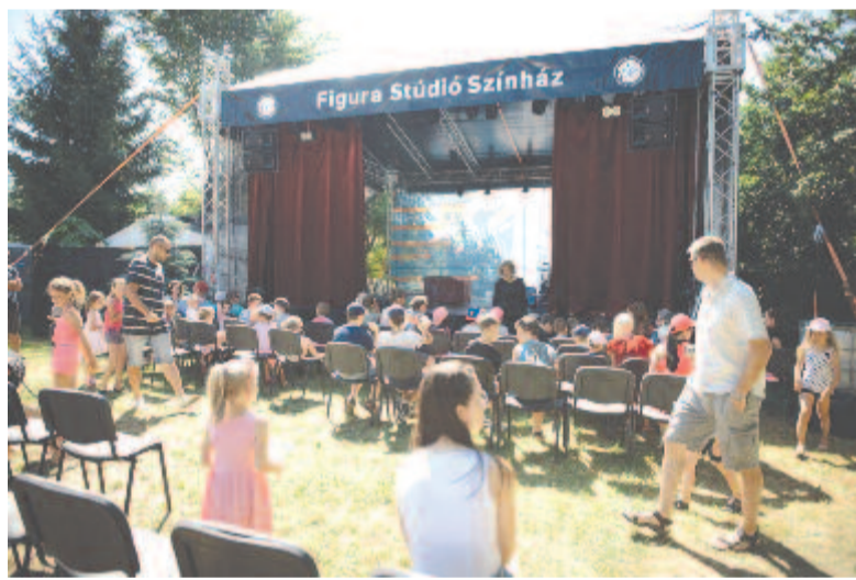
Könyv- és színházudvar