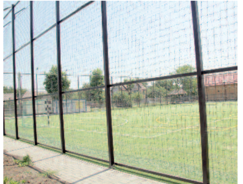
Két műgyepes sportpályája is lett a községközpontnak

– A megyeszékhely és a községünk közvetlen közelében ketyegő „időzített bomba” kapcsán mindig azt szoktam mondani, hogy egy magánvállalkozás nem lehet fontosabb 300 ezer ember életénél – összegzett Maroskeresztúr polgármestere.