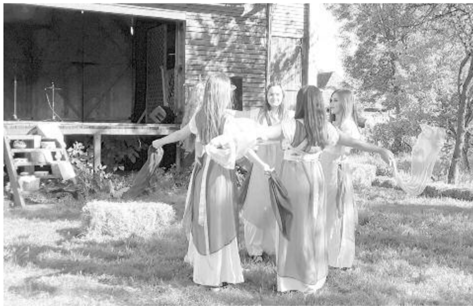
Az ókori Kelet és Egyiptom kultúrájában nyújtanak betekintést az előadások

A részt vevő csapatok még a déli harangszó előtt végigvonulnak a falun a Csűrszínház, a kolostor és a régészeti park között, ugyanitt „fesztiválszekérről” is lehet sétálni. A Csűrszínház udvarán számos múzeumpedagógiai foglalkozásra és kiállításra várják a gyerekeket (és nem csak), történelmi témájú előadásokat is lehet hallgatni a mesés Kelet régészeti emlékeiről, de a mai kor határvonalairól, a világháborús lövészárkokról is. Az arénában érdekes bemutatók lesznek, kezdve a római katonák eskütételétől az íjászversenyig, a rabszolgavásártól a keleti táncokig, majd harci jeleneteknek lehetünk tanúi, a