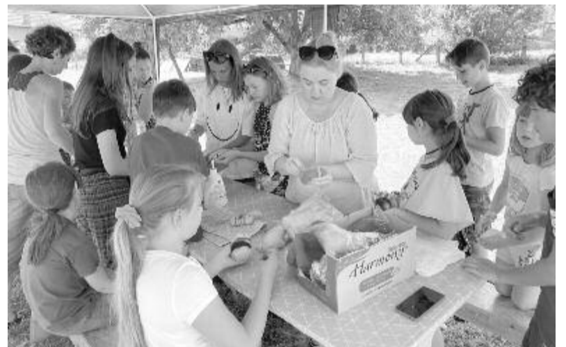
Számos érdekes program várta a helyieket

Szombaton a művelődési otthon és környékét népesítették be: az épületben iskolatörténeti kiállítás volt, az érdeklődők az ötven évvel ezelőtti bósi iskola körülményeibe és feltételeibe nyertek betekintést, a gyerekeknek érdekes foglalkozásokat szerveztek, de a felnőttek is nagy érdeklődéssel forgatták a naplót, évkönyveket, szülői értekezleti jegyzőkönyveket és régi tanácsleveleket. Az épület előtti téren újrahasznosított papírból készült tárgyakat, ékszereket, festett üveg- és fatárgyakat lehetett vásárolni. A gyerekeket kézműves foglalkozásokra, nemezelésre, arcfestésre várták, kipróbálhatták a papírtárgyak készítését is. Ebéd után Csihi-puhi történetekre, azaz élvezetes bábelőadásra várták az apróságokat a nézőterre. Este Kilyén Ilka művésznő előadására tért vissza a közönség,