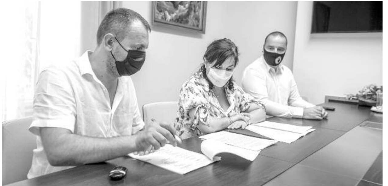
Pénteken írták alá a szerződést