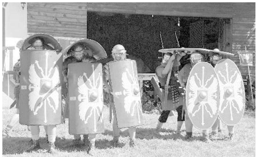
Római katonák mutatják meg ügyességüket, harci bemutatók is lesznek

A 9R Fesztivál társszervezője a mikházi Csűrszínházi Egyesület, támogatója a Maros Megyei Tanács és a Bethlen Gábor Alap, partnerei a Nyáradremetei Polgármesteri Hivatal, a Marosvásárhelyi Polgármesteri Hivatal, a Maros Művészegyüttes, a Tekei Téka, a Maros Megyei Könyvtár, a Keleti-Kárpátok Múzeuma, a Milites Marisensis Egyesület, a Marosvásárhelyi Nemzeti Színház és a Visit Maros Egyesület.