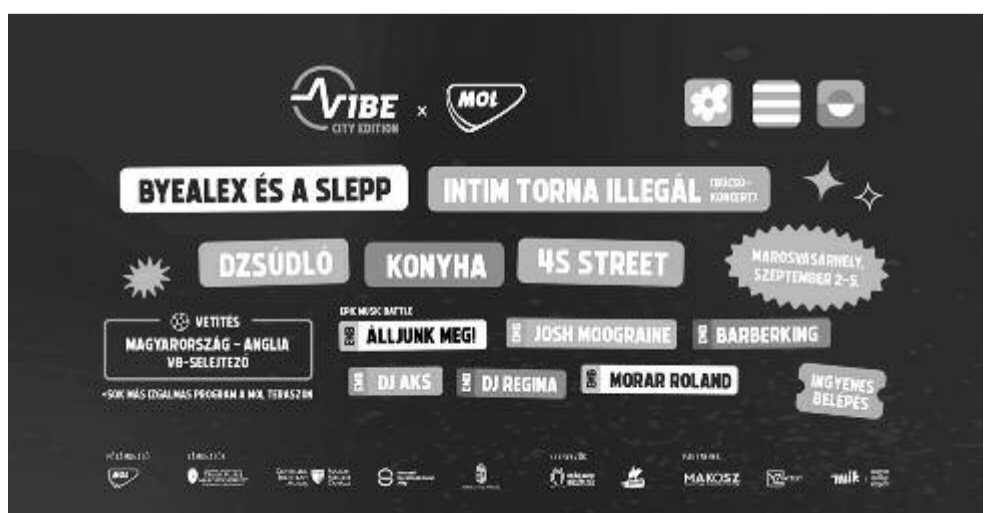
Vibe: The City Edition plakátja

– Most már megvan a zenei felhozatal, jelenleg készítjük a technikai háttérrel, azt, hogy pontosan hogyan és mikor tudnak fellépni, mire van szükségük a zenekaroknak, ezt hogy valósítjuk meg, mi hova kerül a helyszínen. Ezeket a terveket most véglegesítjük. Emellett a nyári egyetem programja még nincs kész, mert ott sokkal több személlyel kell egyeztetni a programot, ezért ez egy kicsit hosszabb folyamat. Ennek a véglegesítése folyik, és az, hogy minden a helyére kerüljön a tervrajzokon. Normális esetben már egy hónappal a fesztivál előtt leköltöztünk Marosvásárhelyre, mindenki ott lakott, és két-három héttel a nyitás előtt már az építkezés is zajlott. Az idei, városi kiadás esetében csak egy héttel korábban fogjuk elkezdni a fesztiválépítést.