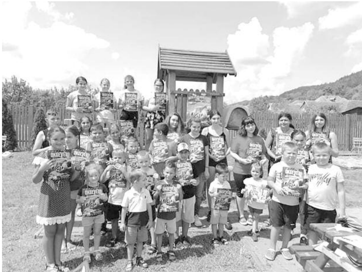
Minden gyermek egy kincs, egy rejtett tehetség, az ő felfedezésük volt a program célja

A programfelelős büszke a falu ügyes, csodálatos gyerekeire, akik különböző területeken mertek nagyok lenni. „És azok is voltak! Mosoly, derű, akarás, Istentől kapott talentumok – tükröződött arcukon a boldogság, öröm” – állapította meg, és arra biztatta a gyerekeket, hogy merjenek egy életen át legjobbak lenni, törekedjenek magukból a legjobbat, leg-szebbet nyújtani, örömet szerezni szüleiknek és a közösségnek. Az első lépések még kis feladatok, de az eredmény később, az életben mutatkozik meg – értékelte a programfelelős a kezdeményezést, egyúttal megköszönve az egyesületi bizottság tagjainak a hozzáállását is, a segítő jóakaratot, és nem utolsósorban Varga Adorján polgármesternek azt, hogy jelenlétével megtisztelte a záróeseményt, ezzel is bizonyítva, hogy számára is fontos a közösség minden gyermeke. (GRL)