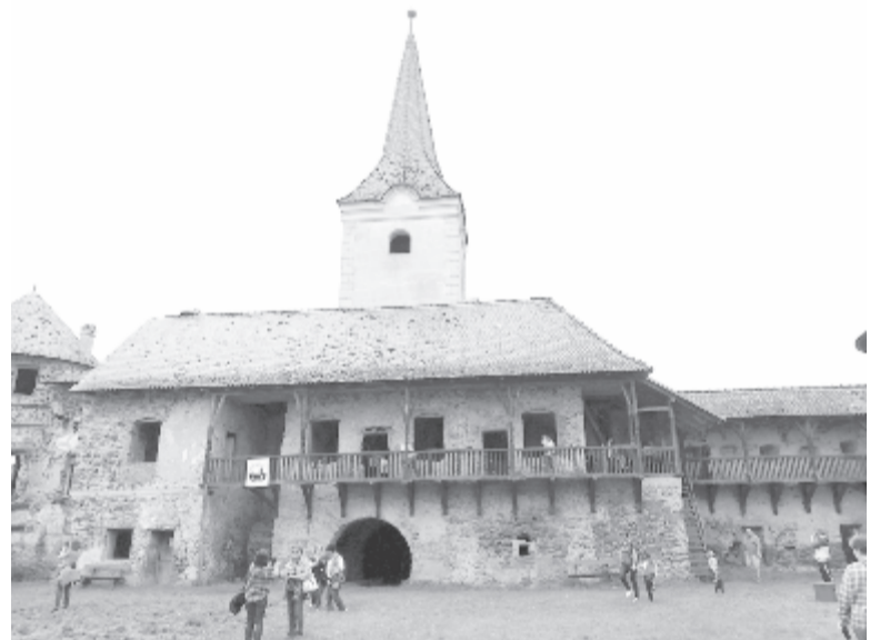
Az alsórákosi Bethlen-várkastély

A terület három legfontosabb érdekessége az egymillió év körüli bazaltorgonákon kívül a vulkanikus eredetű Smaragd-tó és a salakbányának emlegetett Hegyes-domb nevű, vörös színű vulkáni képződmény, amely mély bányaudvarból emelkedik ki. Mivel a Djambo című film forgatására bérbe vették, egy éven keresztül nem lehet megközelíteni. De nem is arra vágytam, miközben a mélyen lévő forrásokból táplálkozik. A zöld és a kék egymásba olvadó árnyalataiban játszó gyönyörű víztükrre azonban vékony szürke fátylat vont az eső, így eredeti szépségét, színét a fénykép nem tudja visszaadni. Szívesen nézelődtem volna, de egyre jobban esett, és segítségre nem számíthatam. Felelőtlen kirándulóként sajnos sem esernyőt, sem esőköpenyt nem vittem magammal, és a lábamon is nyári szandál volt csak. Mivel a bazaltoszlopokat is szerettem volna látni, amelyek ellenkező irányban vannak, futólépésben indultam el az oda vezető úton. Szép virágos rétek között szedtem a