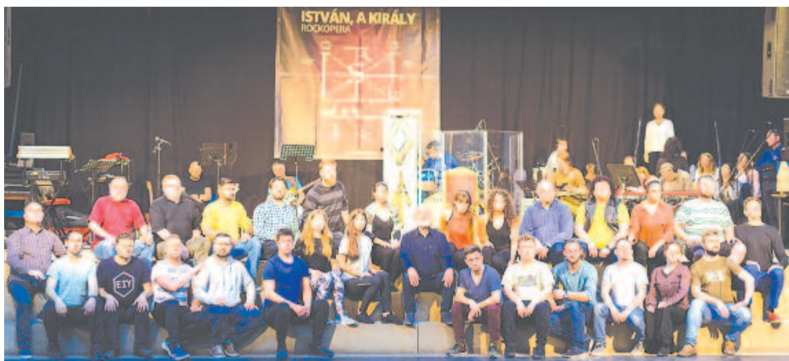
Együtt a szereplők