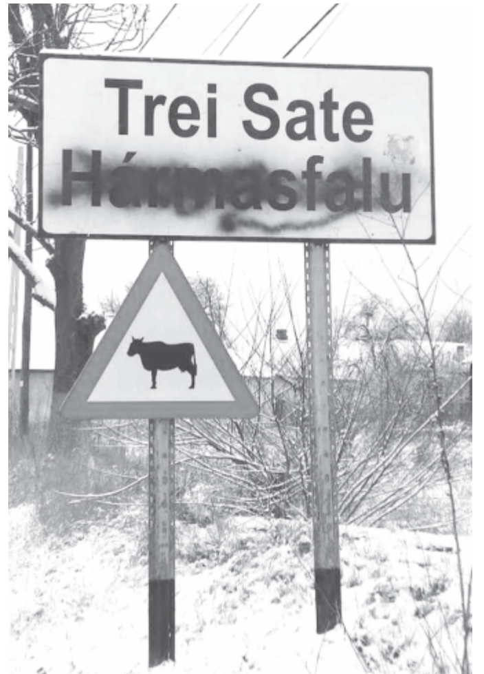
A hármásfalusi helynévtáblát is lemázolta a Bákó megyei férfi

A férfit az Országos Közúti Infrastruktúra-kezelő Országos Társaság (CNAIR) kárára elkövetett rongálás miatt rótták ki büntetést: a hathónapos letöltendő szabadságvesztés mellett 1899 lej kártérítés kifizetésére kötelezték. Az ítélet nem jogerős, megfellebbezhető a Harghita megyei törvényszéken. (GRL)