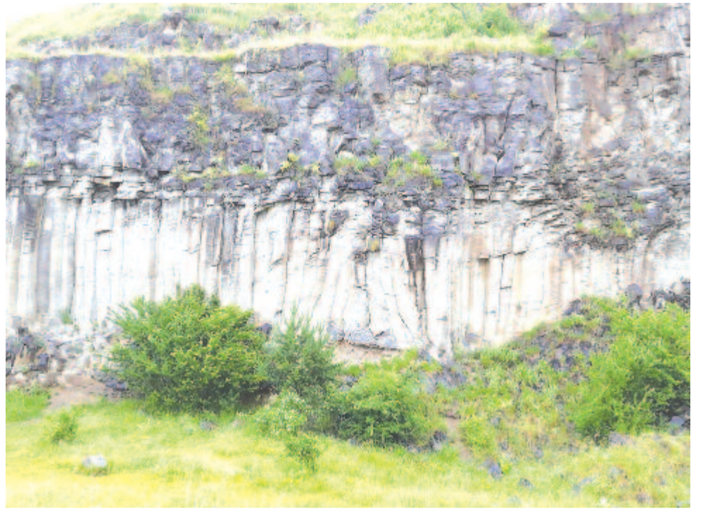
Az alsórákosi bazaltoszlopok

Bár Nyirő Józsefnek Alsórákoson is van emlékszobája, hiszen 1931-ben oda vonult vissza gazdálkodni, Székelyzsombor, a szülőhely felé tartottunk. Köves út vitt a településre, amelynek szász lakosságát hajdan a pestisjárvány tizedelte meg, és a környező falvakból telepítettek helyükbe székelyeket. A fállal körülvett nagy evangélikus templom lelkésze, Kunos Lajos mutatta be a települést, reménységgel a hangjában, majd Nyirő József szülőházát látogattuk meg. Július 28-án lesz 132 éve, hogy a helyi iskola igazgatójának fiaként világra jött, és szülőhelyén a 2004-ben felavatott szobra, a szépen berendezett emlékszobában pedig fényképes életrajza és posztókötésű művei tekinthetők meg. A katolikus plébánosból lett újságíró, író, az Erdélyi Szépművés Céh egyik alapítója igéretesen indult a helikonista szerzők között. Első elbeszélései (a Jézusfaragó ember) a