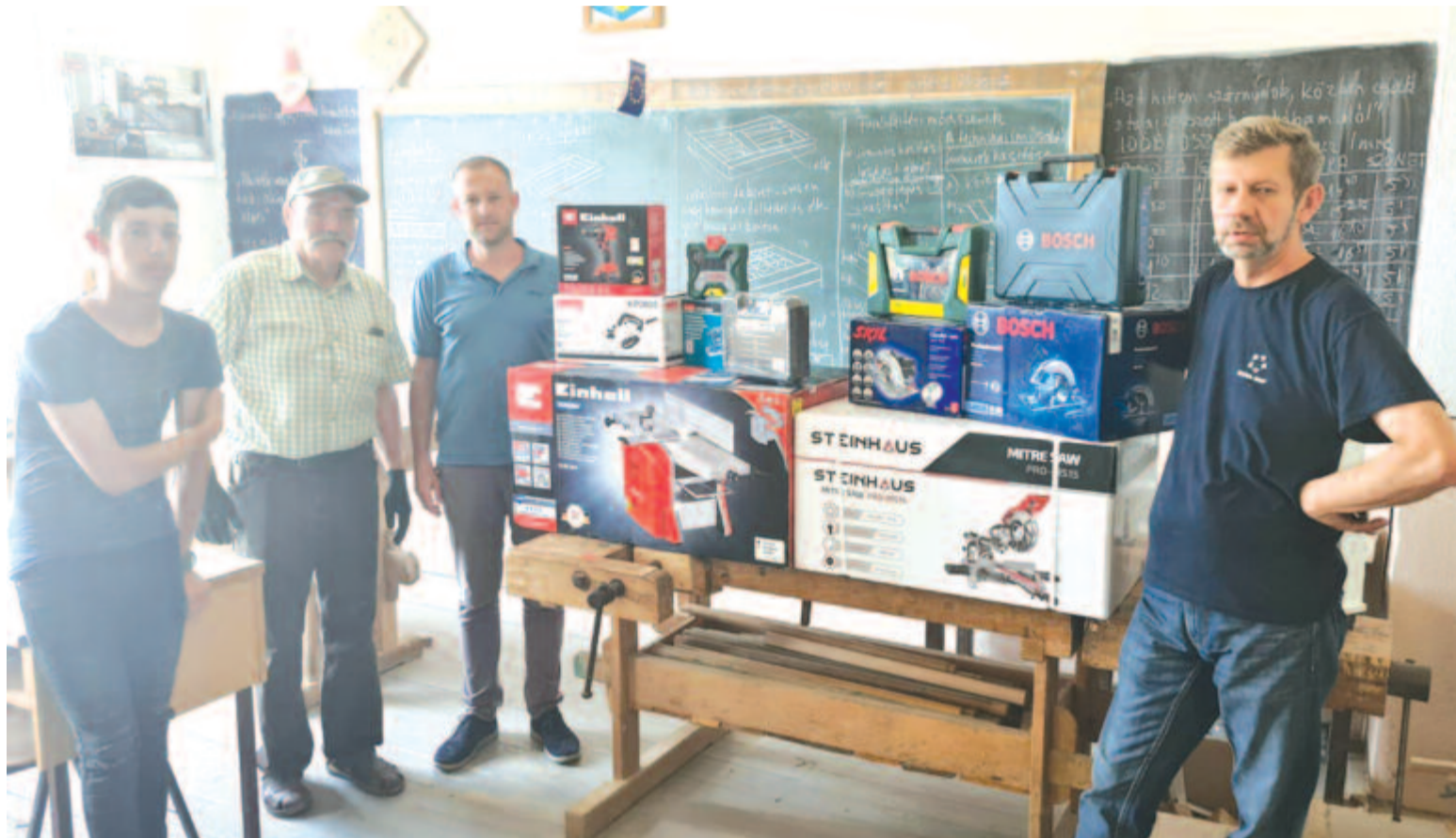
Gépeket, szerszámokat kapott a faipari szakosztály a tanácsosok adományaiból