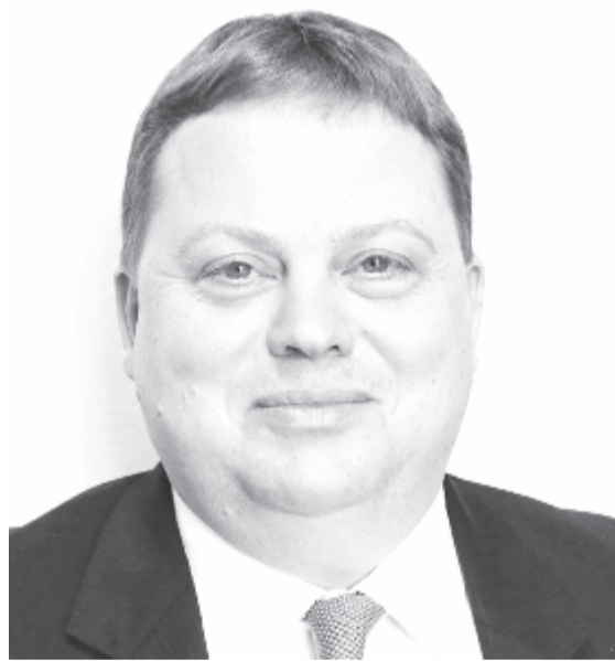
Fabian Zuleeg, az Európai Politikai Központ igazgatója