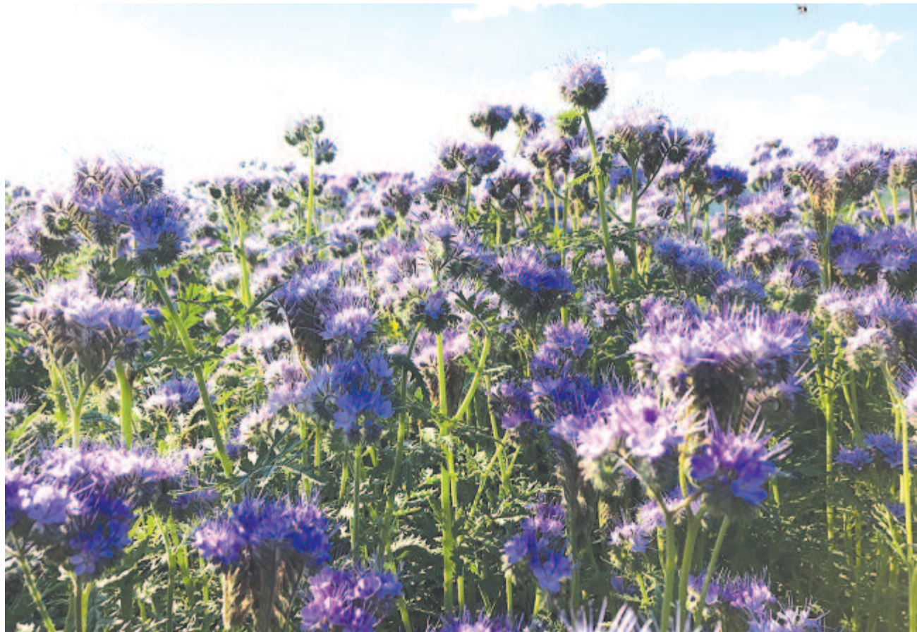
Mézontófű méhlegelőivel köszönt be a nyár

Kelt 2021-ben, 172 évvel Gábor Áron halála után