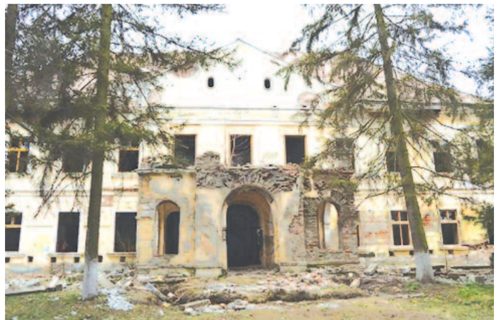
...és a mostani kastélyépület