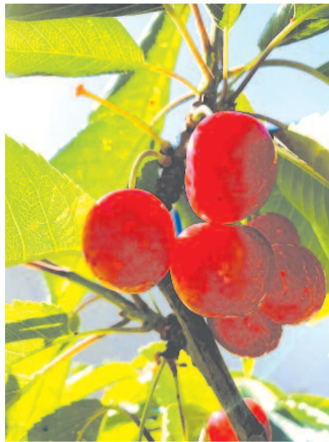
Hólyagos cseresznyével búcsúzik a kora nyár

Július 1-jén, 189 éve, 1832-ben halt meg Pesten Haberle Károly Konstantin Keresztély természetkutató, botanikus. A német tudós, miután Közép-Európa számos helyén gyűjtött növényt, rovar és ásványokat, a napóleoni háborúk elől menekülve, végül Pesten telepedett le. 1815-ben a Magyar Nemzeti Múzeum Természeti Osztályának őre, 1817-től a Magyar Királyi Egyetemen a botanika rendes tanára, 1818-tól a Fűvészkert igazgatója volt. A botanikus kert állományát