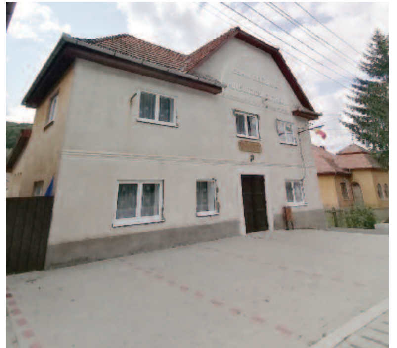
A magyarzsákodi kultúrház

A Covid miatt a kulturális élet területén bekövetkezett leállást úgy használtuk ki, hogy ez idő alatt rendbe tettük a községbeli kultúrházakat. A járvány alatt vendégek sem jöttek hozzánk nagy számban, ese-