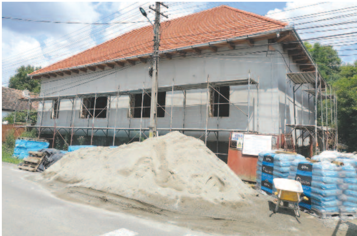
Hamarosan elkészül a székelyvéckei kultúrotthon

Ugyanakkor a mi elképzelésünk is visszanyúl a múlt századhoz, úgy gondoljuk, hogy egyszer majd megint lesz itt 60-70 gazdálkodó. De már soha nem lesz így. Lehet, hogy lesz egy másfajta gazdálkodás, lehet, hogy a szép táj miatt üdülőfaló leszünk. De hiszem, hogy aki pozitívan áll a munkához, termel, és teremtő ember, annak az élete gyümölcsöző lesz.