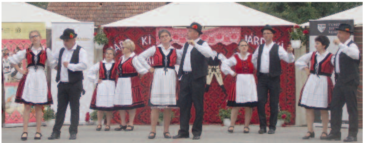
Helyi hagyományos tánc – sármási Sárma

Volt kinek és volt miért tapsolni Nagysármáson, ahol rendkívül jó érzés volt újra látni, hogy van, lesz, aki tovább élteti hagyományainkat, zenei és mozgásbeli anyanyelvünket pedig sok tehetséges, szép fiatal diák „beszéli” és adja tovább.