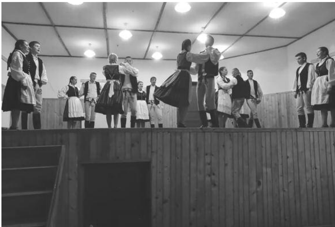
Minden korosztályt igyekeztek megszólítani a szervezők, az ifjak pedig néptáncsal ajándékozták meg a közönséget.

Először rendeztek a hétvégén helyi búcsúval egybekötött falunapokat a Nyárádmente legmagasabban fekvő településén. A kezdeményezés sikere rávilágított arra, hogy mekkora szükség van a közösségi életre egy kisebb, félreeső faluban is.