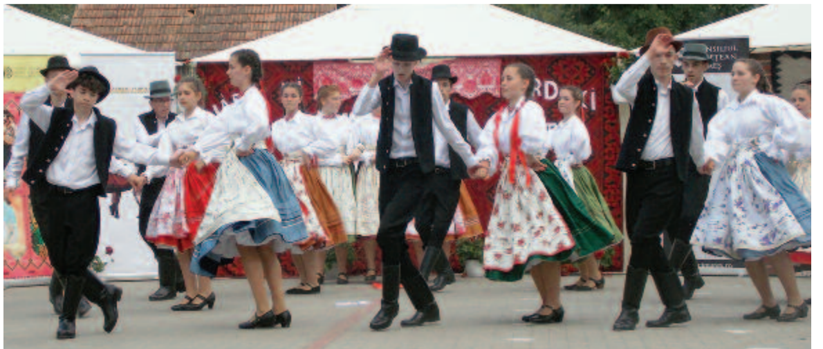
Szilágysági tánc – gyulakutai Szivárvány

fontosságát, a találkozás örömét hangsúlyozta.