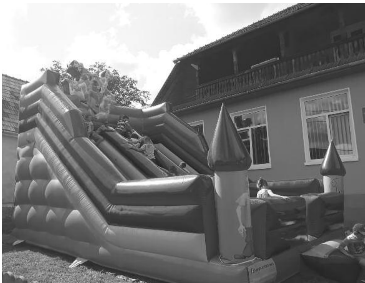
A gyerekek nagyon örültek a számukra szervezett programoknak.

Aki kijárogat a Bekecs-tetőre, már tavaly észrevehette, hogy a fa-