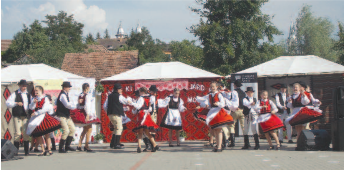
Küküllőmenti tánc – Csillagfény együttes