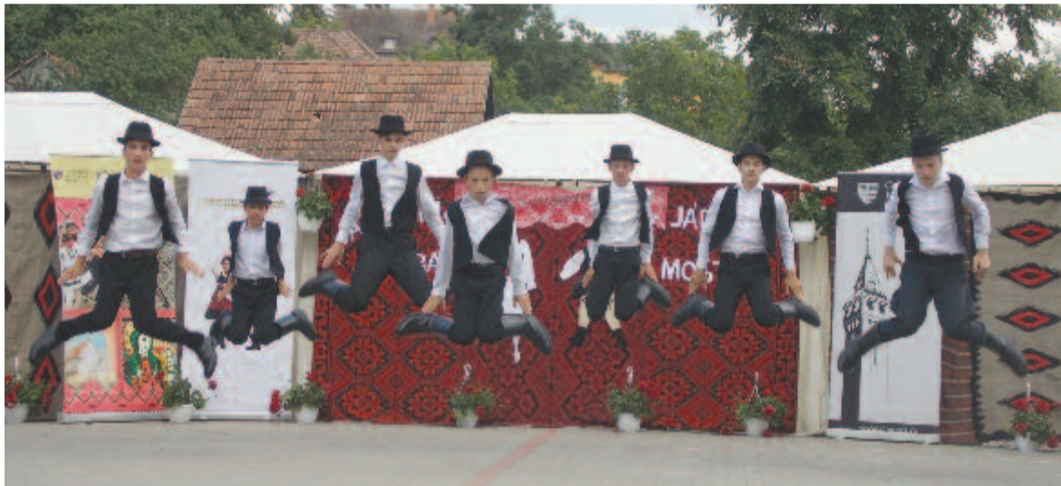
Ördögösfüzesi verbunk – marosludasi Hajdina

Semmi sem fontosabb, mint egy nép szellemiségének megőrzése, megerősítése, függetlenül attól, hogy milyen országban él, és milyen nyelvet beszél. A hagyományok, a kultúra és a hit ennek a