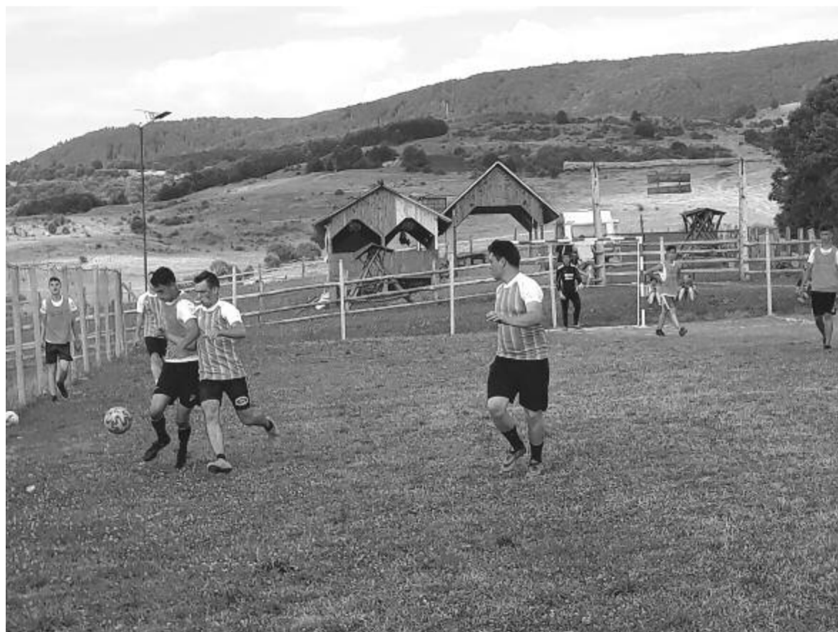
A helyi fiatalok örömmel használják az új focipályát – a hétvégén a magyarósiak ellen bizonyítottak

lelkesedés sokszor mindennél többet jelent, és végre megpezdült az élet a bekecsalji településen – mondta el a szervező.