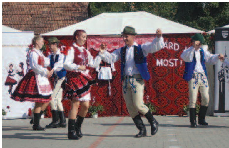
Magyarói tánc – Csurgó együttes