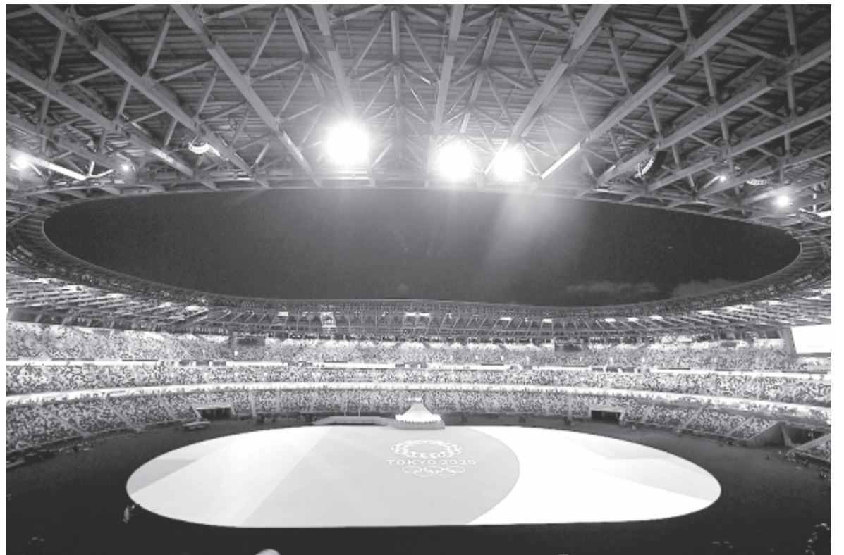
A nézők nélküli Olimpiai Stadion a koronavírus-járvány miatt 2021-re halasztott 2020-as tokiói nyári olimpia megnyitójának előtt 2021. július 23-án.