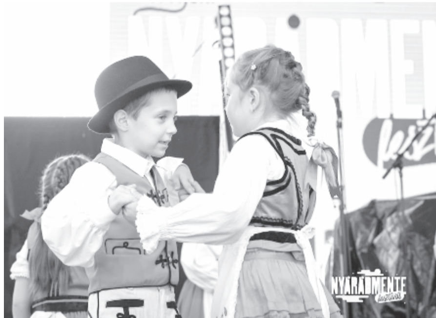
Ezen a nyári fesztiválon is: találkozás, hagyományörzés és szórakozás