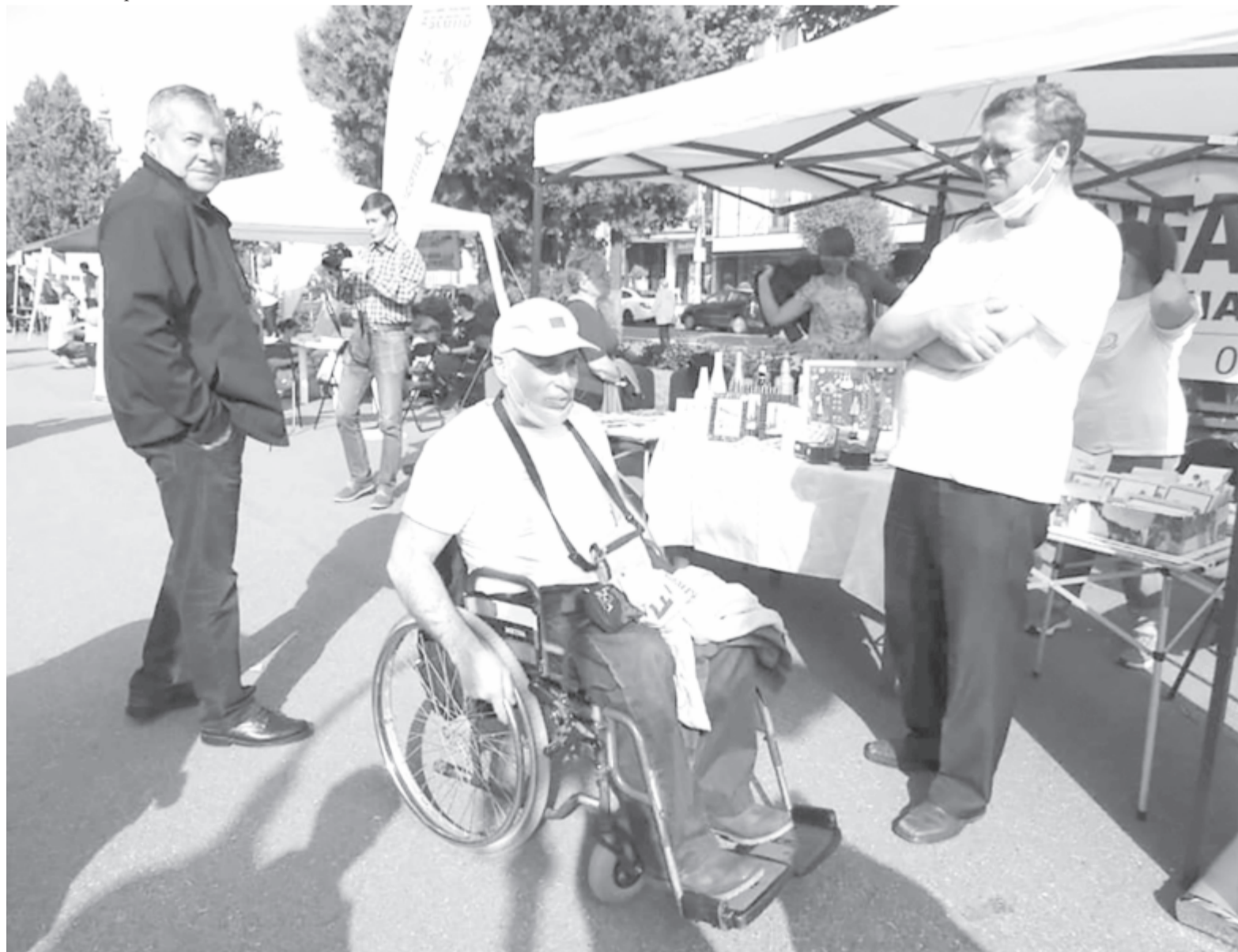
A felvétel illusztráció.

– Néhány személlyel tartottam a kapcsolatot, és valósággal börtönként élték meg ezt az időszakot. Megértették ennek az intézkedésnek a szükségességét, de nagyon nehezen viselték azt, hogy ott kellett hagyniuk a családjukat – világított rá a képviselő.