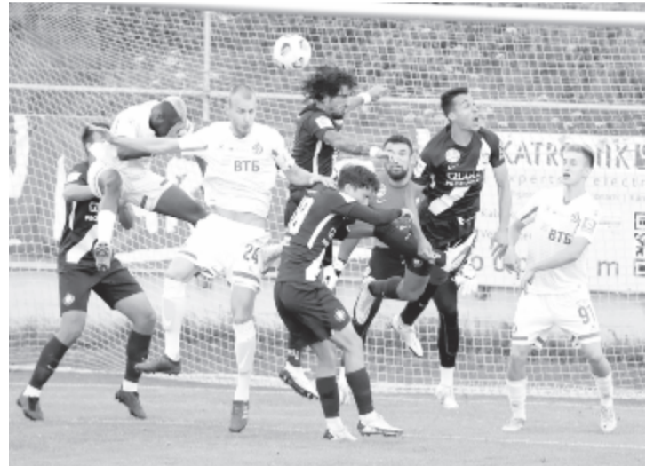
A felkészülési mérkőzésen remekül működött az MTK védelme, és a támadók is veszélyesebbek voltak a moszkvaiaknál.

Játéka alapján a magyar csapat teljesen megérdemelten győzött, állapította meg a meccsről beszámoló NSO.