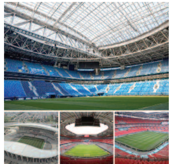
Az UEFA közösségi oldalán ismertette, hogy melyek lesznek az első számú kupasorozata fináléjának helyt adó stadionok: Szentpétervár (2022), Isztambul (2023), London (2024), München (2025)

Az EL 2025-ös döntőjét Bilbaóban fogják játszani. Az UEFA honlapja szerint az ír fővárosra és a baszk városra is azért esett a választás, mert az idei, részben budapesti rendezésű Európa-bajnokságon az eredeti tervekkel ellentétben egyetlen mérkőzést sem rendezhettek meg a világjárvány miatt.