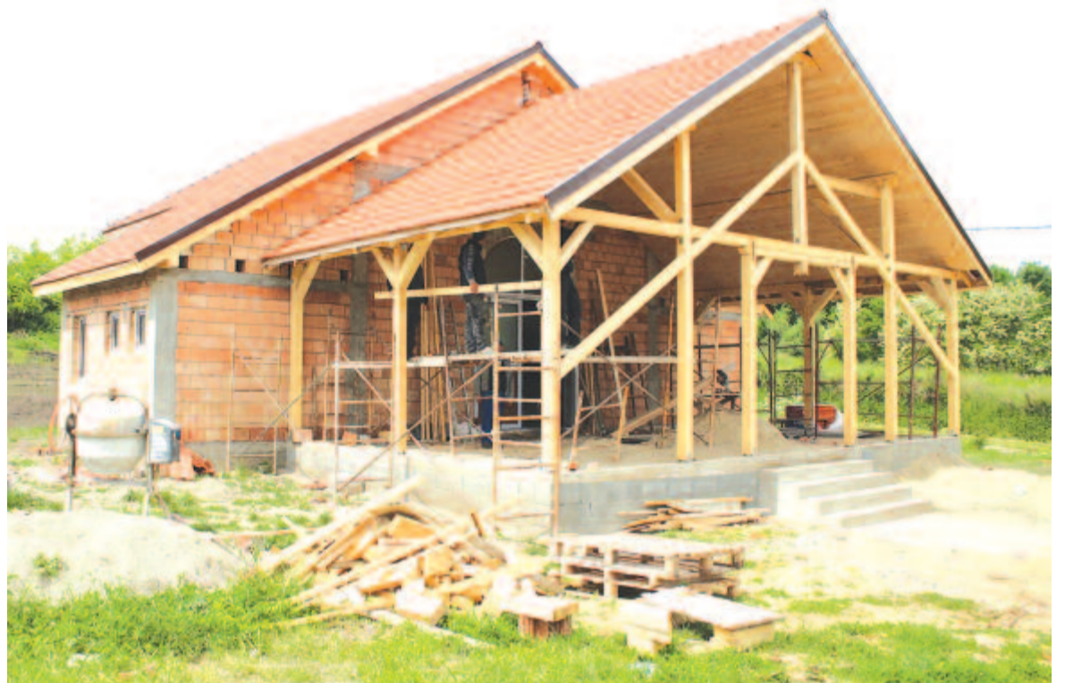
Épül az új halottasház

Az egyik legnagyobb gondot a községen keresztül vezető, frissen felújított megyei út okozza – Mikefalva és Abosfalva lakói keményen megszenvednek miatta. Eltűntek a sáncok, ami falun elképzelhetetlen. A kivitelező föld alatti csatornát fektetett le, ami szinte semmihez sem csatlakozik, így a két héttel ez-