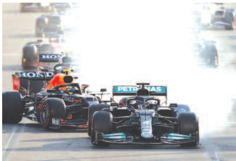
A futam újraindításánál Hamilton nagyot hibázott, és a mezőny végére esett vissza

* csapatok : 1. Red Bull 174 pont, 2. Mercedes 148, 3. Ferrari 94, 4. McLaren 92, 5. Alpha Tauri 39, 6. Aston Martin 37, 7. Alpine 25, 8. Alfa Romeo 2