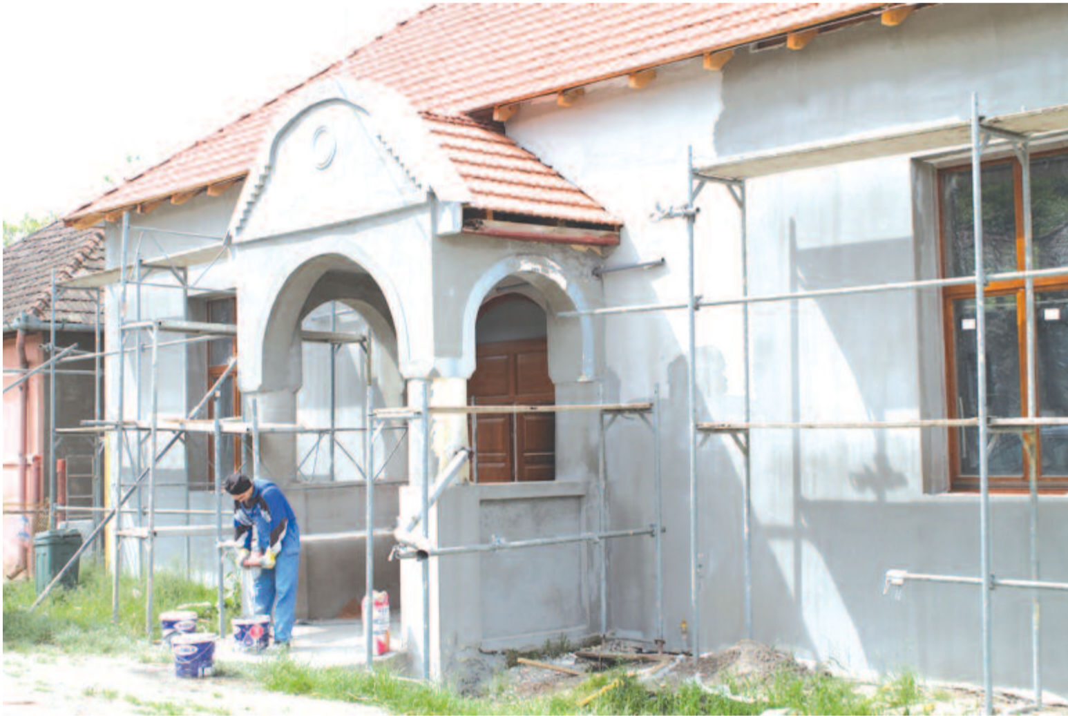
Felújítják a kultúrotthont