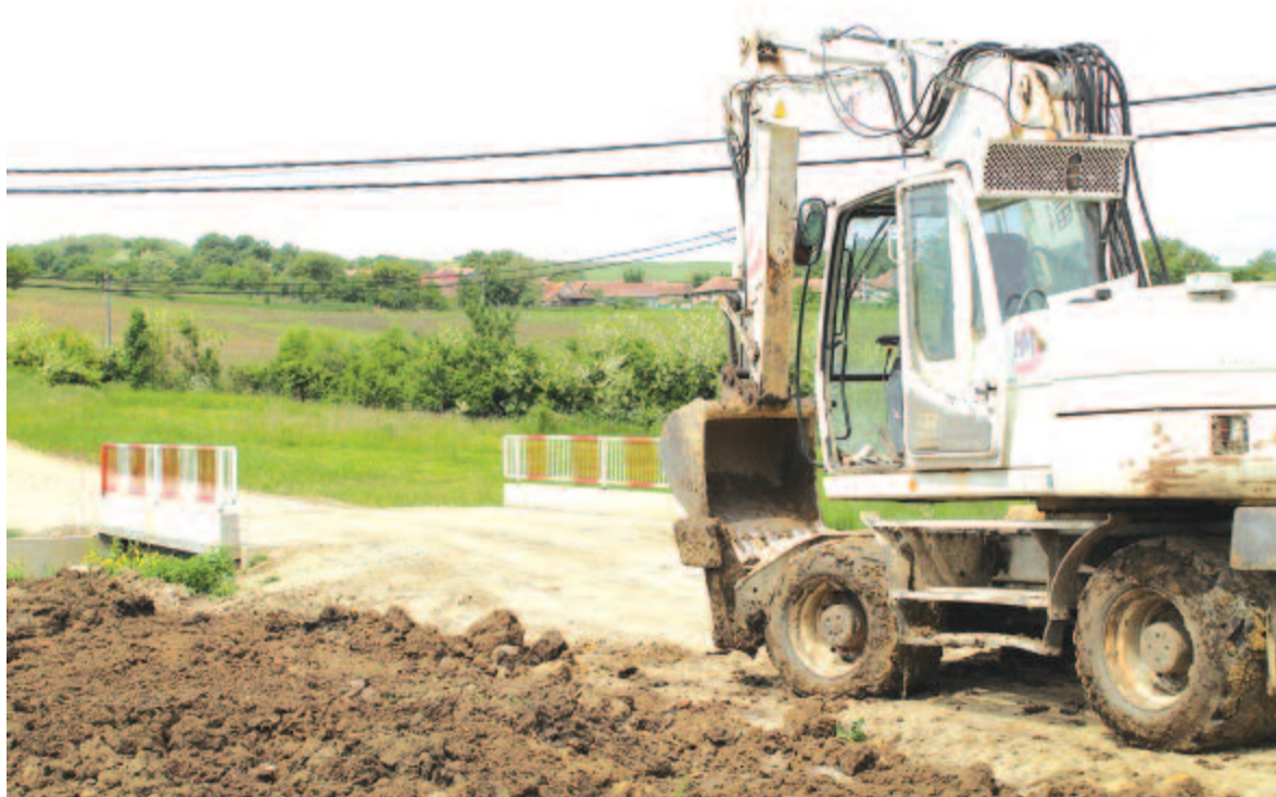
Tizenhárom hidat újítanak fel a községben