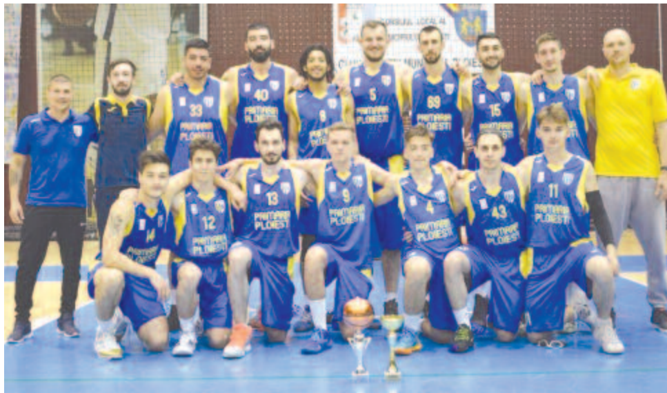
Ploiești-nek sikerült, Marosvásárhelynek nem