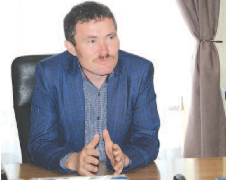
Béres János polgármester

Községszinten hat kilométernyi utca maradt aszfaltozatlan, de a múlt héten erre is elkészültek az előtanulmányok, várjuk a kiírást, hogy pályázhassunk. Ezek az utcákon kívül a község mindegyik útja, utcája aszfaltozott, és ha sikerül ezeket is leaszfaltoznunk, akkor elmondhatjuk magunkról, amit na-