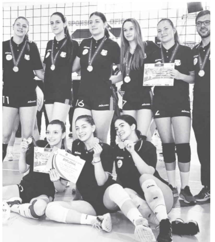
Ezüstérmes a CSU Medicina serdülőcsapata

talán a perspektíva hiánya teszi, hogy a marosvásárhelyi fiúcsapatok esetében az egyetlen pozitívum, hogy egyáltalán működnek. A lányoknál viszont hatalmas törést jelentett annak a generációnak a támogatás megszűnése miatti szétszéledése, amely 2019-ben országos bajnokságot nyert a CSM színeiben. Az idén a CSM egyetlen csapata sem vett részt az ifjúsági bajnokságokban, noha év elején még azt ígérték, nem szüntetik meg a csoportokat. Az Arena klub égisze alatt gyűltek össze azok a játékosok, akik a kisebb korosztályokból megmaradtak idénre nagyifjúságiként, és ez a csapat a döntő tornán egyetlen gól miatt maradt le az elődöntőkről. Végül a 6. helyen végzett.