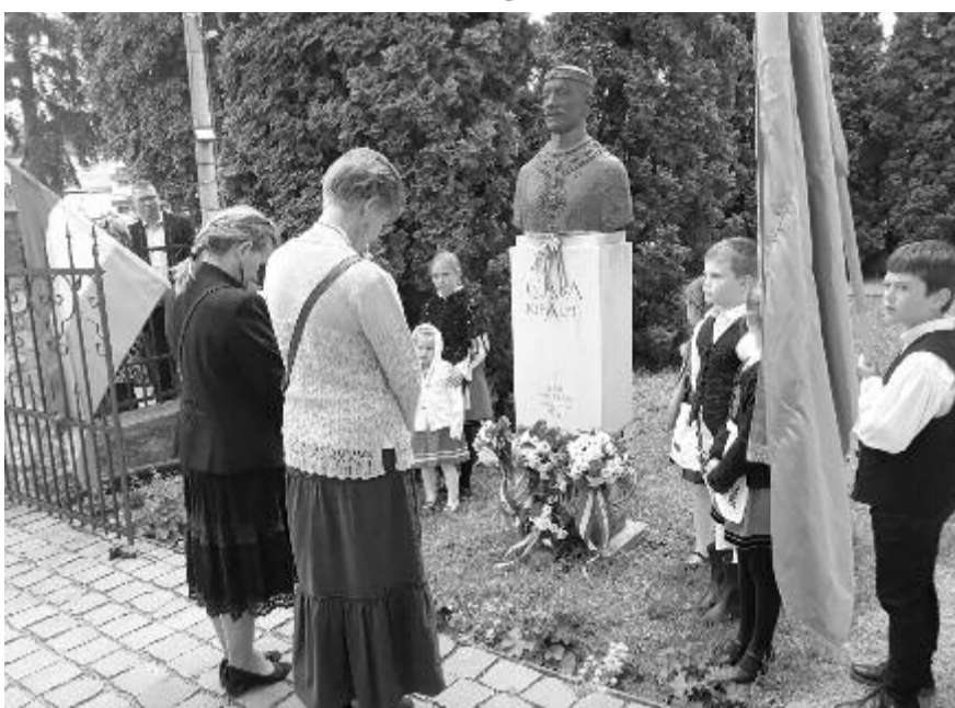
Nyolcadjára koszorúzták meg a legendás királyfi szobrát a tiszteletére rendezett ünnepen

Évente május utolsó vasárnapján emlékeznek Nyárádszerezében Csaba királyfira. A fennálló közegészségügyi helyzet miatt idén csupán szerény ünnepély volt, míg az elmúlt években történelmi előadások, könyvbemutatók, koncertek, labdarúgó tornák, díjkiosztó is. Vasárnap kis zenés-irodalmi műsorra került sor a főtéri református templom-