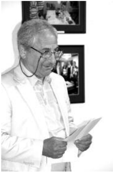
Káli Király István

– Az első képek Pusztakamarást ábrázolják, aztán következnek a református templom, ahol Sütő számtalanszor megfordult, a Magyar utca, a szülői ház, a Sütő család három generációja, a szülők, az író és az egyik unoka. Az író pusztakamarási emberek, gyermekek körében is láthatjuk, de híres személyiségek – Oláh Tibor, Székely János, Kányádi Sándor, Sinkovits Imre, Czine Mihály, Király Károly – társaságában is, megjelenik a sikaszói ház képe a kapuállítás alkalmával. Látható egy olyan felvétel is, ahol a Nemzeti Színház nagytermében zsúfolt ház tapsol Sütőnek. Az 1990 márciusi drámai eseményekhez fűződő képeket nem állítottuk ki, mert nem szeretjük volna sérülten vagy a betegágyon ábrázolni. A kiállítást a temetésen készült felvételek zárják, amint megrendült arcú fiatalok állnak a koporsó mellett, látható a tengernyi gyászoló, akik az író utolsó útjára kísérik a vártemplomi ravataltól egészen a református temetőig. Aztán következnek azok a fotók, amelyek halála után a Sütő-memlékezéseken készültek – mondta Kilyén Ilka.