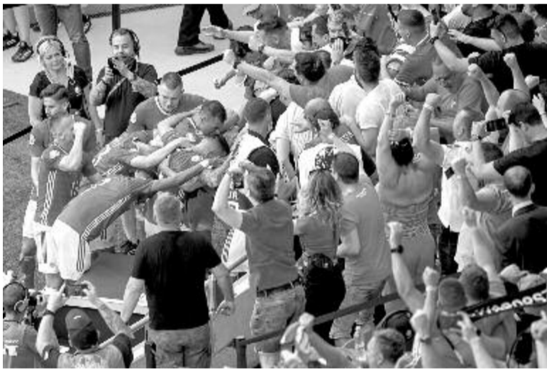
Az első gólt ünneplő magyar csapat és szurkolók.

A tréner kifejtette, nem volt biztos abban, hogy a játékosai képesek lesznek-e ilyen jó teljesítményt nyújtani. „Az első találkozó után