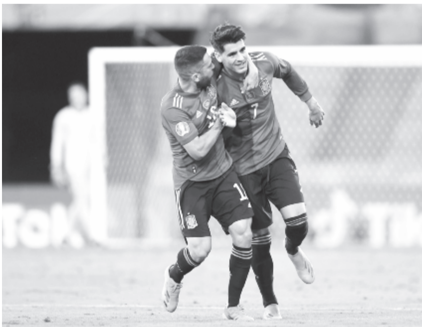
A sevillai mérkőzés 25. percében Spanyolország Morata góljával szerzett vezetést