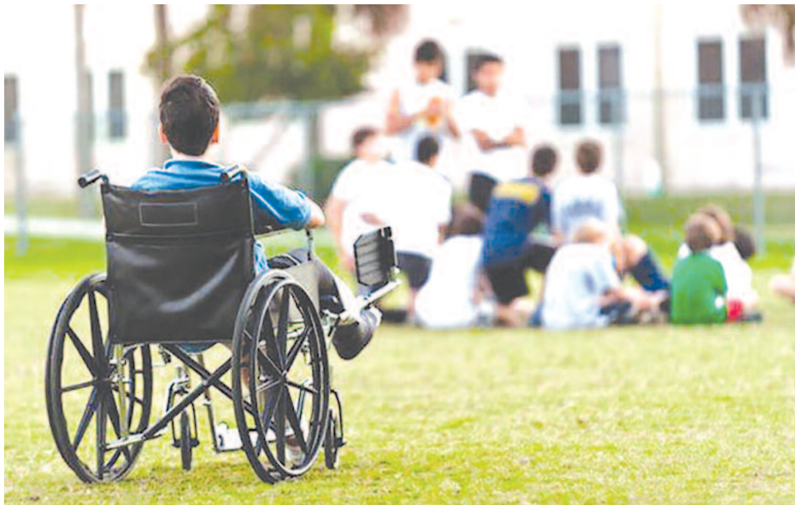
A felvétel illusztráció.

A fogyatékkal élő gyerekek szülei által régóta jelzett kellemtelenséget küszöböl ki az a törvénymódosítás, amelyet múlt héten döntő házként szavazott meg a képviselőház. Ennek értelmében nem kell többé kitenni a súlyos fogyatékkal élő gyerekeket és családjukat annak, hogy kétfévente vagy még gyakrabban bizottság elé menjenek azért, hogy meghosszabbítsák a fogyatékosági besorolási bizonylatot, hanem amennyiben két egymást követő alkalommal megkapja a legtöbb két évig érvényes iratot, a bizottság ezt követően a gyerek 18 éves koráig érvényes bizonylatot állít ki.