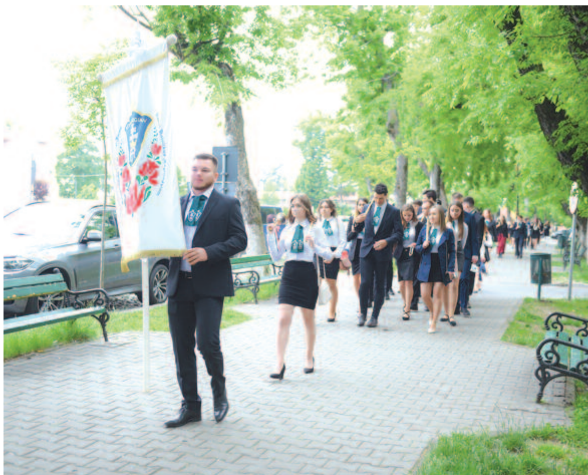
Felvonulás a Vár sétányon

– Igen. Voltak tanár-diák meccsek a Sapientia műfüves pályáján, nagyon jó hangulatban. Engem nagyon boldogít, hogy megvolt a kellő türelmük ahhoz, hogy megvárják azt, hogy méltóképpen kerüljön sor ezekre az eseményekre. A tanév elején jeleztem a végzős osztályoknak, hogy próbáljuk meg kihasználni azokat az alkalmakat, amikor valamit meg lehet tartani. Ezért javasoltam nekik, hogy a Szent Imre-búcsúkor – november 5-én – tartsuk meg a szalagavatót. Azonban ők bíztak abban, hogy lesz lehetőség arra, hogy színpadon, közönség előtt, a hagyományos formában tartsuk ezt meg. Az év őket igazolta. Bevallom, hogy amikor vörös zónában volt a város, akkor biztos voltam benne, hogy elszalasztották azt a lehetőséget, és nekik is csak annyi fog jutni, mint a tavalyi végzős osztálynak. (Tavaly a ballagási szentmise azzal kezdődött, hogy először feltűzték a szalagokat, utána visszaültek a helyükre, és kezdődött a ballagás.) Szerencsére tévedtem. Minden a maga hagyományos formájában volt megszervezve.