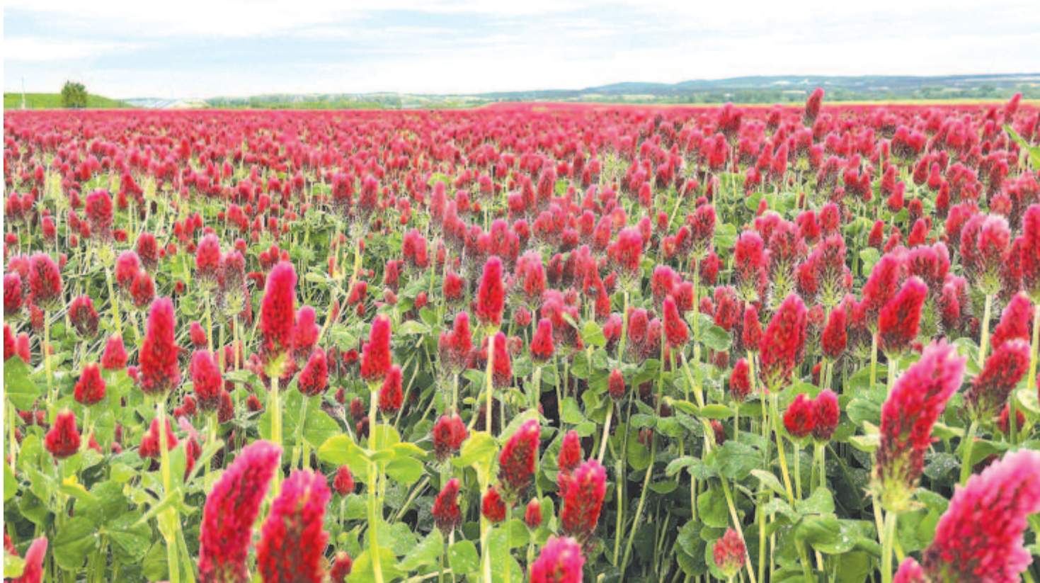
Méhlegelő – bíborherés rét – a jövő záloga

Kelt 2021-ben, a gyűrűs napfogyatkozás után egy nappal