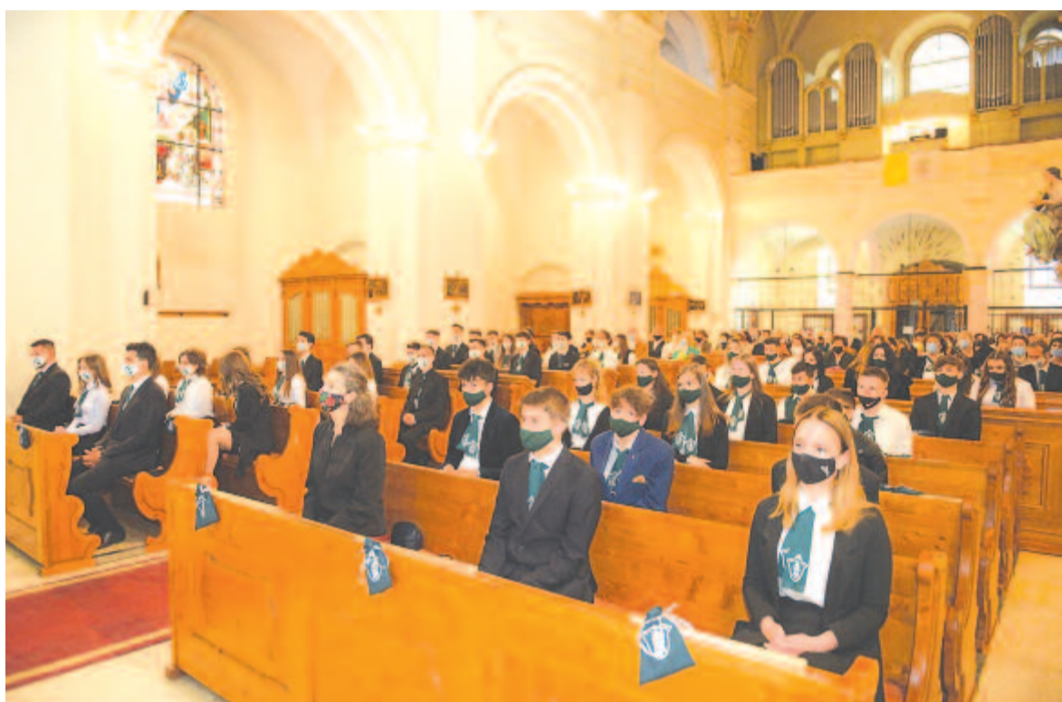
A ballagási szentmisén

– Szerencsésük volt azzal, hogy akkor, amikor ők kezdtek, az iskolában egy kimondottan aktív diáké-