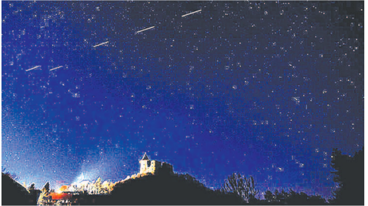
Starlink műholdak hada – a jövő

Tegnap, június 10-én volt 199 éve annak, hogy megszületett a Magyar Földrajzi Társaság alapítója és első elnöke, Hunfalvy János . Filozófiai, jogi és teológiai tanulmányai után, a berlini egyetem hallgatójaként szerette meg és választotta életpályául a geográfia művelését. A késmárki líceumban kezdett tanítani, azonban a szabadságharc alatt írott lelkesítő cikkei miatt állásából el-távolították, hat hónap börtönbüntetésre ítélték. Szabadulva, nagyszámú földrajzi ismeretterjesztő cikket írt a Greguss Ágost tal együtt szerkesztett Család könyve című folyóiratba. Bár mindvégig geográfusnak tartotta magát, egyik szervezője volt a Statisztikai Hivatal megalapításának. A Magyar Tudományos Akadémia – melynek 1858-ban levelező, majd 1865-ben rendes