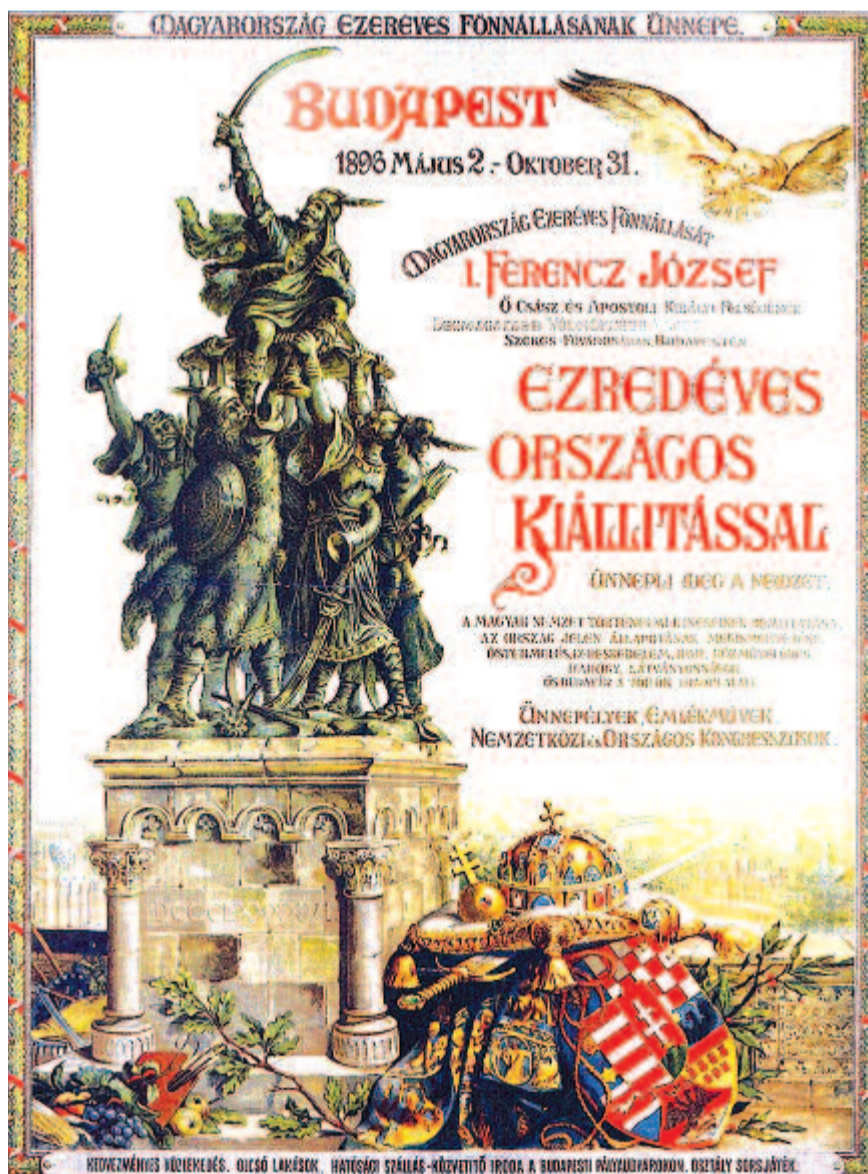
Az ünnepségek egyik központi elemének, a városligeti (budapesti) kiállításnak a hivatalos plakátja (Gerster Kálmán és Mirkovszky Géza alkotása)

A milicentenáriumi tiszteletére 1996-ban felújították a hét vezér szoboregyüttesét a Hősök terén, a megújult teret és az emlékmű megszületését 2001. augusztus 20-án ünnepélyes keretek között avatták újra. Az Országgyűlés 2011-ben nemzeti emlékhellyé nyilvánította a Hősök terét.