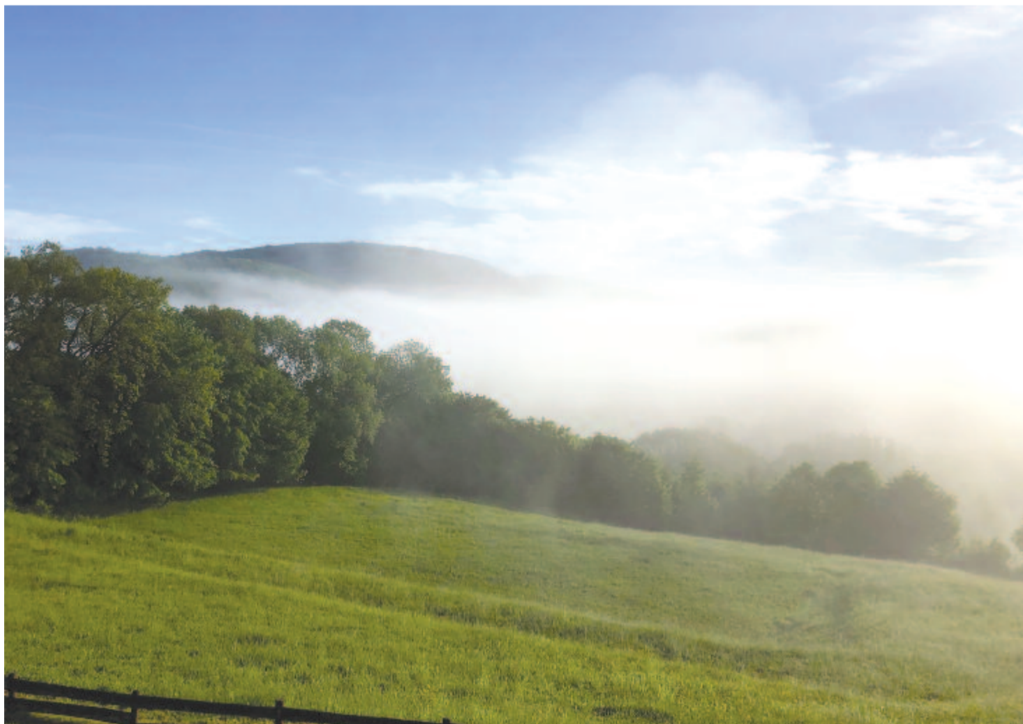
Héliosz szekerének keréknyomán felszakad a májusi éjszaka köde