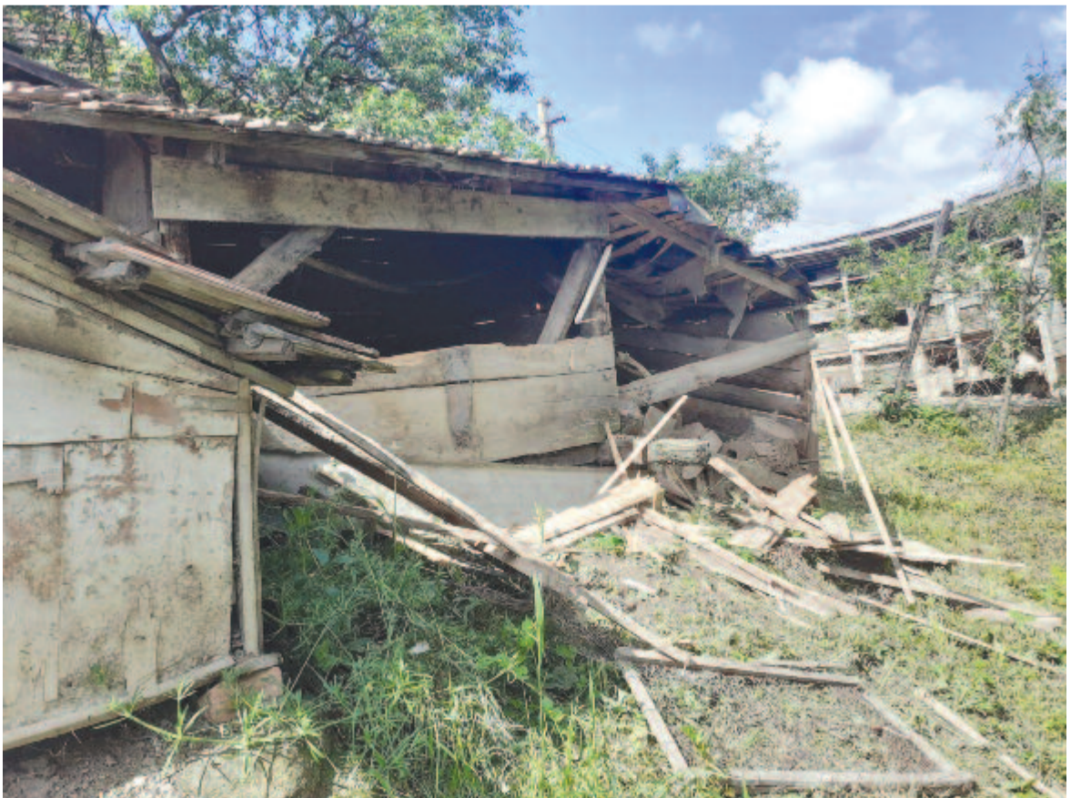
Az ólatat is tönkreteszik az éhes nagyvadak