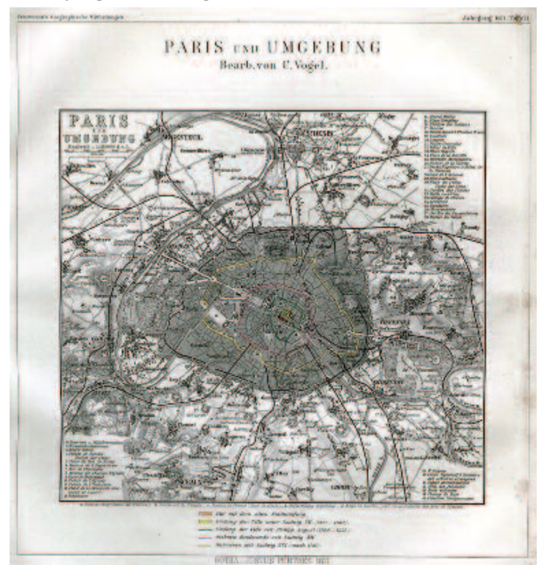
Párizs és környéke – térkép 1871-ből

össze 750 fő volt. A kemény megtorlás során 43 ezer embert tartóztattak le, a 95 halálos ítéletből 23-at hajtottak végre, a hadbíróóságok mintegy hétezer embert ítéltek börtönre vagy Új-Kaledóniába és Algériába történő száműzésre. Thiers-t augusztus 30-án a III. köztársaság első elnökének választották meg, a tisztségben 1873-ban a kommünt leverő MacMahon követte.