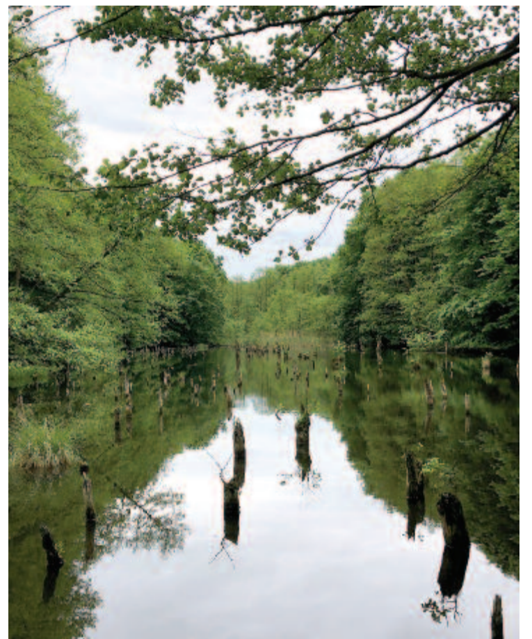
A Bakony-béli Eridanosz, a kis Gyilkos-tó Phaethón pusztította facsonkjai

Induljunk hát neki június havának. Római kori magyarázat szerint a hónap névadója Júnó volt.