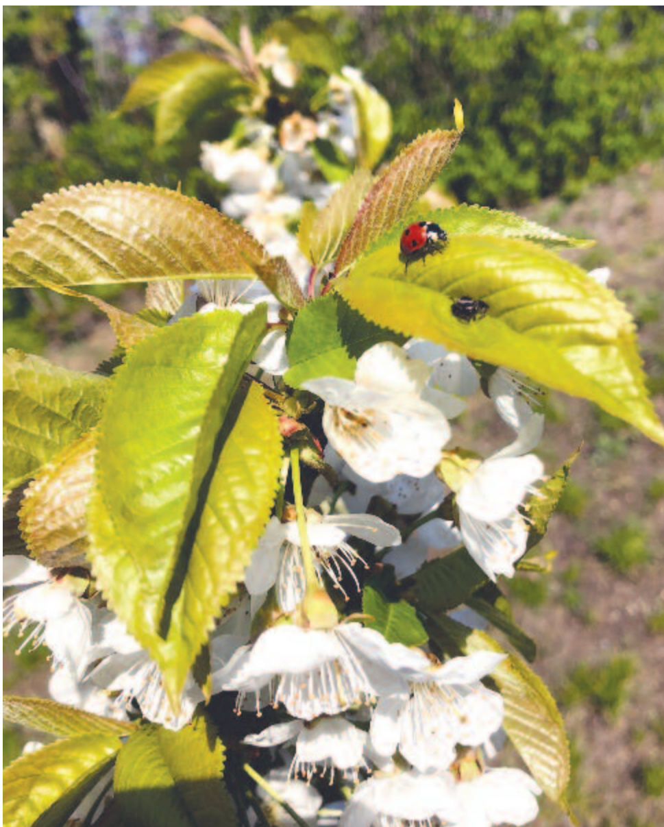
Pomona virágzó ágán húséges katicabogár szövetséges

Mintegy 6-12 m-re megnövő fa, igen széles, laposan boltozatos koronával, amely szabálytalan felépítésű. A kérge a fiatal és az idősebb fákon egyaránt sima, ezüstös vagy fénytelen szürke. Felülete a korosodás során némileg repedezetté vagy kissé pikkelyessé válik. A 6-12 centiméter hosszú levelek tagolatlanok, és körülbelül 5-7 cm szélesek, hosszúkás