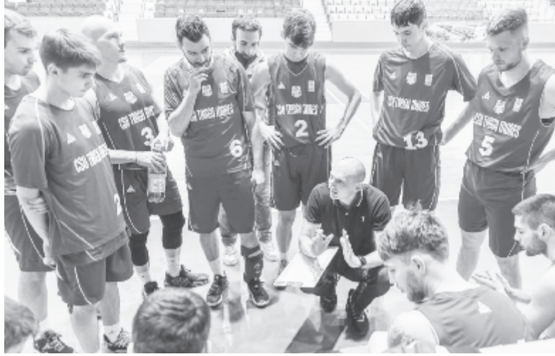
A szövetség döntése szélesre tárja a feljutás kapuját a Marosvásárhelyi CSU Medicina csapata előtt

Az országos ligában az alapszakasz utolsó előtti buboréktornáit rendezték meg, ezeken Voluntari és Konstanca nem volt érdekelt. Ugyanakkor Csikszereda és Foksány lezárták a szereplésüket az alapszakaszban, egyben a bajnokságban is, hisz nem jutnak be a rájátszásba, az alsóházban pedig nem folytatják. Kolozsvár újabb vereséget szenvedett, alapszakasz-győzelme azonban