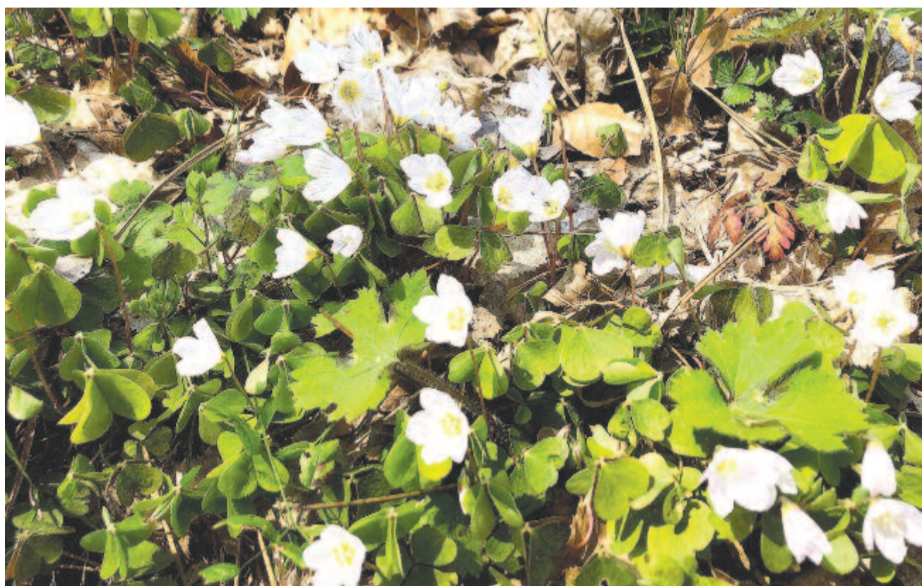
Pomona meztelen lábának érintésére váró madársóská virággyep

Maradok kiváló tisztelettel Kelt 2021-ben, május hajnalán