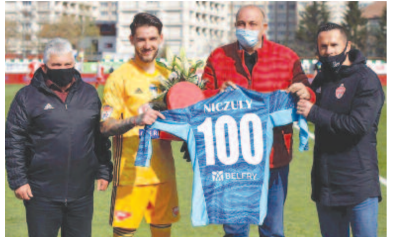
A háromszékiek kapusa az első játékos, aki a sepsiszentgyörgyi klub színeiben elérte a 100 mérkőzést az élvonalban

A végeredmény nem tükrözi híven a Sepsis OSK fölényét, másrészt Leo Grozavu játékosai néha túlságosan takarékosan játszottak.