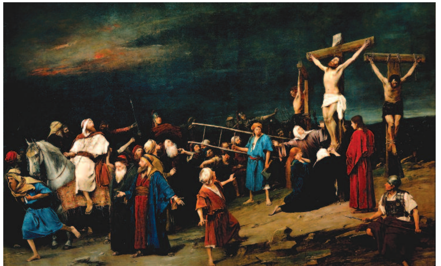
Munkácsy Mihály: Golgota

In: Csiha Kálmán: A cserépedény kincse, Kolozsvár, 2006