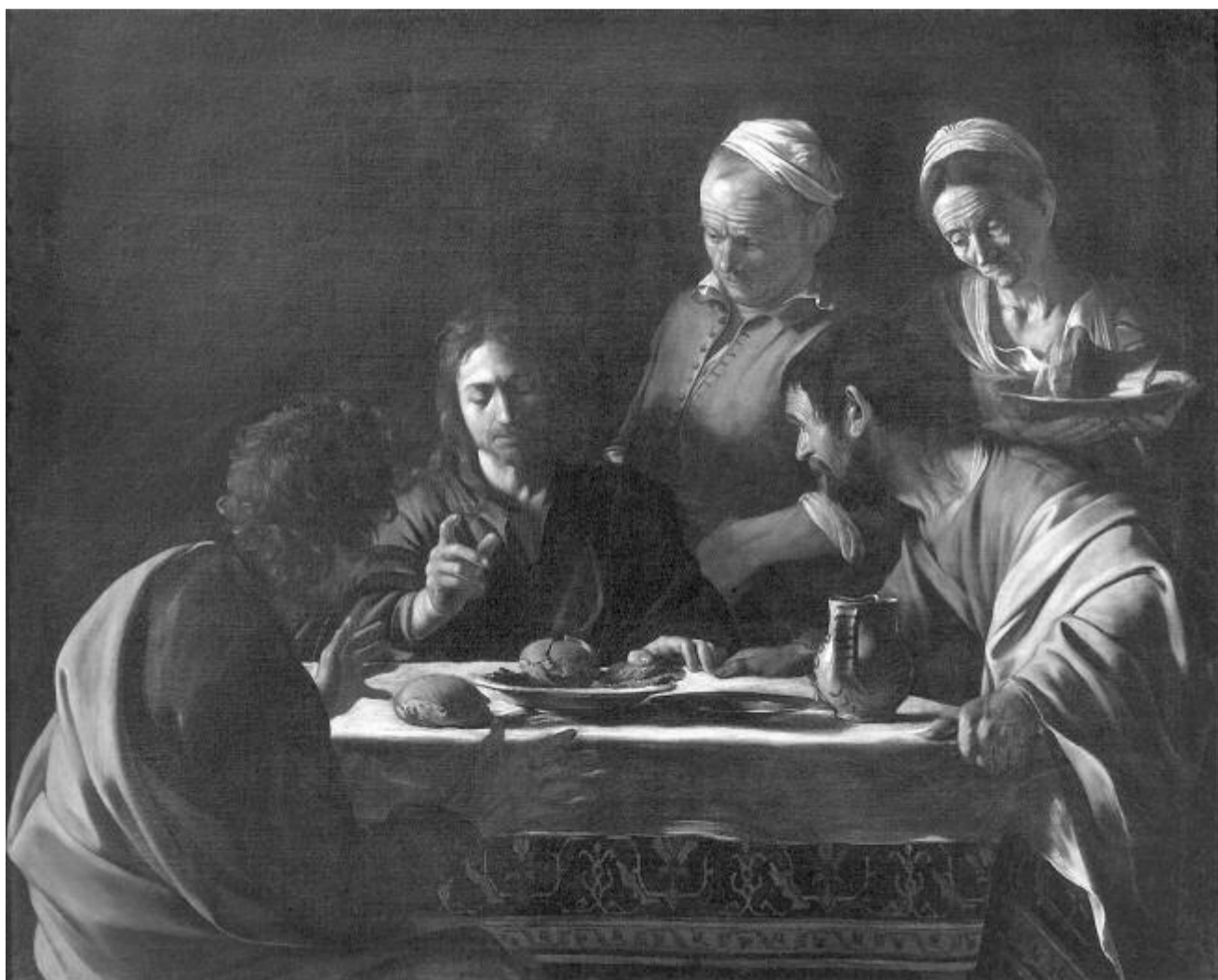
Caravaggio: Emmauszi vacsora – 1606