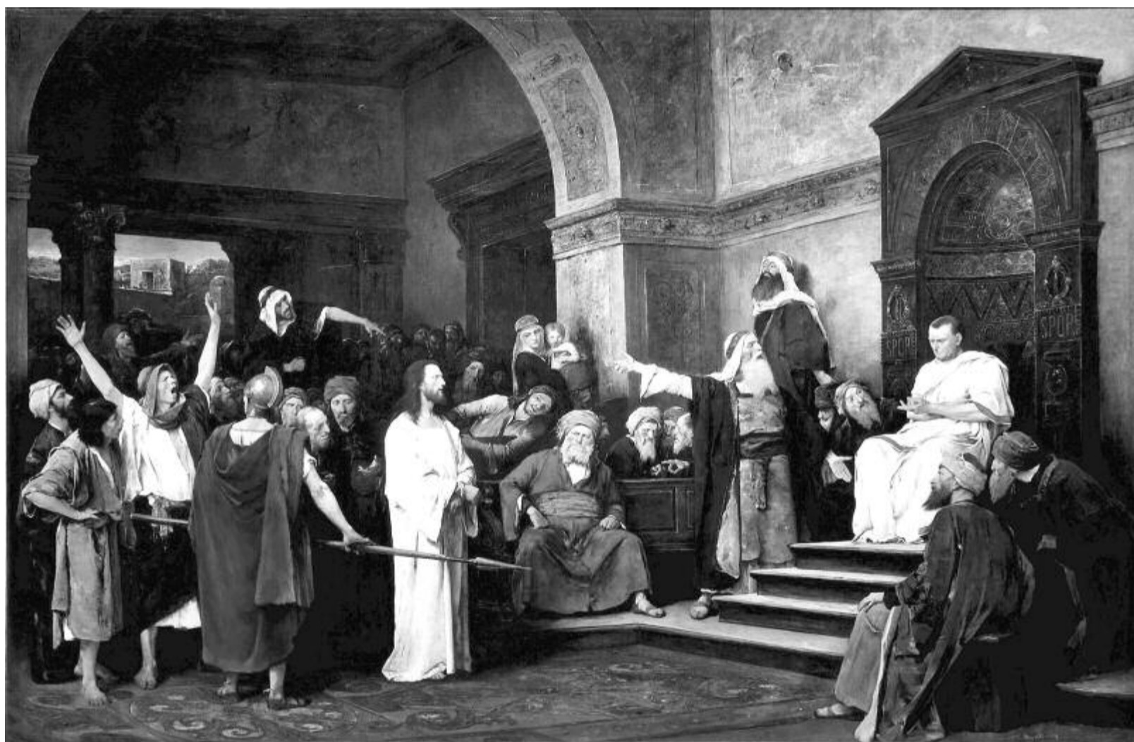
Munkácsy Mihály: Krisztus Pilátus előtt – 1881