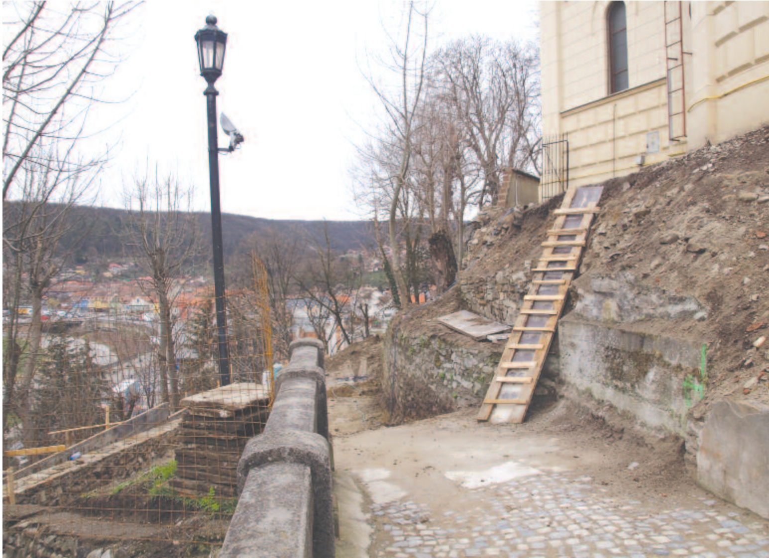
Segesvári vendégoldalunk a 6. oldalon