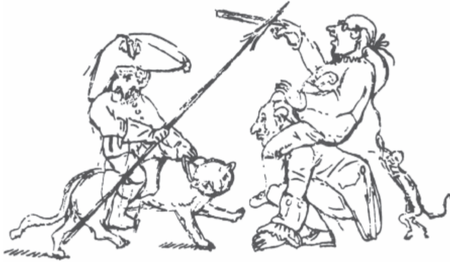
Hoffmann harca a bürokrácia ellen – karikatúra

A másik nagy lángelme zenéjéről ugyancsak a romantika sejtelmes stílusával fogalmazott Hoffmann. „Beethoven zenéje megnyitja a zsilipeket a borzongás, a félelem, a rémület, a fájdalom áradata előtt.” A látványos szökök kifejezőek a süket zeneszerző muzsikáját illetően: izzó gerendák döfik át a mélység birodalmát, gigantikus árnyékok, végtelen fájdalmak és szenvedélyek teszik szenvedélyessé a zenét. Míg Mozart a csodát ragadja meg a zenéjével, addig Beethoven felkavarja a rémület, az iszonyat, a gyász ködét, és felébreszti a végtelen sóvárgást.