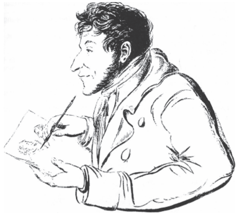
Hoffmann – önmaga karikatúrája

Az író, a mesélő, a jogász, a karmester, a zenekritikus, a rajzoló mellett Hoffmann zeneszerző is volt. Bár zeneművei nem korszakalkotóak, mégis figyelemre méltóak. Szimfonikus zenét is szerzett, de operái tették ismertté zeneszerzőként. Legsikeresebb operája az Undine című, amit 1816-ban mutattak be Berlinben.