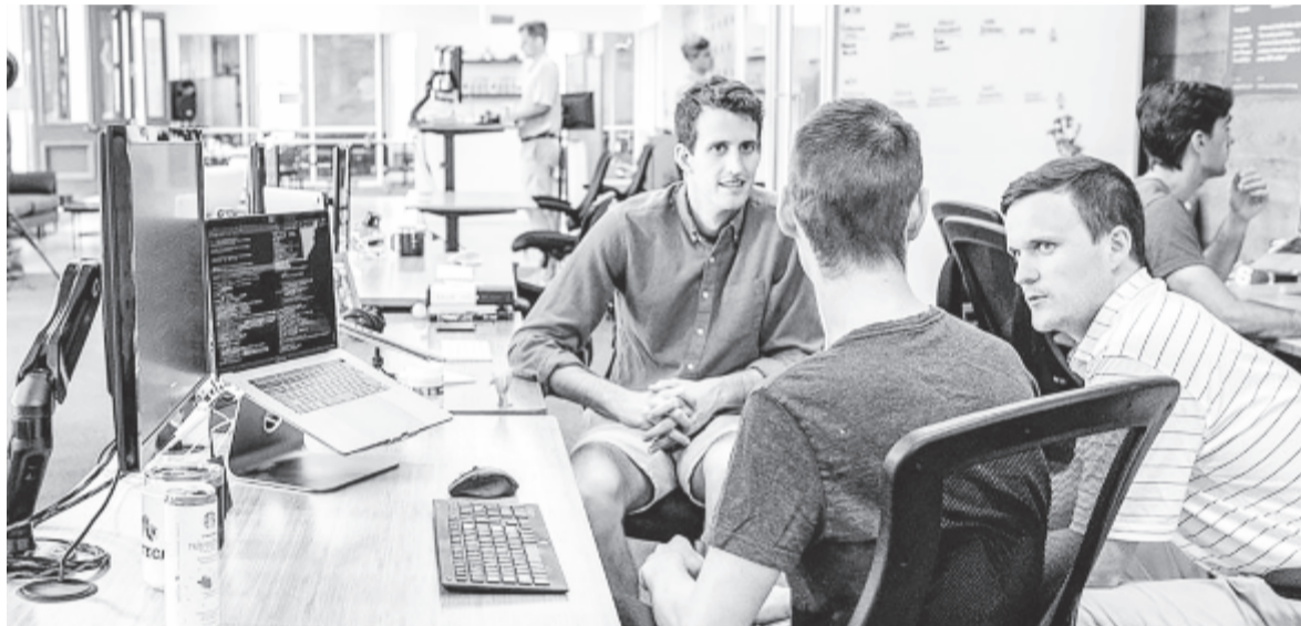
Diákszervezetek segítenek a tanulóknak munkát találni

– Ez nagymértékben függ a diákok érdeklődésétől. Az igényeket csak úgy tudjuk felmérni, ha különféle információk jönnek be hozzánk, és eddig nem találkoztunk sok ilyen jellegű megkereséssel. Viszont amikor úgy látjuk, hogy szükség van erre, és mindennapi téma lett belőle, akkor mindenképpen elkezdünk ezzel komolyan foglalkozni, és ilyen szempontból is segíteni fogjuk a diákokat.