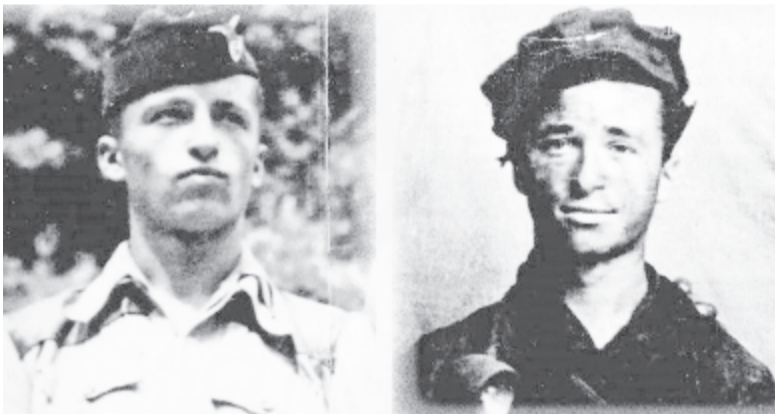
Balra leventeként, jobbra fogolyként