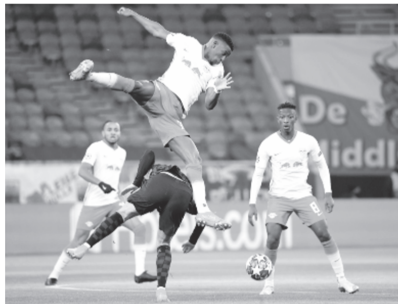
A Bajnokok Ligája-nyolcaddöntőben rendezett, Lipcsei RB – Liverpool volt az első a nemzetközi kupameccsek közül, amelyet Budapestre hoztak.

„Azt gondolom, hogy lesznek még mérkőzések – jegyezte meg a szóvivő, aki azt is elárulta, hogy március 10-én női Bajnokok Ligája-meccset játszanak Magyarországon. – A tapasztalatok azt mutatják, hogy akár a topcsapatok, akár bármelyik európai csapat szívesen választja vagy választhatja Magyarországot, mi pedig szívesen látjuk őket. Az pedig fel-emelő érzés, amikor ezek a legendás edzők úgy nyilatkoznak, hogy remekül érezték magukat Magyarországon, kiválóak voltak a körülmények.”