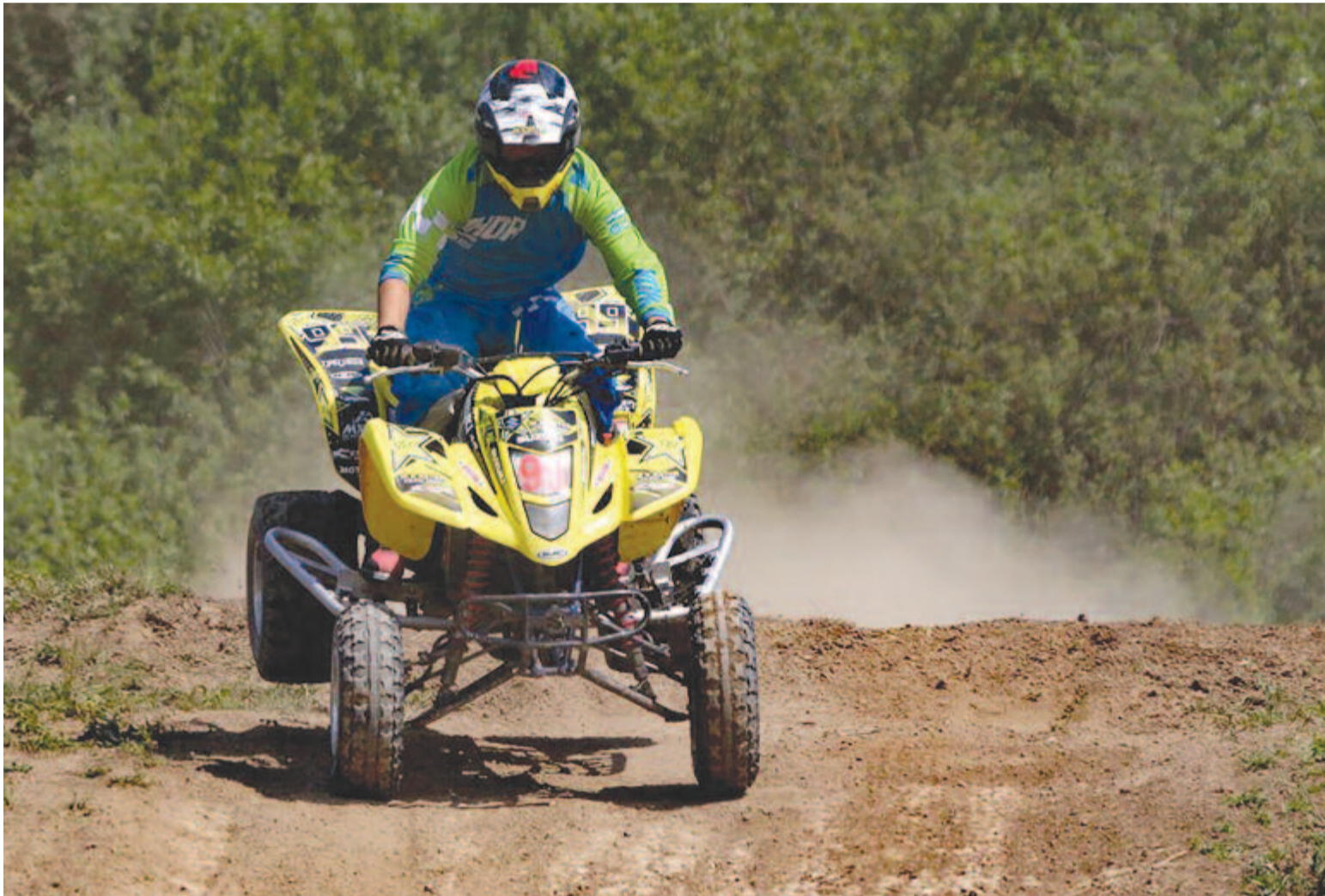
A felelőtlen motorozás sok kárt okozhat a természetben, de felügyelt és szervezett keretek között civilizáltan is lehet szórakozni