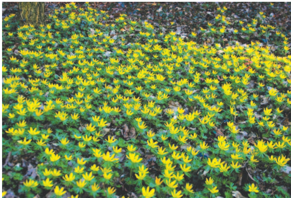
A téltemető virágtenger picit sárga szirmokba temeti a telet