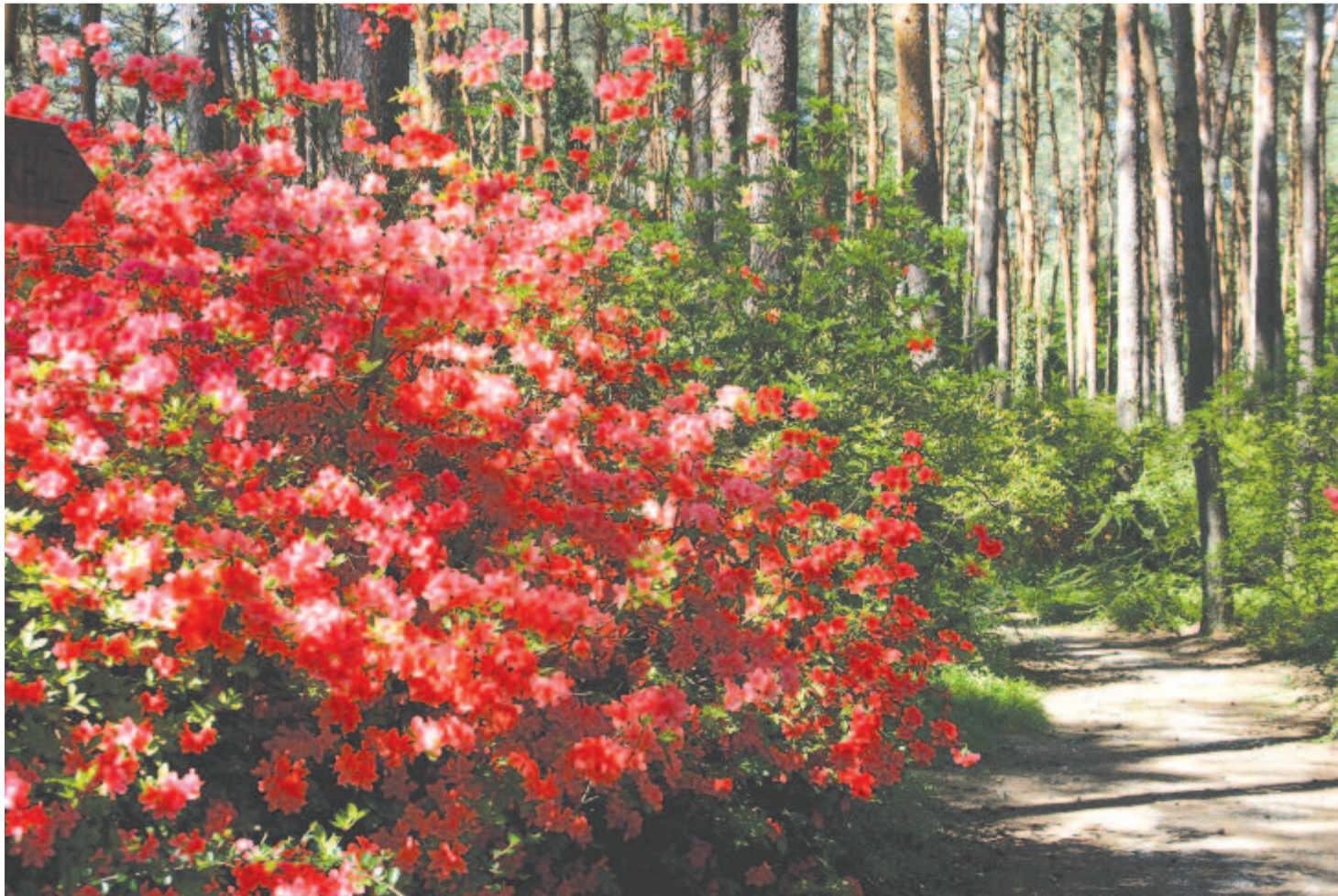
Rododendronvirágzás Ambrózy-Migazzi István jeli arborétumában

Kelt 2021-ben, kikelet havának ötödik napján