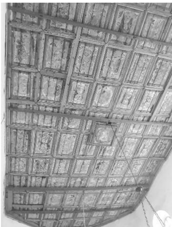
Az 1625-ben készült kazettás mennyezet Erdély egyik leghíresebb képirojának műve

A gyulakutai templom legrégebbi kincse egyértel-