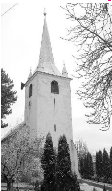
A településen átutazók nem is sejtik, milyen értékeket rejt a gyulakutai templom