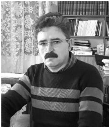
A lelkes a falu szülöttjeként vállalja a templom átfogó megújításának levezetését