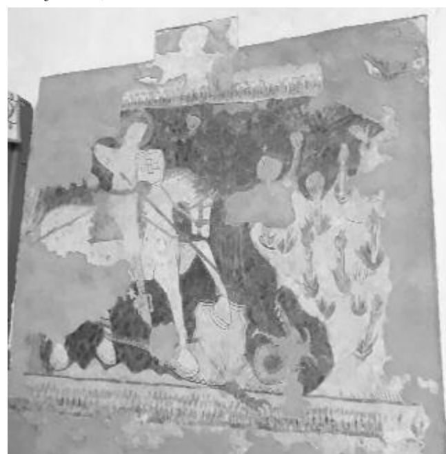
A mészrétegek alatt számos értékes falfestmény lehet, mint például a sarkányölő Szent György képe