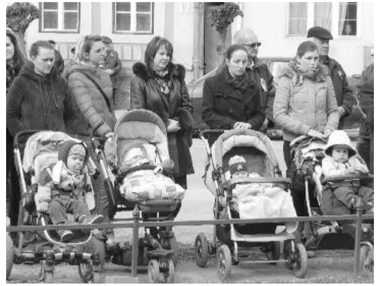
Egyre több támogatást kaphatnak az újszülöttek után az erdélyi kismamák is

Nemcsak a szovátaiak élvezhetik a támogatást, hanem bármely erdélyi magyar család, ugyanis a magyar kormány Köldökszínór programja révén hasonló, közel 850 lej értékű juttatás igényelhető. Az anyasági támogatás keretében gyermekenként egyszeri 64.125 forint (körülbelül 850 lej), ikertestvérek esetén gyermekenként 85.500 forint (mintegy 1.100 lej) igényelhető a gyermek születését követő hat hónapon belül. Az anya egyedül is kérelmezheti a támogatást. A gyermeknek rendelkeznie kell magyar állampolgársággal, tehát vagy az apa, vagy az anya, vagy mindkettő magyar állampolgár kell legyen. Szükséges dokumentumok: az anya személyazonosító igazolványa, az egyik szülő lakcímkártyája és honosítási okirata, az anya bankszámla-