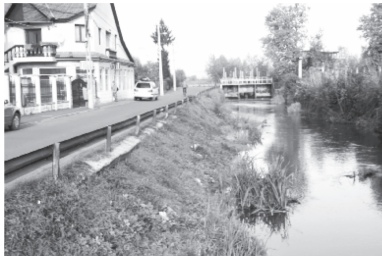
A malomárok partjára kerékpárutat terveznek

járdák és az útburkolat teljes felújításával, miután elkészülnek a műszaki csatornák, ehhez azonban közel 100 utcát kell telekelnünk. Ez is óriási munka. Többéves huzavona után mérföldkőhöz érkezett a központban levő egykori Patria mozi helyzete. Aláírtuk az épület