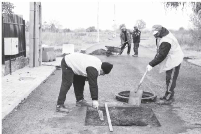
Közel száz utcát szeretnének felújítani

Az irány továbbra is a fejlődés, a profizmus, a rövid és hosszú távú tervek, a feladatok szakszerű kezelése, az itthon maradás ösztönzése és az életszínvonal növelése a városban. Továbbra is hangsúlyt fektetünk az önkormányzat gazdasági stabilizálására. A gazdasági körülményekhez igazítjuk belső szabályzatunkat. Keressük a bevételt növelő és kiadást csökkentő megoldásokat. Ennek a gazdaságosságnak a szellemében állítjuk össze a 2021-es költségvetést is, ami sokban meghatározza, hogy mit tervezhetünk és végezhetünk el az idén. Ez még folyamatban van, így erről még nem nyilatkozhatom.