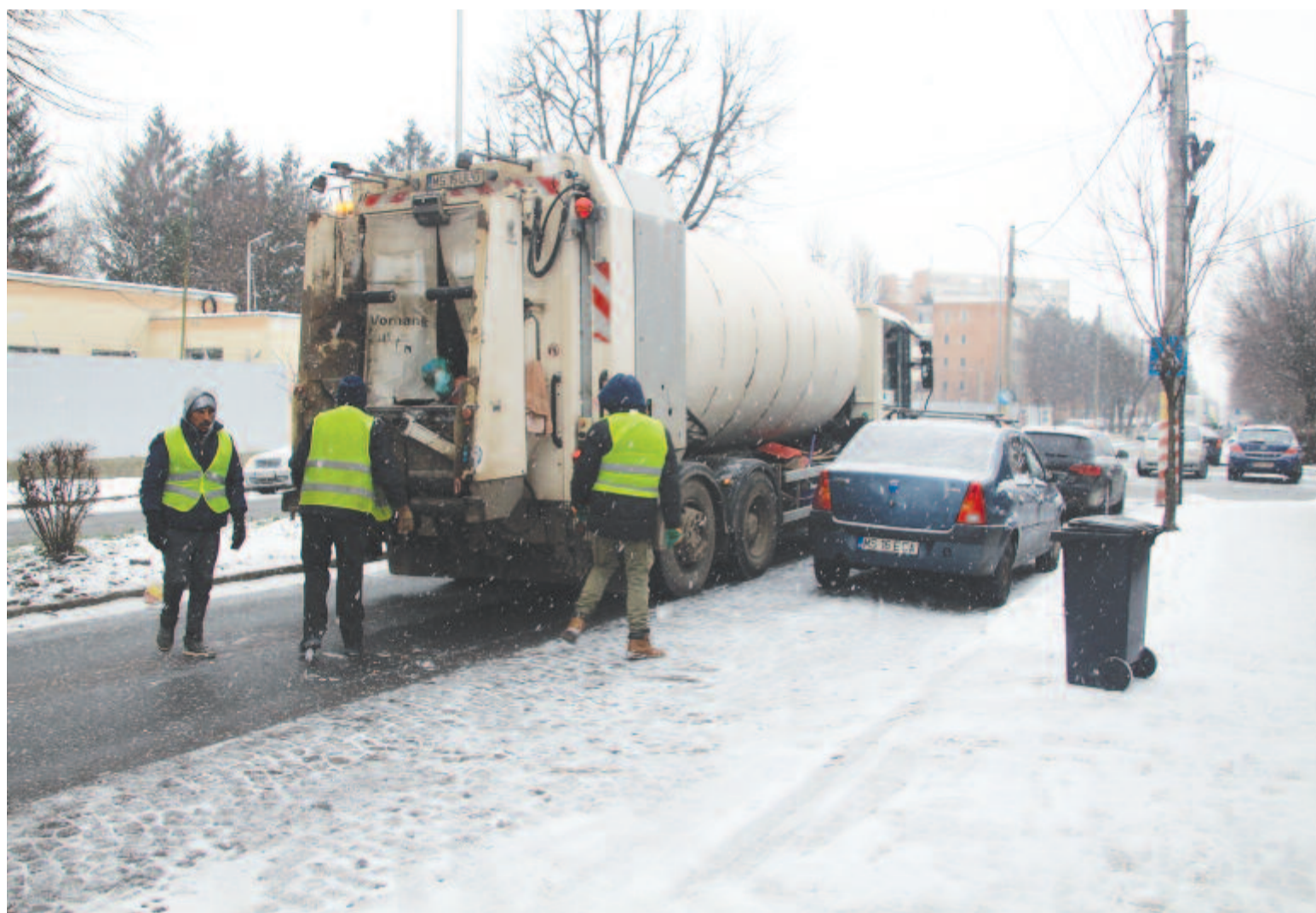
Az utcai és hóeltakarítást is saját kézbe vennék