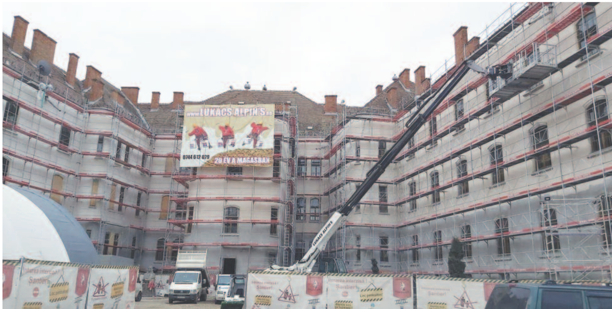
Felújítás alatt a Bolyai főépülete

– Egyértelműen volt pozitív hatása is az online oktatásnak. Sok új módszert tanultunk meg az elmúlt évben, megtanultuk használni azokat a platformokat, amelyeket eddig nem ismertünk. Továbbá nem titok az sem, hogy ahhoz, hogy az online oktatást tudjuk gyakorolni, sokat kellett dolgozni, keresgélni. Az internetes kereséseknek köszönhetően eddig nagyon sok olyan tananyagra találtunk rá, amelyeket a hagyományos oktatásban is használni lehet majd a technikai eszközöknek köszönhetően. A mostani generációnak pedig sokkal vonzóbb az, amikor a technika bevonásával oktatunk. Tehát magunkkal kell vigyük az újonnan megszerzett tudást és tapasztalatot, a megtalált oktató kisfilmeket, ezek mind szükségesek ahhoz, hogy a tananyag átadása az online eszközök segítségével az osztályteremben is létrejöhessen. Ha például egy kisfilmet megnézünk egy bizonyos lecke kapcsán, szemtől szembe meg tudjuk beszélni a diákokkal, ennek a segítségével mondjuk el az adott tananyagrészt. A technikát nem szabad kizárni az iskolából, az ott kell legyen a hagyományos oktatásban is.