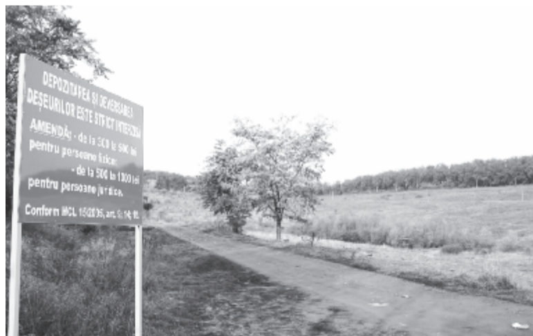
A Kerekerdő – itt lesz a szabadidőpark

– Beiktatásom óta minden egyes lakossági panaszt kivizsgáltunk, a legrövidebb idő alatt megoldást találtunk rájuk, és értesítettük az érintettet az ügy kimeneteléről. Fontosnak tartottam, hogy rendet teremtsünk a közszolgáltató vállalatnál is, ezért egyeztetünk a RAGCL vezetőségével. A hosszú távú, jó együttműködés érdekében sikerült megszűntetni a szolgáltató által felfújt, irreális számlázásokat az önkormányzat számára. Kitértő utánajárással felszámoljuk a Görgé-