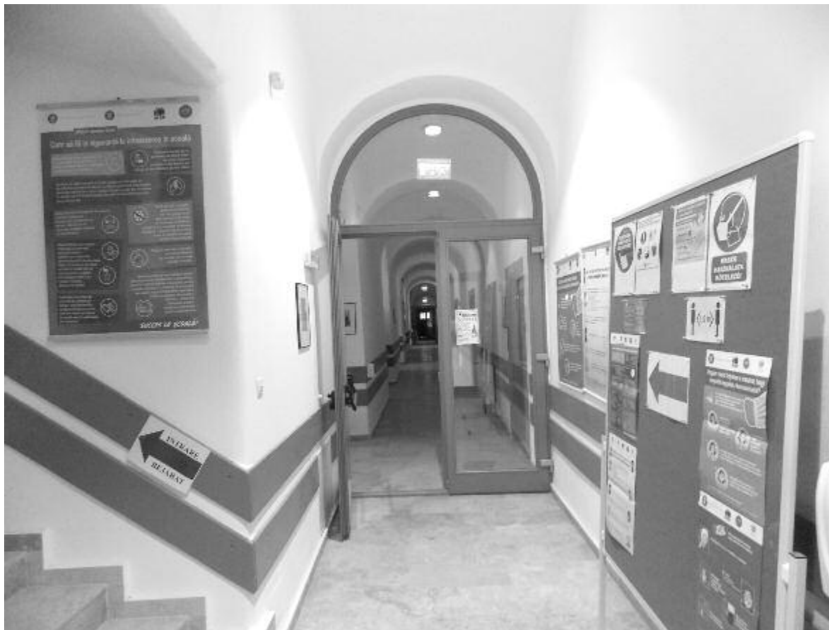
A felújított épület folyosója