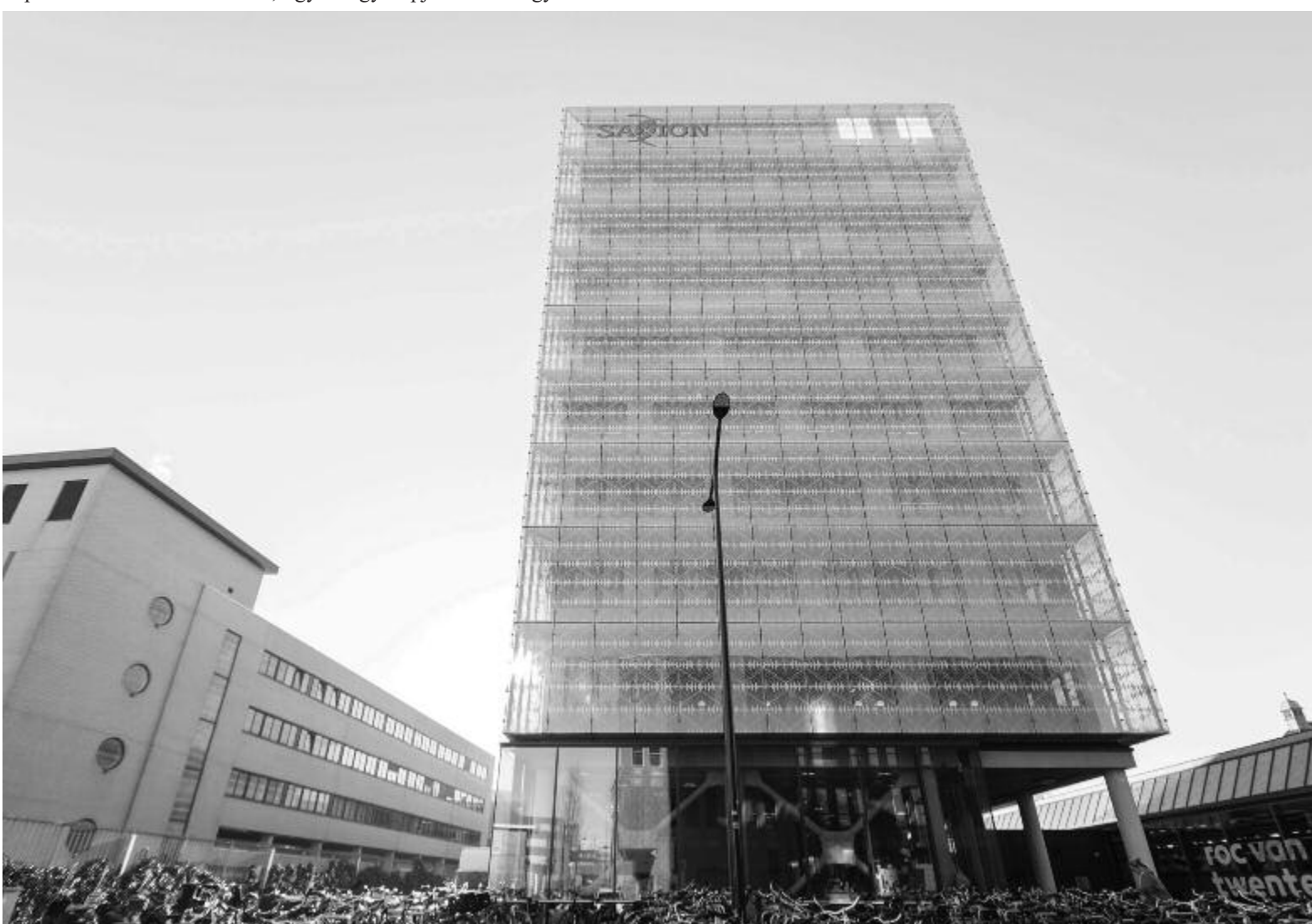
A Saxion egyetem Enschedében

– Több mint valószínű, hogy nem fogok hazaköltözni, vagy ki tudja? Az én szakterületemen nagyrészt minden Nyugaton történik, Hollandia, Németország és Franciaország körül vagy az Egyesült Államokban. Az összes játékfejlesztő cég ott van. Ezért több mint valószínű, hogy nem fogok hazaköltözni, mert ha kapok egy állást például Hollandiában, akkor itt maradok egy pár évet. Ezen a területen minden rang szerint történik, tehát először kezdő (junior) fejlesztő lesz valaki, utána normál, majd végül senior, és minél több a tapasztalata valakinek, annál könnyebben kap munkát. Tudomásom szerint otthon egyetlen nagy cég van, ami francia eredetű, de van egy kirendeltsége Romániában is, Bukarestben. Az lenne az egyik lehetőség a hazaköltözésre, ha náluk kapok munkát, vagy a másik az, hogy szabadúszó legyek, hiszen ez is nagyon megy ezen a területen.