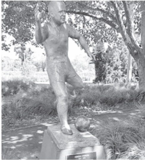
A szobor négy évvel ezelőtti (b) és mostani állapotában

magyar emigrációnak fontos környék, mivel az 1956-os olimpia legtöbb versenye ott zajlott, így a többi között a híres magyar-szovjet vízilabda-mérkőzés is, továbbá közel van az a stadion, ahol Puskás Ferenc – már edzőként – ausztrál bajnoki címet és kupagyőzelmet ünnepelhetett a South Melbourne Helas együttesével.