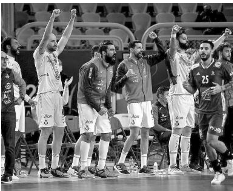
A spanyolok nyolc év után szereztek újra vb-érmet.

A játék képe a második félidejében sem változott, a spanyolok a 42. percben már hat, az 53. percben pedig hét találatot jobban álltak. A hajrában egy 4-1-es szériával még felzárkóztak a franciák, de a meccs utolsó két gólját a spanyol váloga-