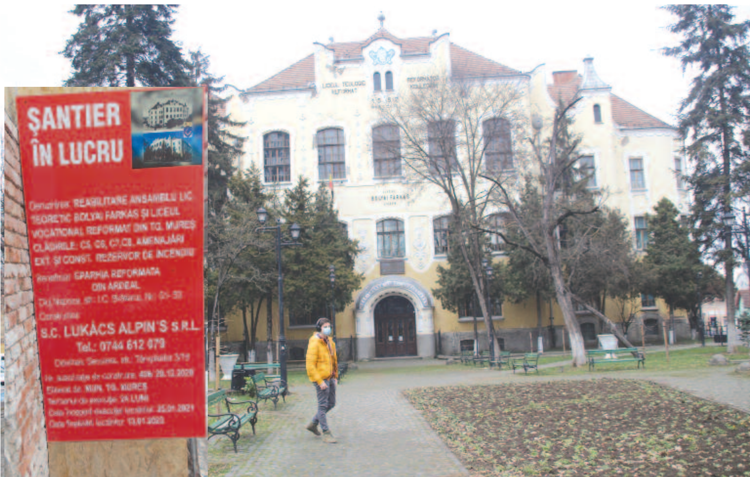
A szecessziós főépület is megérezt a felújításra