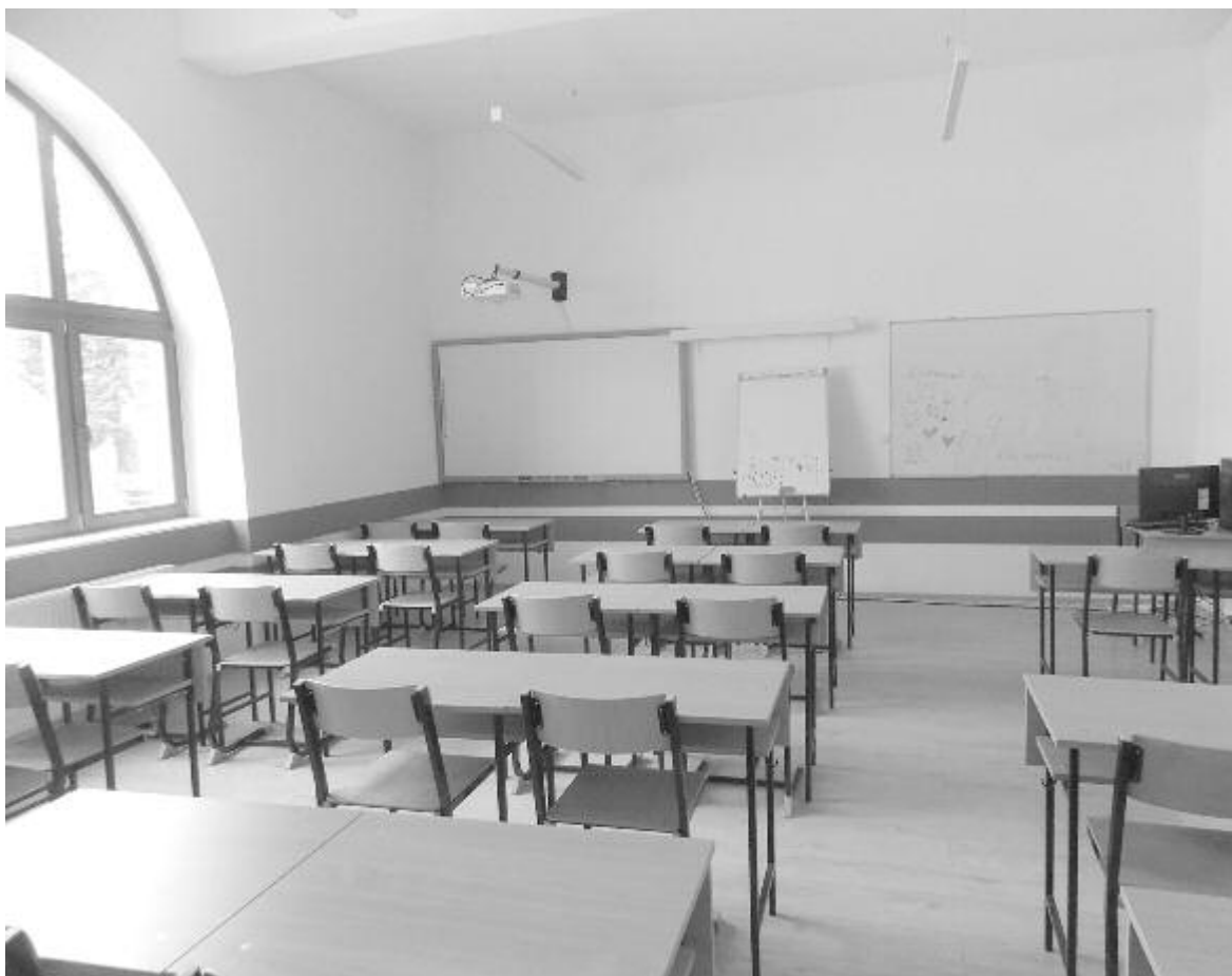
Egy felújított osztályterem

– Mi már leadtuk a tanárok óra-leosztását a következő tanévre, de a kerettanterv tárgyalása még folya-matban van. Ha módosítani fogják, az a teljes tervezést, szervezést fejre állítja. Az osztálylétszámok csök-kenése az iskoláknak az anyagi for-rások csökkenését jelenti. Ha 26-os tanulólétszámmal fognak működni az osztályaink, akkor ez hét osztály esetében 14 diákot jelent, ami a fejkvótarendszerben egy elég komoly hiány. Ha a fejkvótát meg-emelik, és a 26-os létszám annyi forrást jelent, mint a 28-as, akkor egyensúlyban leszünk – reményke-dik az igazgató.