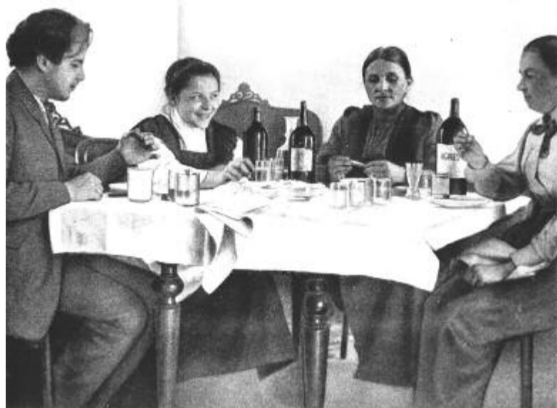
Pozsonyi ebéd 1901 nyarán: Bartók Béla, húga, Elza, Irma néni és a zeneszerző édesanyja

Ízig-vérig tudós volt – a muzsika tudója is. Pozsonyban nem volt olyan jelentős zenei esemény, amelyen nem lett volna jelen. Az előadásokról mindig sajátos értékítéletet mondott, melyek tükrözték páratlan műveltségét és építő, jó szándékát. A jelenléte is mércének számított. „Távozása kézzelfogható és tartós veszteséget jelent Pozsony zenei életében” – írta róla Pavol Polák.