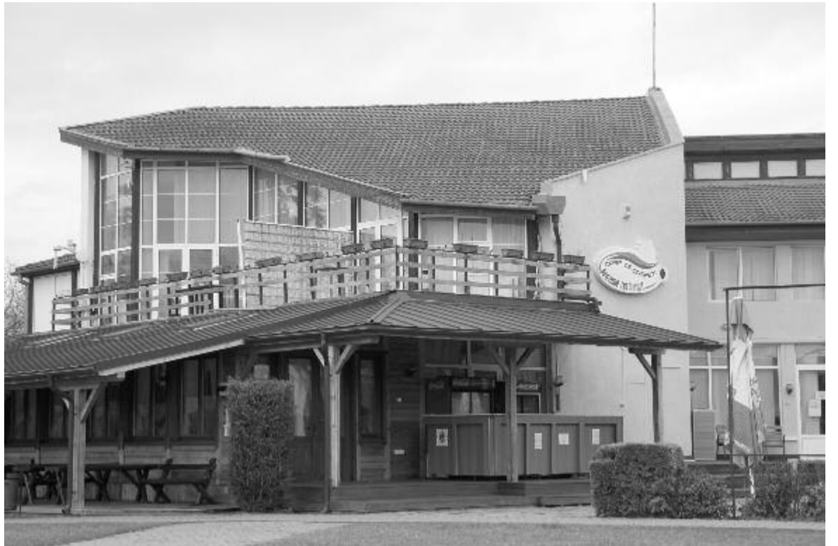
A Marosvásárhelyi Polgármesteri Hivatal vikendtelepi vendégházában oltópont működik

Megyénkben a február 24-i adatok szerint 15 diáknak és 17 pedagógusnak volt pozitív a Covid-19-tesztje. (bodolai)