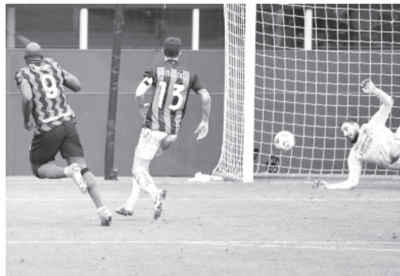
Lukaku belövi az Inter harmadik gólját az AC Milan elleni olasz rangadón.

* Francia Ligue 1, 26. forduló: Brest – Lyon 2-3, Lens – Dijon 2-1, Lorient – Lille 1-4, Montpellier HSC – Stade Rennes 2-1, Nantes – Olympique Marseille 1-1, Nice – Metz 1-2, Nimes – Bordeaux 2-0, Paris St. Germain – AS Monaco 0-2, St. Etienne – Reims 1-1, Strasbourg – Angers 0-0. Az élcsoport: 1. Lille 58 pont, 2. Lyon 55, 3. Paris St. Germain 54.