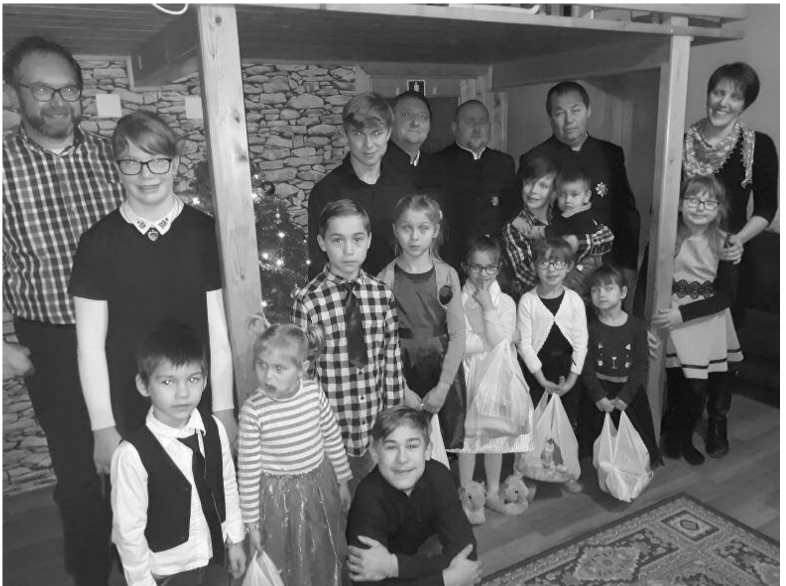
Örömmel fogadták az ajándékokat az abodi otthon lakói, hiszen odahaza nem mindeniküknek jut