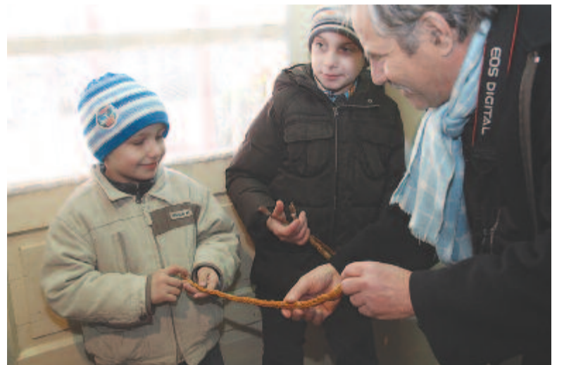
Jól szolgálták az aprószenteki vesszők

szédra bízták. Oda küldték a fiúgyermeket mustármagot kérni, ezt ő kellett megkeresse, például az ágy alatt, s amíg keresgélte, vesszővel, seprűvel a fenekére verték, aztán jutalmul megajándékozták. Ez is a protestáns falvak sajátossága (például Szabéd, Szentgerice, Márkod,