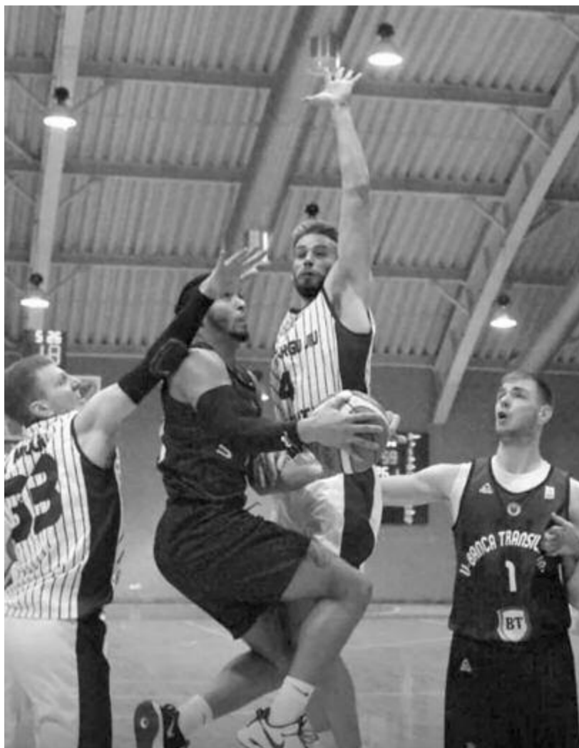
Galac után a házigazda Zsilvásárhelyt is legyőzte a Kolozsvári U-BT csapata, amely eddigi összes mérkőzését megnyerte.

* Nagyszeben: FC Argeș Pitești – SCM U Craiova 77:79, Nagyszebeni CSU – Bukaresti Dinamo 76:87, Dinamo – Pitești 82:83, Craiova – Nagyszeben 81:84.