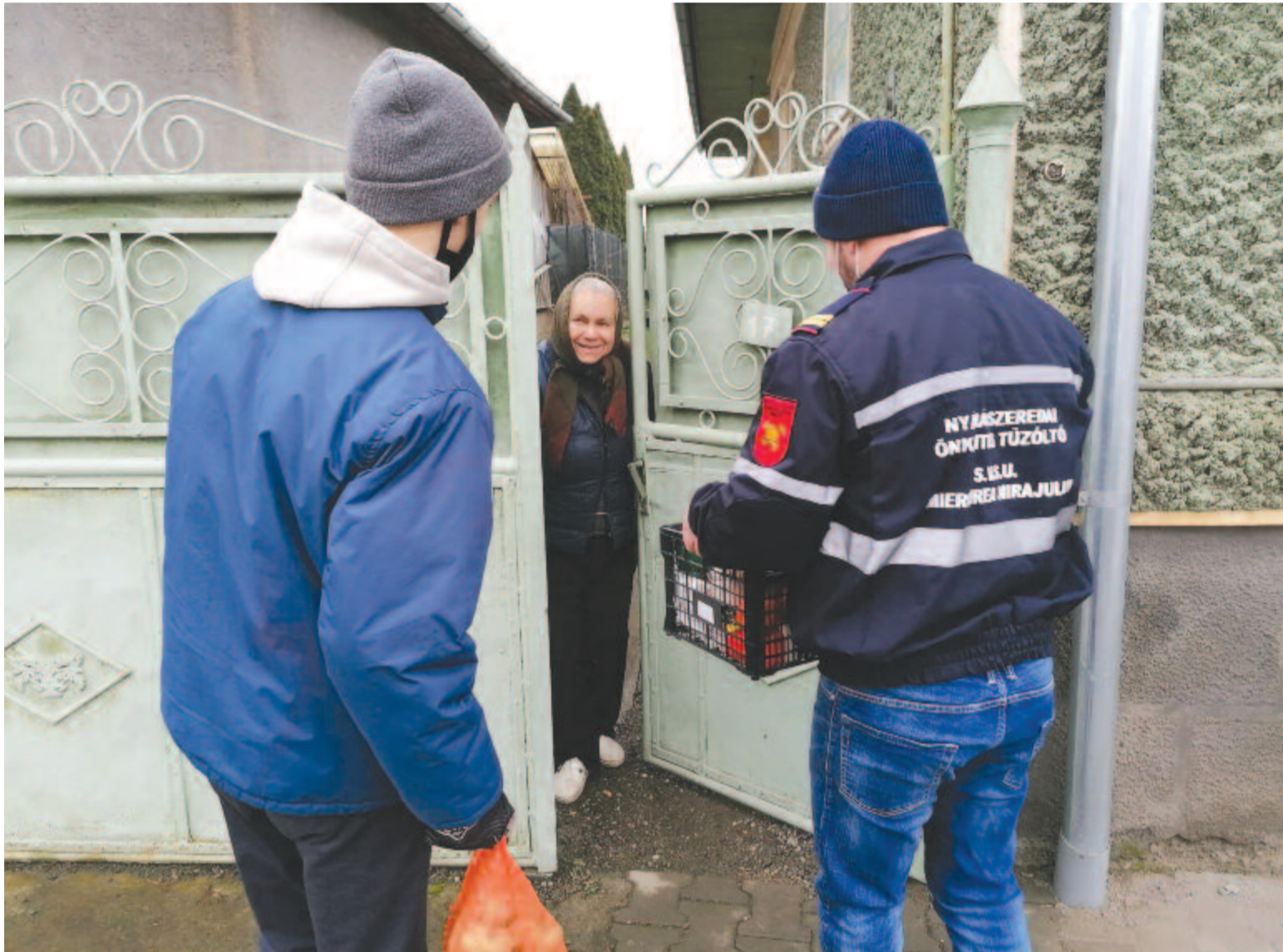
Nyárádszeredában és környékén bőséges csomag jutott idén a rászorulóknak