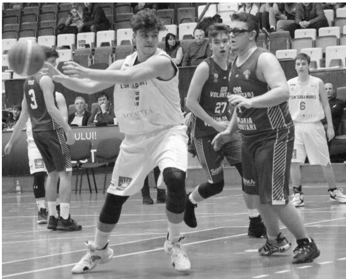
Marosvásárhely férfi- (vagy inkább fiú-) kosárlabdacsapata számára a Voluntari csikócsapatától elszenvedett vereség jelentette az utolsó „eredményt”. Visszavágni már nem sikerült, mert megérkezett a járvány.