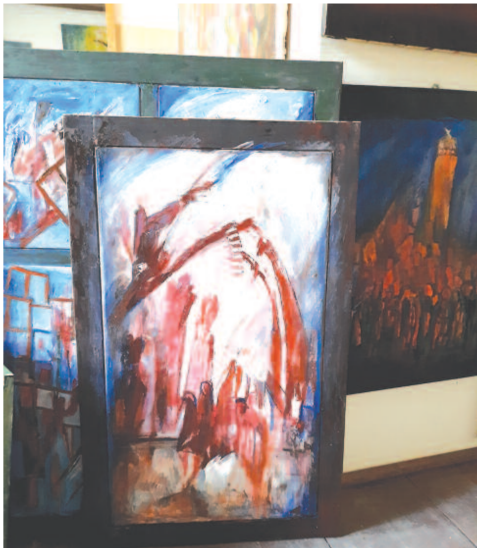
Készülő festmények a festő Vár-lak műtermében

Kedei a színek bűvöletében él, de rengeteg a mondanivalója. Ez grafikaiból, kifejező fekete-fehér rajzaiból is kiderül. És kirajzolódik azokból a vegyes technikájú, zsúfoltságukban is humánus üzenetet hordozó kollázsokból, amelyekből szintén egész tárlatnyit készített a művész. Ez a szép online kiállítás ezekből is figyelmet érdemlően felmutat néhányat.