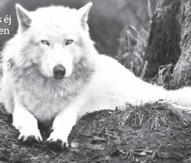
Centauri-szöveg és kép az író honlapjáról (centauriweb.hu)

Gondoltam, ha csak egy klasszikus farkasüvöltést hallanék a csillagos éj közepén, az is milyen jól esne már! – de olyan csönd volt, hogy majd megsüketültem tőle. Figyeltem, hallok-e baglyokat legalább. De semmi.