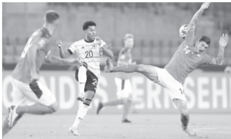
Csak döntetlenre játszottak Svájc ellen a Nemzetek Ligájában, kedden, edzőjük mégsem aggodnik

A németek az A divízió 4. csoportjában négy forduló után 6 ponttal másodikok. Az élen Spanyolország áll 7 ponttal, harmadik Ukrajna (6 pont), negyedik Svájc (2). Németország november 14-én az ukránokat fogadja, három nappal később pedig a spanyolok vendégeként zárja a Nemzetek Ligája-idényt.