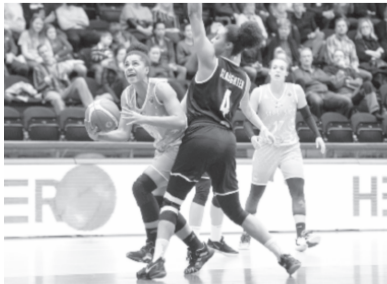
A képen támadó Sepsis SIC Euroliga-selejtezőt játszik szeptember végén a spanyol Spar Citylift Girona ellen. Ha nincs továbbjutás, akkor januárig várnia kell a székelyföldi csapatnak az újabb nemzetközi mérkőzésre, mert csak akkor rajtol az Európa-kupa

A férfi Bajnokok Ligájában szintén szeptember végén selejteznek, ám két, oda-vissza rendszerben játszott kör helyett egyetlen helyszínen, négyesdöntő-rendszerben játszanak. Románia képviseletében a Kolozsvári U-BT Bulgáriába, Botevgradba utazik, ahol a bosnyák Igokea Aleksandrovac lesz az első ellenfele, míg győzelem esetén a Fribourg Olympic és a Lisszaboni Sporting találkozó győztesével mérkőzik a csoportkörbe jutásért. A csoportkör megrendezésének kapcsán még nem született végleges döntés. Az U-BT egyébként, ha nem jut be a BL csoportkörébe, nem kívánja folytatni az Európa-kupában, noha erre joga nyílt volna.