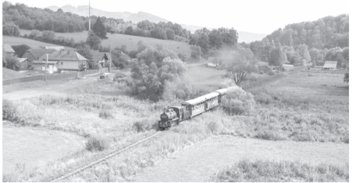
A kerékpárút a kisvasút nyomvonalán fog megépülni, de a Vármező és Szováta közötti turistavonalat továbbra is közlekedni fog

– Kezdeményezőként részt fogok venni a képviselőházi bizottsági üléseken, s remélem, hogy a kollégák tartják magukat az egyezséghez, és elfogadják a tervezetünket. Ha ez megtörténik, a megyei tanács hozzákezdhet a telekeléshez, tervezéshez. Akkor konkrétan beszélhetünk a bicikliútról, arról, hogy milyen nyomvonalat követ, milyen hosszú lesz. A vasútvonal 70 százalékán már eltűntek a sínek, sok helyen a töltések is. A szakértők feladata lesz megmondani, mi lesz a legoptimálisabb megoldás. De ameddig a törvényt ki nem hirdetik a Hivatalos Közlönyben, addig nem beszélhetünk a műszaki tervekről – mondta Császár Károly szenátor.