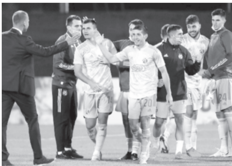
A kolozsvári sikerükkel továbbjutó zágrábiak nem neveztek meg a pozitív tesztet produkáló tagjukat