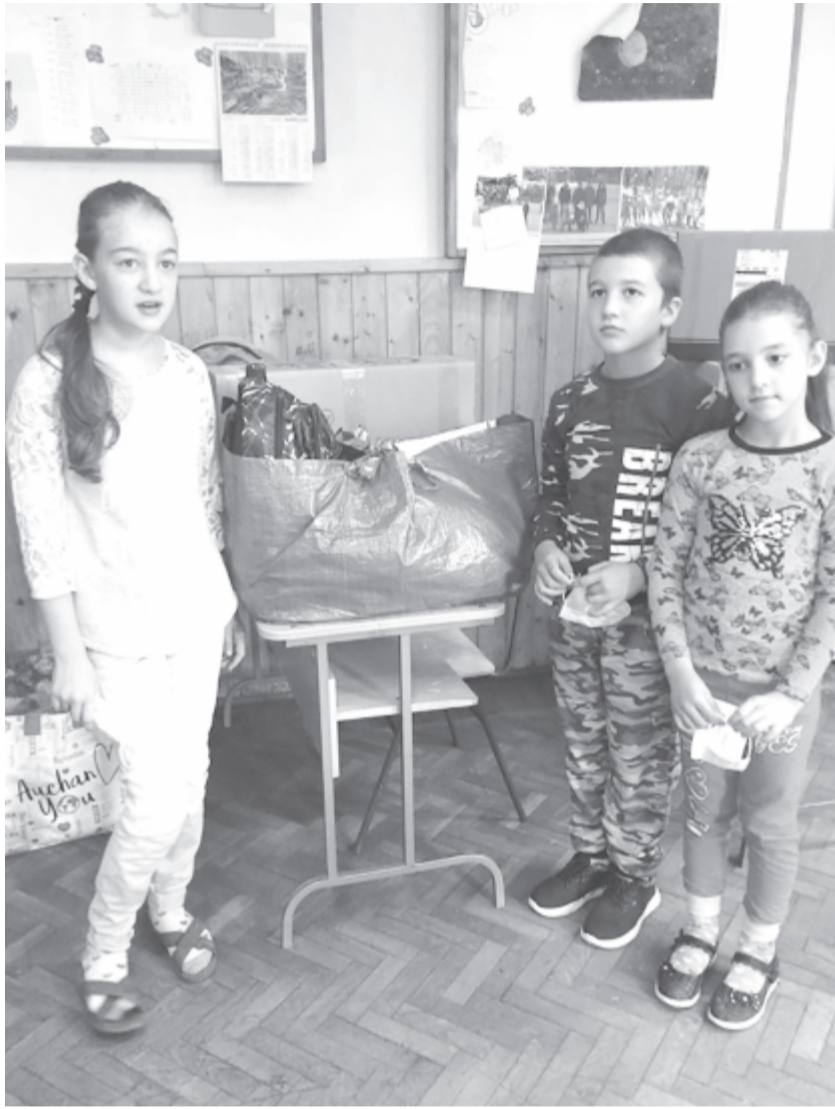
Minden tanévkezdés előtt segítenek a rászoruló gyerekeknek