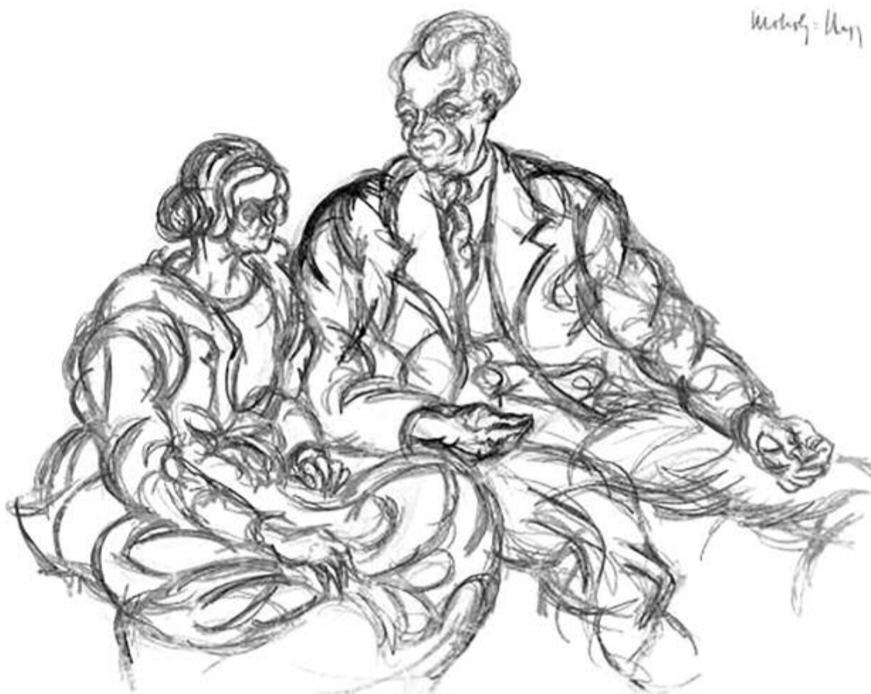
Mellékletünket a 125 évvel ezelőtt született Moholy-Nagy László alkotásaival illusztráltuk

Húsz éve, 2000. július 16-án, 56 éves korában hunyt el a Kossuth- és József Attila-díjas költő, műfordító, újságíró, a Digitális Irodalmi Akadémia alapító tagja. Született 1943. december 22-én, Budapesten.