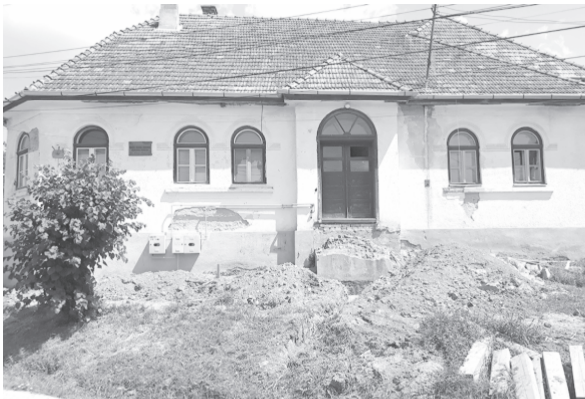
Az orvosi rendelőnél elköltöztetik a kis csorgót, megújul a környezete is, de a mögötte álló épület egyelőre még nem

A vizek minősége megfelelő, sosem volt senkinek panasza, a felső csorgónál kitűnőek az eredmények, az alsónál is csak egyetlen alkalommal tettek ki figyelmeztető feliratot, amikor a megyei közegészségügyi hivatalnál elvégzett évenkénti minőségvizsgálat során egy érték kissé meghaladta a meg-