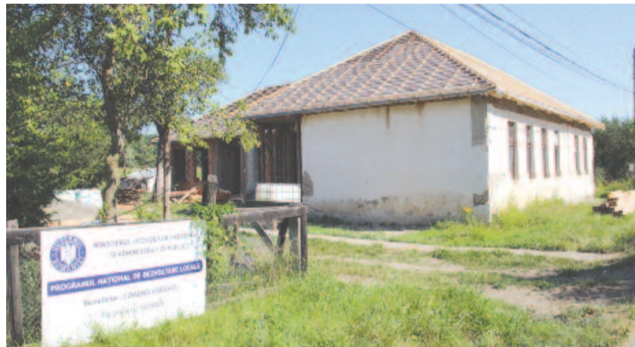
A búzaházi iskola