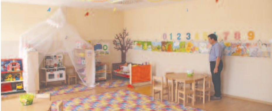
A csíkfalvi óvoda