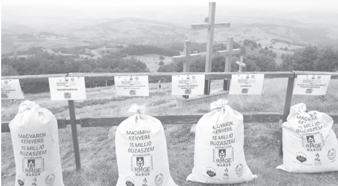
Elődeink tudták: hit nélkül nincs munka, termés, betevő falat