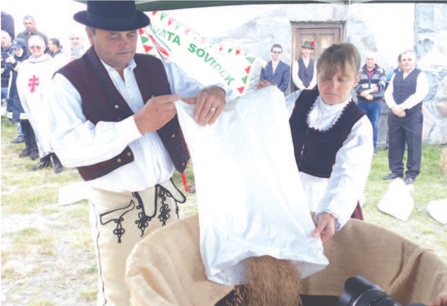
Gazdák, gazdakörök, malmok, intézmények fogtak össze és hoztak búzát a rászorulóknak