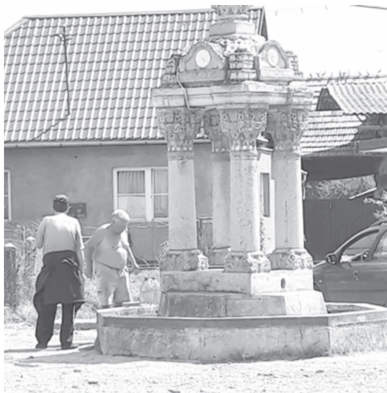
A faluközpontban álló csorgó környezetét rendezni fogják, a mögötte álló gázházat is elköltöztetnék

Mindkét csorgó vize ismert a vidéken, rengeteg ember használja, más településekről is jönnek ide edényekkel. Ugyanakkor számos turista is felkeresi, Marosvásárhelyről, Koronkából, Jeddről érkezve megállnak itt inni. Ha majd meg-