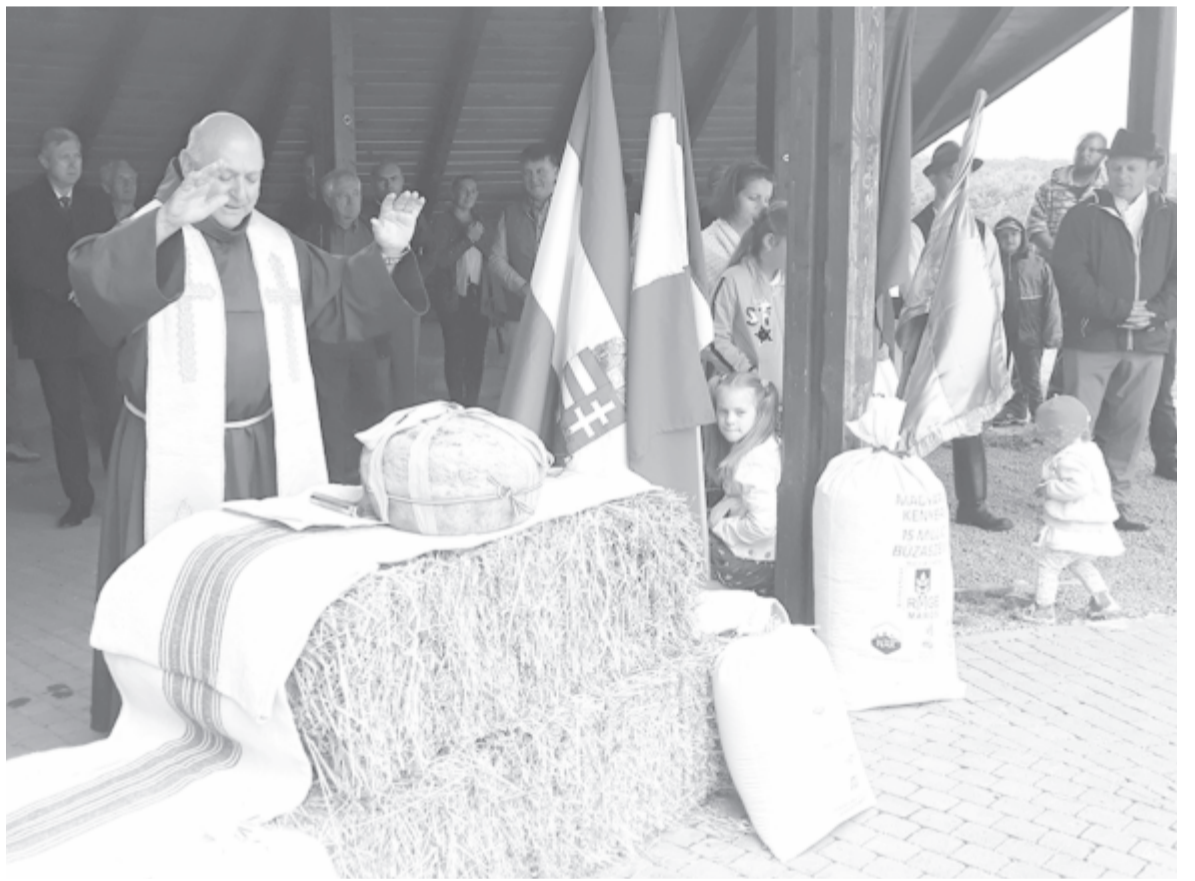
A búza és új kenyér megáldása a hálaadás, istendicsőítés ünnepe is