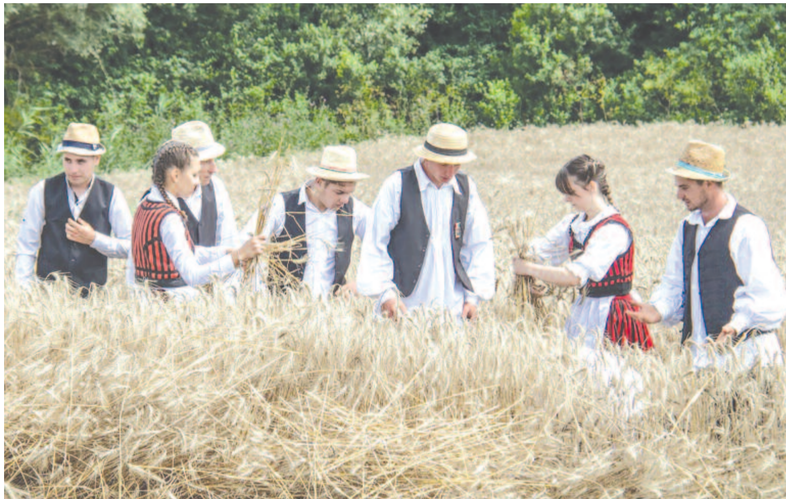
A fiatalok külön csapattal szálltak versenybe