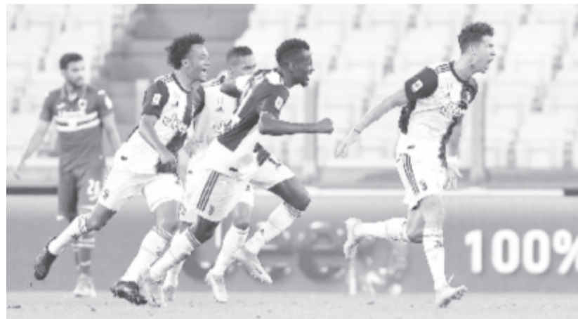
Cristiano Ronaldo, a Juventus játékosa (1) csapattársaival, miután megszerezte az első gólt a Sampdoria ellen. A portugál sztár 31 gólnál tart, elméletileg esélyes az olasz gólkirályi címre és az Aranycipőre is.

* Angol Premier Liga, 37. forduló: Bournemouth – Southampton 0-2, Aston Villa – Arsenal 1-0, Brighton & Hove Albion – Newcastle United 0-0, Liverpool – Chelsea 5-3, Manchester United – West Ham United 1-1, Norwich – Burnley 0-2, Sheffield United – Everton 0-1, Tottenham – Leicester 3-0, Watford – Manchester City 0-4, Wolverhampton – Crystal Palace 2-0; 38. forduló: Arsenal – Watford 3-2, Burnley – Brighton & Hove Albion 1-2, Chelsea – Wolverhampton 2-0, Crystal Palace – Tottenham 1-1, Everton – Bournemouth 1-3, Leicester – Manchester United 0-2, Manchester City – Norwich 5-0, Newcastle United – Liverpool 1-3, Southampton – Sheffield United 3-1, West Ham United – Aston Villa 1-1. A bajnokság végeredménye (élcsoport): 1. (már korábban bajnok) Liverpool 99 pont, 2. Manchester City 81, 3. Manchester United 66 (66-36), 4. Chelsea 66 (69-54). * Olasz Serie A, 36. forduló: AC Milan – Atalanta 1-1, AS Roma – Fiorentina 2-1, Genoa – Inter 0-3, Hellas Verona – Lazio 1-5, Bologna – Lecce 3-2, Brescia – Parma 1-2, Juventus – Sampdoria 2-0, Napoli – Sassuolo 2-0, SPAL – Torino 1-1, Cagliari – Udinese 0-1; 37. forduló: Parma – Atalanta 1-2, Inter – Napoli 2-0. Az élcsoport: 1. (már bajnok) Juventus 83 pont/36 mérkőzés, 2. Inter 79/37 (79-36), 3. Atalanta 78/37 (98-46).