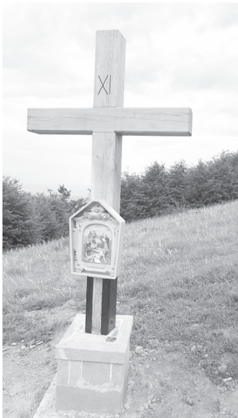
A helyükre kerültek a kerámia szentképek is, következhet a felszentelés – amennyiben lehetőség lesz rá

követni fogja” – reméli az előjáró. Erre az ünnepségre augusztusban szeretnének sort keríteni, de csak a járványügyi helyzet és az érsek programja függvényében tudnak időpontot leszögezni – hangsúlyozta a beruházó bekecsalji önkormányzat vezetője. (GRL)