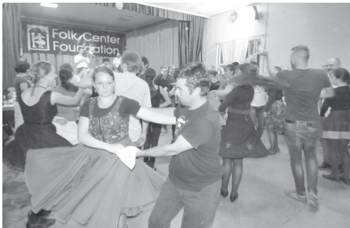
Remélhetőleg Jobbágytelkén a következő nyáron már lehet mulatni a táncházban