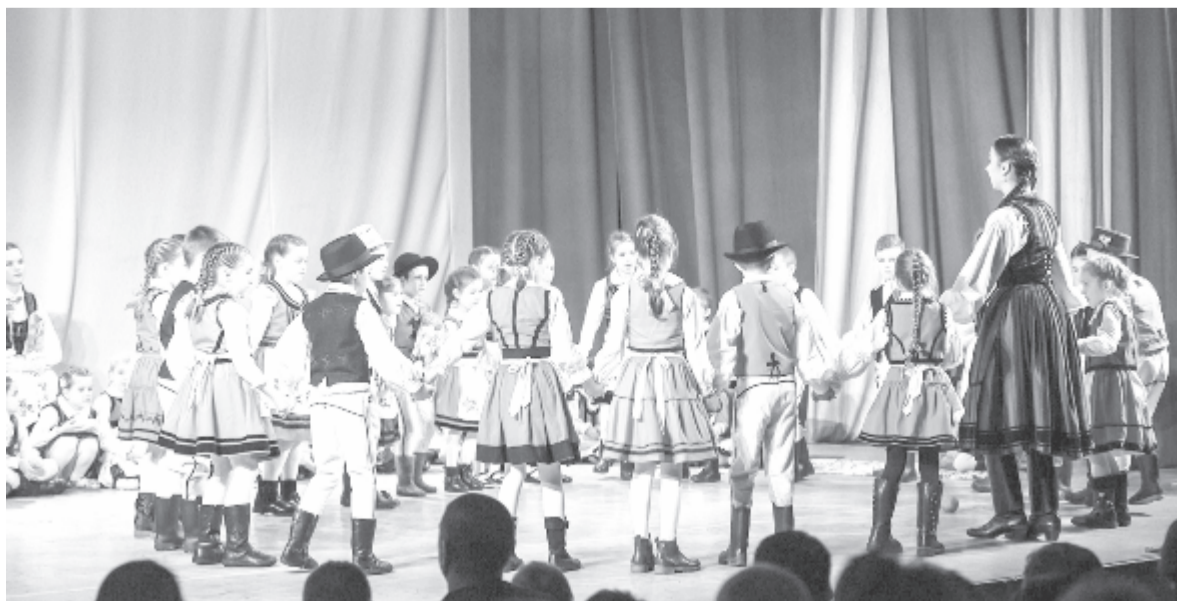
A vidéki csoportoknál működik a néptáncoktatás – igaz, jelenleg csak online

cosokkal, de nem kap hazai állami finanszírozást, a teljes költségvetését magának kell biztosítania. Eddig is félmegoldásokkal létezett az együttes, többnyire a magyar kormány adományából és pályázati