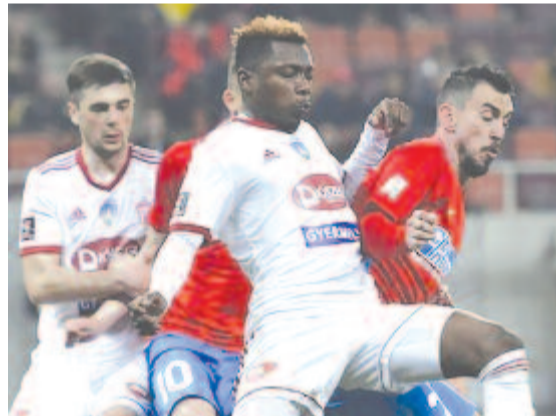
A képen ellenfélként mérkőző háromszéki gárdának, valamint a fővárosi FCSB-nek egyaránt lehetősége lenne elindulni az európai kupasorozatok következő idényében, amennyiben a bajnokságban vagy a Románia-kupában jogot szereznek erre.