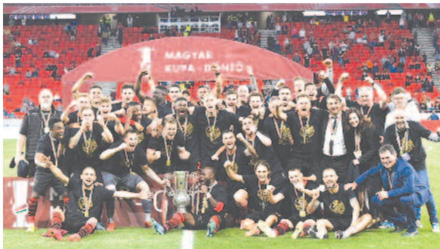
A Budapest Honvéd játékosai ünnepelnek, miután 2-1-re győztek a Mezőkövesd Zsóry FC ellen a labdarúgó Magyar Kupa döntőjében a Puskás Arénában 2020. június 3-án. A kispesti csapat nyolcadszor nyerte meg a kupát.

A Budapest Honvéd kupagyőztesként a következő idényben az Európa-liga selejtezőjében indulhat, az első döntőjében szerepelt Mezőkövesdnek is megvan erre a lehetősége a bajnokságból, mivel jelenleg harmadik az OTP Bank Ligában.