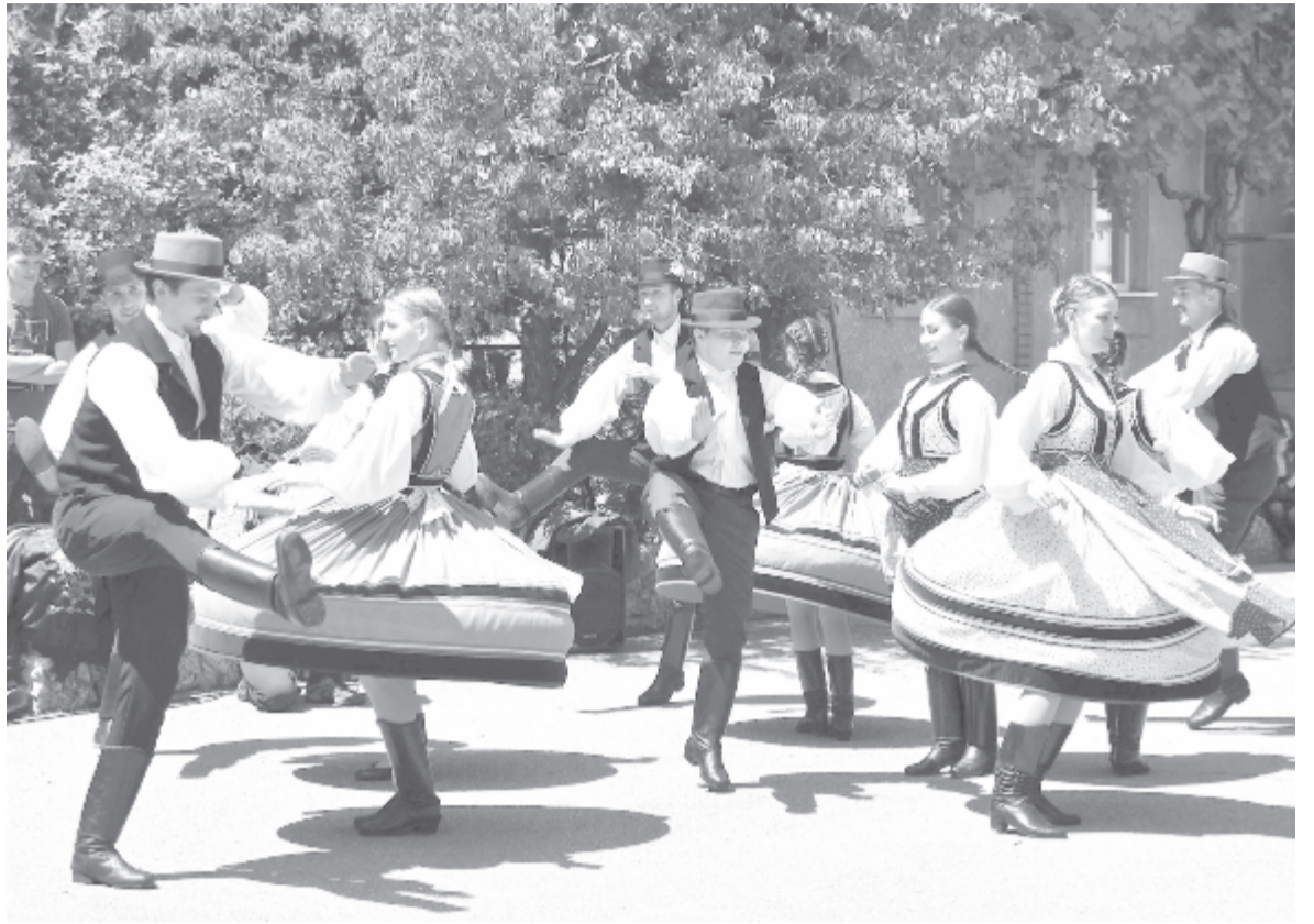
Nem tudni, mikor lép fel újra az együttes

A kultúra és a sport az, amiről a leghamarabb lemondanak a hatóságok kényszerhelyzetben, ez történt Romániában is, ahol minden pályázati kiírást töröltek, a támogatási forrásokat átterveztek, átcsoportosították a járvány kezelésére. Ez részben elfogadható is, ám ezzel számos intézmény működését bénították meg, hiszen azok az amúgy is szűkös anyagi támogatástól is esletek. Nem kivétel a Bekecs sem. A Maros Megyei Tanáccsal sikerült partnerséget kötni egy új néptáncműsor létrehozására és idei bemu-