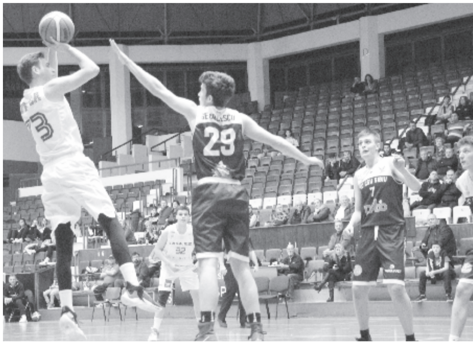
A kezdeményezés nem a CSM játékosai vagy szakvezetése ellen irányul, de a városi sportklubot háttérből irányító politikai vezetést megpróbálják kiiktatni

Minden gárda nyolc „alapszakasz-mérkőzést” játszik majd az Orlando-ban található Disney Worldben, és amennyiben a kilencedik helyezett legkevesebb négy vereségre közelíti az aktuálisan nyolcadik helyen álló riválisát, akkor még az ellen a csapat ellen egy külön párharcban kivívhatja a playoff-szereplést. Nyugaton jelenleg a nyolcadik Memphis Grizzlies négytel kevesebb vereséggel előzi meg a Portland Trail Blazers csapatát, míg Keleten a Washingtonnak öt vesztes találkozó a lemaradása az Orlando mögött. A bajnokságot július 31. és október 12. között bonyolítanák le, a tervekről csütörtökön szavaznak.