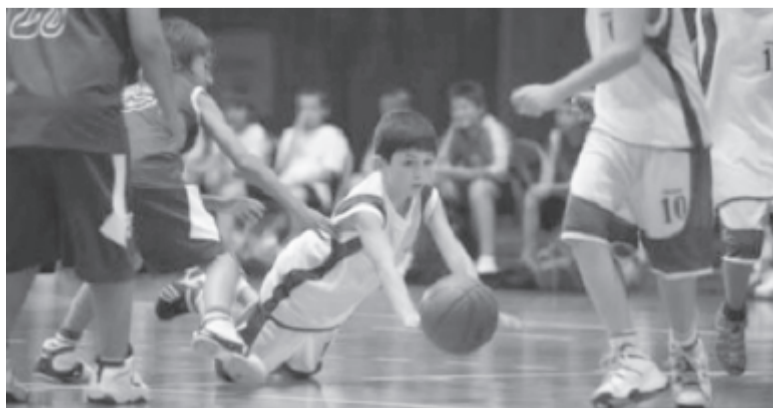
Az ifjúsági bajnokságok alapszakaszát a továbbiakban helyi szinten szerveznék meg a tömegesítés céljával