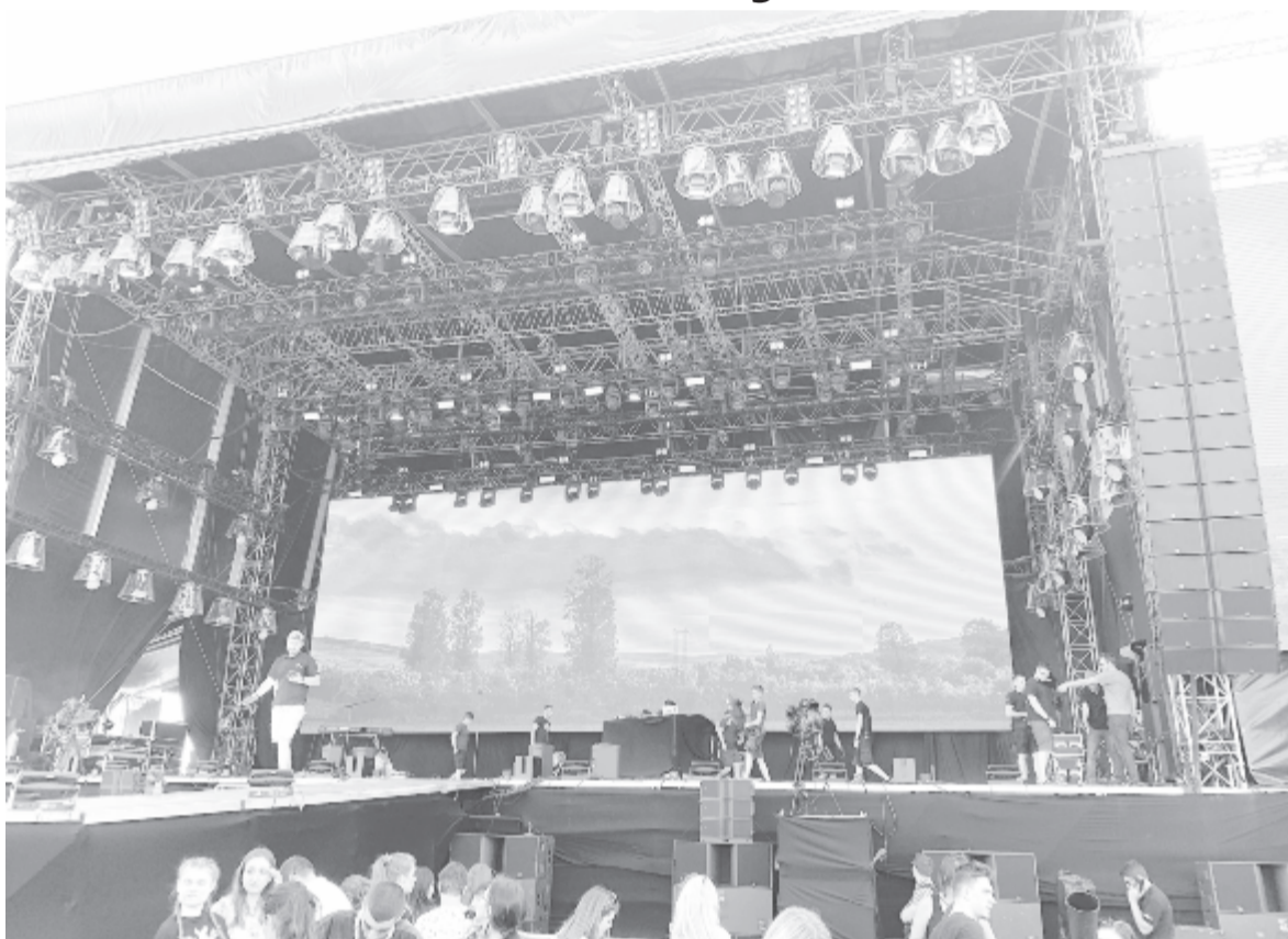
A nagyszínpad (archív)

A kormány szabályozza a rendezvényeket, a művelődési minisztérium honlapján olvasható az a