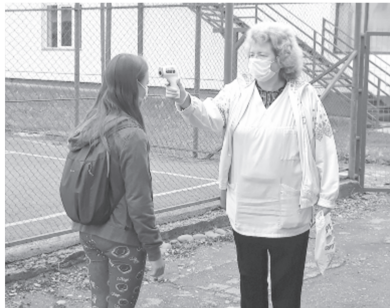
Szigorú óvintézkedések betartásával folyik a felkészítő

A erdőszentgyörgyi Szent György szakközépiskolában 29 helyi és öt böződi nyolcadikos állhat vizsgára, és a jelek szerint mindenki részt is fog venni a megmérettetésen, míg a 24 középiskolai végzősből 20 számított leérett-ségizni, akikhez a korábbi évekből végzett diákok is csatlakoznak – tá-