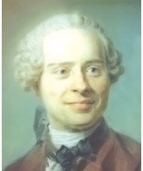
D'Alembert és zeneelméleti könyvének német nyelvű kiadása

D'Alembert éveken át küzdött a betegséggel. Neki elég volt a zene által nyújtott szabadság, gondolkodásában hitetlen maradt. 1783-ban meghalt, de sírjára senki sem vihette virágot, mert ateista lévén, jeltelen sírba temették. Ez a hagyomány azonban nem keseríthette túlságosan a nagy tudóst, mert megbizonyosodott arról, hogy fontosabb az emberiség hasznára kifejtett munka, mint egy síremlék. Az előbbi szabad gondolat, az utóbbi viszont kőbe véssett emlék csupán.