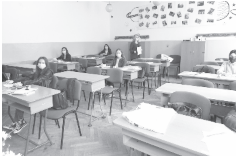
Érettségi felkészítő a tanítóképzőben

A sok összevisszaság mellett a rendeletekből az idén sem maradt ki, hogy a magyar tagozaton végzett diákok, ha kérik, az anyanyelvből tett vizsga eredményét nem számítják be a felvételi jegybe. Ha megteszik, számolni kell azzal, hogy csak román tannyelvű osztályban folytatathatják tanulmányait. Akik nem tanultak magyar nyelvet az általános iskolában, de magyarul szeretnének továbbtanulni, vizsgát kell tengeren magyar nyelvből, amelyen el kell érjék az ötös jegyet. (bodolai)