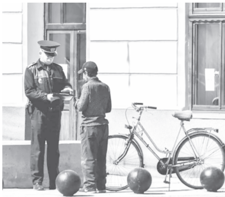
A városháza azt ígéri, a rendőrök figyelnek a járókelőkre, a köztereken gyülekezőkre

Az üzleteket ismételten felszólították, hogy tartsák be az előírásokat: helyezzenek a bejáráshoz fertőtlenítőszerrel, az elárúsítók viseljenek maszkot, és egyszerre kevés embert engedjenek be, míg a vásárlókat arra intik, hogy hordjanak maszkot és kerüljék a zsúfoltságot. Minden polgárt arra kérik, figyeljenek az idősekre, továbbá figyelmeztetnek, hogy a járválynak még nincs vége, és az óvatosság mellett higgadt, józan gondolkodásra, a pánik elkerülésére kérik mindenkit a helyi hatóságok.