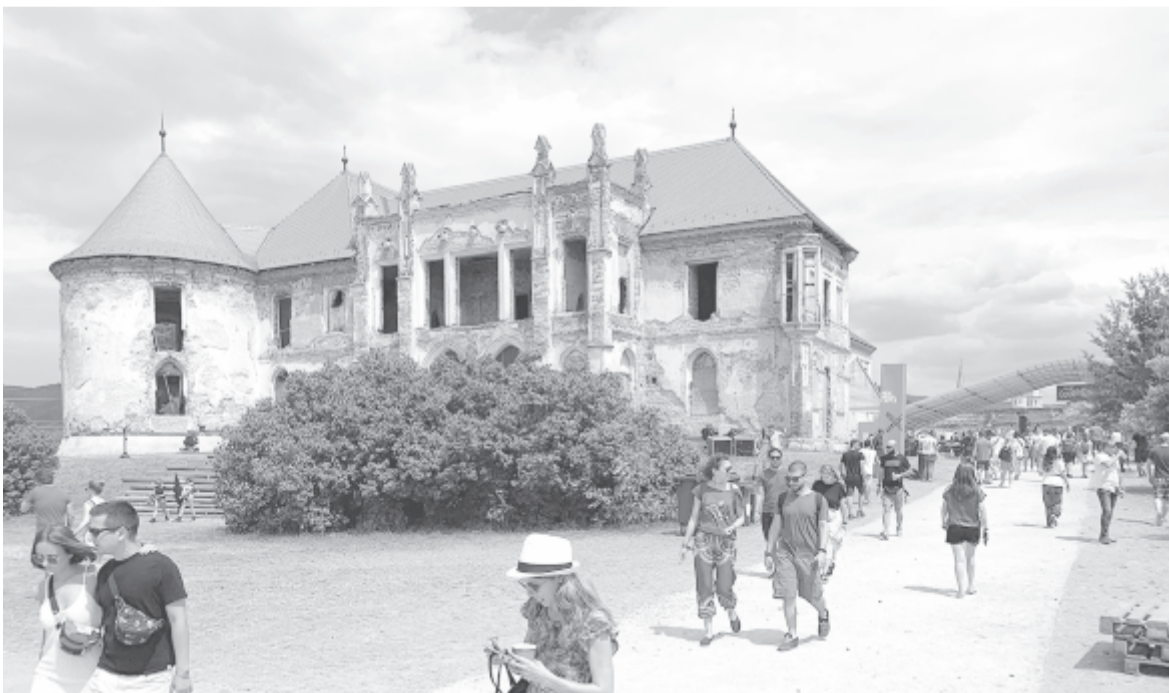
A Bánffy-kastély a fesztivál idején (archív)

Összességében elmondható, hogy nagyon sokszínű, családbarát, lenyűgöző hangulatú a fesztivál, ahova érdemes lesz elmenni jövőben.