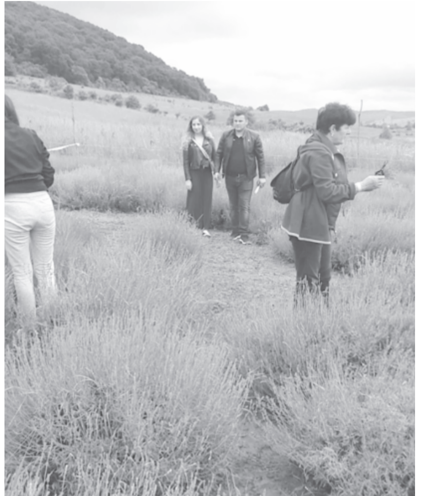
Mintegy kétezren látogattak ki a hét végén a levendulamezőre

Szombaton napsütés fogadta az érkezőket, de pénteken és vasárnap esett, így a felázott talaj kissé kellemetlenné tette a helyszínt, ennek ellenére sok „bátor ember” érkezett az időjárásnak megfelelően, gumicsizmával felszerelve, így aki ide elutazott, az jól érezte magát – vonta le a következtetést a szervező. A látogatók száma nyilván elmaradt a tavalyitól, a három nap alatt mintegy kétezren fordultak meg a helyszínen, ahol nemcsak levendulacsokrot vághattak maguknak, hanem a programokba is bekapcsolódhattak. A gyerekeket a korondi Székely Sasok gyermekdobcsoport előadásai és a műsorszámok között bemutatott János vitéz bábelőadás kötötte le pénteken, majd szombaton és vasárnap a Székelyföldi Legendárium meséit vetítették számukra. A vasárnapra tervezett régi-autó-kiállítás az eső miatt Marosvásárhelyen rekedt, de egy eredeti bogárhátú autót mindenképp meg