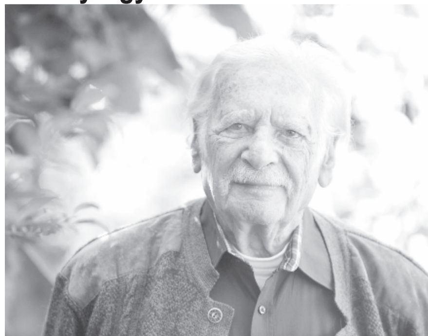
A felvétel 2017. október 16-án készült a magyar népművészet és közművelődés kategóriában Prima Primissima díjra jelölt Bálint Györgyről budapesti otthonában. MTI/Czímber Gyula

1994-ben belépett a Szabad Demokraták Szövetségébe, a párt országos tanácsának tagjává választották. 1994 és 1998 között országgyűlési képviselő