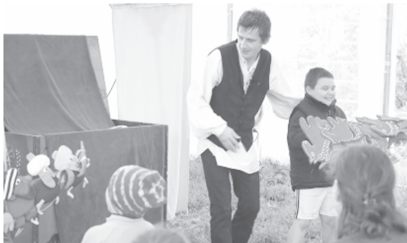
Gyerekek és felnőttek számára egyaránt akadt program és virágcsokor a farmon