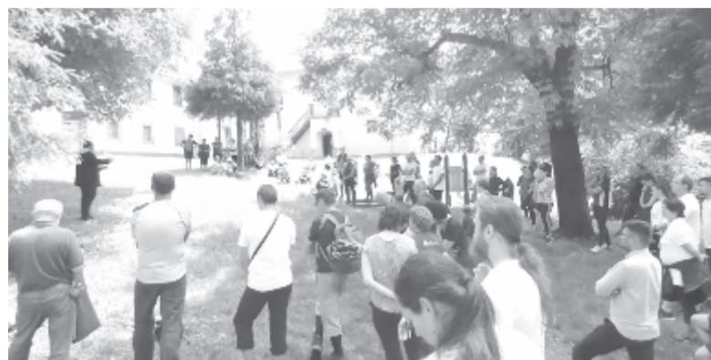
Idén szabadtéri áhítaton vettek részt a Mihházára érkező túrázók

tennek terve van velünk, azért kapunk tőle lehetőséget, és ezért van helyünk a mennyországban is.