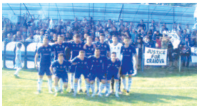
Feljutónak nyilvánították a régi craiovai klub örökösének tekinthető FC Universitatea 1948-at.

jutásért rendezett minitornák legjobb 2. helyezettei tölthetik be. Ha a harmadosztályban több mint 7 hely marad betöltetlen a fenti kritériumok alkalmazása után, akkor a fennmaradó üres helyeket további második helyezettek foglalhatják el. Ha egy csapat, amely megnyerte a feljutásért rendezett osztályozó tornát, mégsem iratkozik be a bajnokságba, vagy nem képes teljesíteni a részvételi feltételeket, esetleg a bajnokság kezdete előtt visszalép, akkor az így megürült helyet az adott minicsoport 2. helyezette foglalhatja majd el.