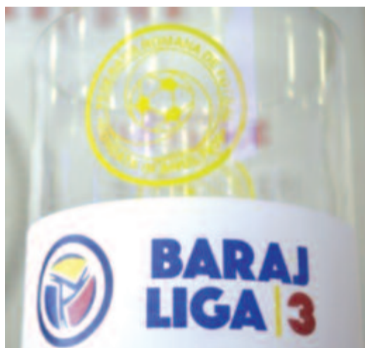
Az előző évektől eltérően ezúttal kevesebben jutnak fel a 4. ligából.

A labdarúgás szervezési szabályzatától eltérően amennyiben a 3. ligában betöltetlenül maradnak helyek (legfeljebb 7), ezeket a fel-