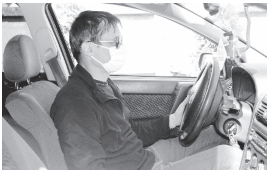
Van, aki autóban is maszkot visel

Lapzárta után értesültünk, hogy a megyei katasztrófavédelmi felügyelőség április 5-én megvitatta a száj- és orrmask (sál, kendő stb.) viselésére vonatkozó határozattervezetet, amely rendelkezett volna arról, hogy kötelezővé válik a maszk viselése valamennyi közösségi szinten, kereskedelmi egységekben, közintézményekben, a közönséget fogadó vállalkozásoknál, gyógyszertárakban, élelmiszer árusító piacokon és közszállítási eszközökön. Figyelembe véve, hogy jelenleg nincs lehetőség arra, hogy valamennyi Maros megyei lakosnak biztosítani lehessen a maszk beszerzését, a felügyelőség április 6-án a határozat visszavonásáról döntött.