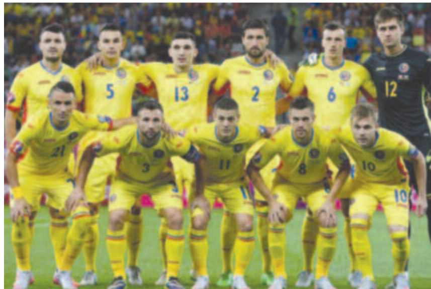
A román labdarúgó-válogatott Izlandon kezdte volna a kétféle pótselejtezőt az Eb-részvételért

A kontinensviadalt, amelynek részben Budapest és Bukarest is házigazdája lesz, a koronavírus-járvány miatt szintén elhalasztották jövő nyárra.