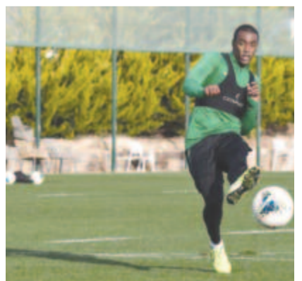
A gyakorlatok leginkább fizikai terhelést jelentenek, de próbálnak labdarúgó-specifikus feladatokat adni, vagyis a labda is jelen van az edzéseken