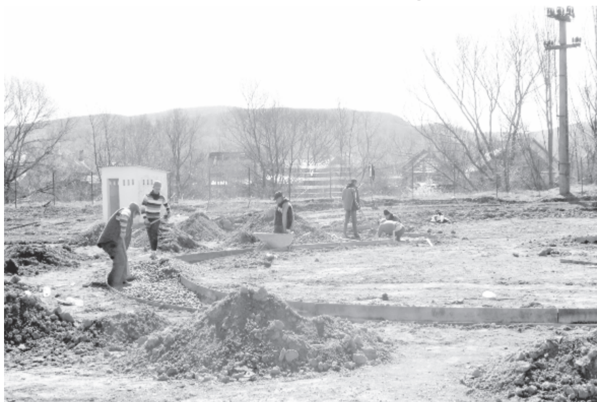
Egy hét alatt már jót haladt a kivitelező a munkálattal

az engedélyek beszerzésén és a tervek előkészítésén, most elkezdődhetett a „nagy park” kiépítése, és egy hét alatt jót haladt a kivitelező. A kivitelezésre szánt négy hónapos idő kimondva nagyon kevés egy ekkora nagyságú munka elvégzésére, de a kivitelező bizonyította rátermettségét, hiszen ugyanaz a cég építi a Dózsa György úti iskolát is – mondja. – Meglátásom szerint szüksége van Erdőszentgyörgy lakosainak egy olyan helyre, ahol sétálhatnak, családi programokat tarthatnak, megpihenhetnek. A helybeliek mellett fontos, hogy a kastély és a református templom miatt hozzánk érkező turisták is jól érezhessék magukat. Ez a park nekik is készül, holott elsődleges célja a helybeliek életminőségének, közérzetének javítása – nyilatkozta lapunknak a városvezető.