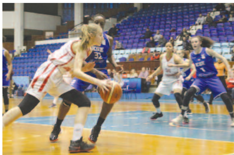
A város egyetlen élvonalbeli csapata, a Sirius-Mureşul női kosárlabda-együttese számára teljesen bizonytalan a jövő

Így hát Marosvásárhely sportélete a koronavírus elvonulása után is ropant szegényesnek ígérkezik, talán a legszegényesebbnek azóta, amióta a sport mint társadalmi jelenség a mindennapok részévé vált. Hogy mennyire, annak azok a sportkedvelők a megmondható, akik számára most jobban hiányoznak a heti események a sportsarnokban, mint amilyen zavaró bármilyen egyéb korlátozás, amelyekkel az utóbbi napokban kénytelenek voltak megtanulni együtt élni.