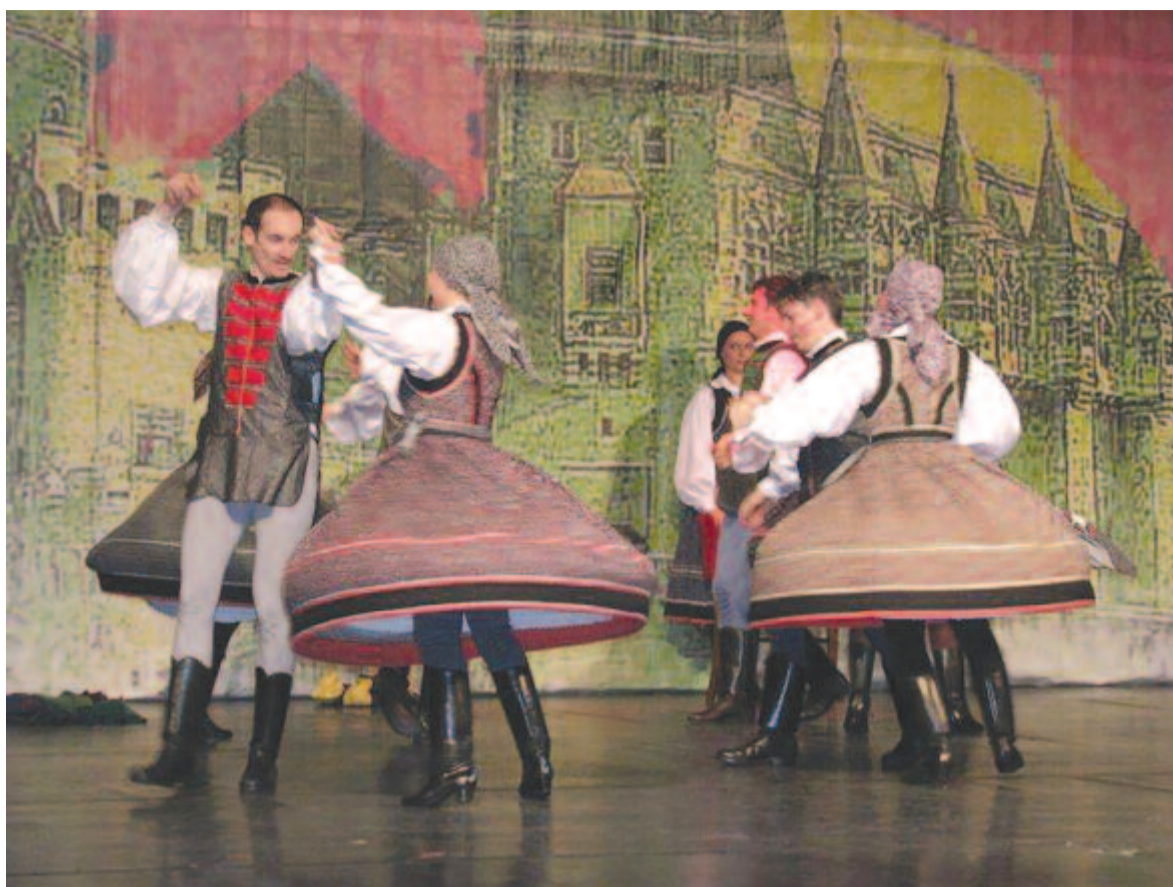
Matyas király álruhái

– A műszak március végétől, április elsejétől szabadságra ment. Őt személy maradt a szükséges teendők elvégzésére, többek között a könyvelő és a takarítónő. Természe-