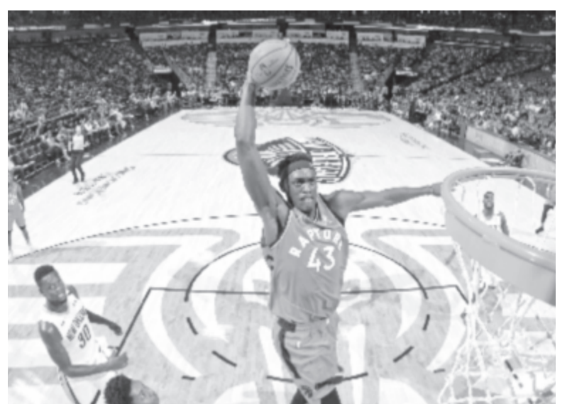
Az otthon ülő szurkolóknak azzal kedveskedik az észak-amerikai kosárlabdálga (NBA), hogy ingyenessé tette videós alkalmazását (game pass), amely révén az érdeklődők a korábbi mérkőzéseken kívül más tartalmakat is nézhetnek

A Nemzetközi Tájfutószövetség bejelentette, hogy elhalasztja a dániai világbajnokságot, amely július 7-én kezdődött volna. Az augusztusi, észtországi kontinensviadalt és az októberi, olaszországi világkupa-döntőt törölték a versenynaptárból.