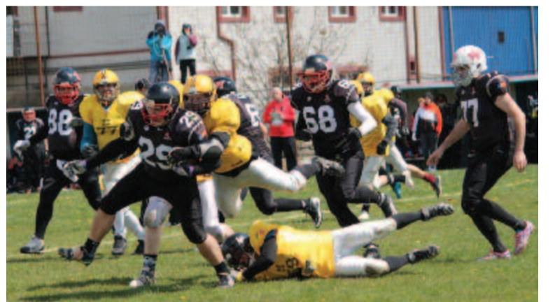
ket egyelőre ismeretlen időpontra napolták el. Mivel ezt a sportágat semmilyen határidő nem szorítja, az is elképzelhető, hogy csak ősszel pótolják az elmaradt tornákat. (bálint)

Szünetel az idény egy másik hivatalos sportági szövetséggel nem rendelkező szakágban, a floorballban is. Ebben a bajnokságban már három fordulót lejátszottak, márciusban és áprilisban lett volna két következő forduló Sepsiszentgyörgyön és Székelyudvarhelyen, majd a döntő torna Csíkszeredában. Eze-