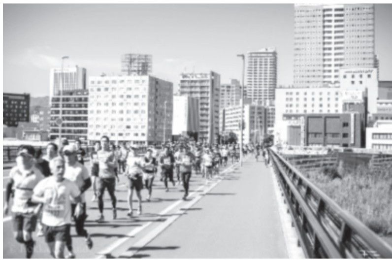
Szapporó az új időpontban is versenyhelyszín marad, a Tokióban várható hőség miatt ebben a jóval északabbra fekvő városban rendezik majd meg a maratoni futó és a gyaloglószámokat

pontból is meg kell vizsgálni a kialakult helyzetet, ezek közül az egyik az, hogy elképzelhető, bizonyos versenyhelyszínek jövőre már nem állnak rendelkezésre. Ezt a NOB elnöke, Thomas Bach is elismerte.