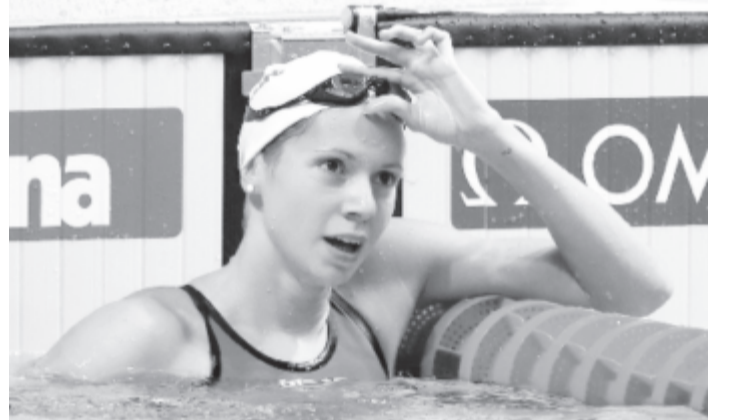
Többek között a világbajnok Kapás Boglárka is pozitív tesztet produkált

A MÚSZ hangsúlyozza: teljes mértékben együttműködik az egészségügyi szervezetekkel, és kizárólag azon úszóknak teszi lehetővé a medencés edzések elkezdését, akik esetében kizárható a fertőzés – azaz az egy vagy két negatív teszt mellett az is, hogy bármilyen formában érintkeztek fertőzött társaikkal akár a karantén kezdete előtt, akár annak letelte után. A zárt edzőtáborok során az úszók folyamatos orvosi felügyelet alatt dolgoznak majd, és rendszeresen részt vesznek egészségügyi vizsgálatokon – írták.