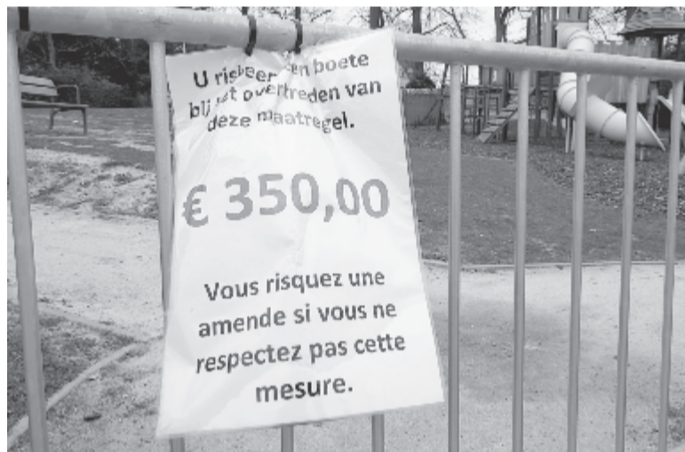
Jelentős bírság a szabályértőknél

A belga nemzetbiztonsági tanács március 12-i, a kijárási korlátozásra vonatkozó bejelentése hatására 13-án az emberek megrohanták a