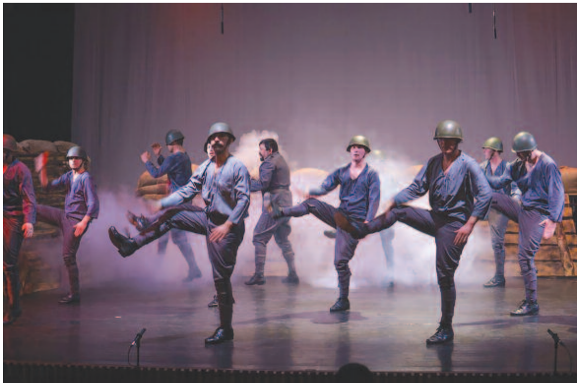
Imádság háború után