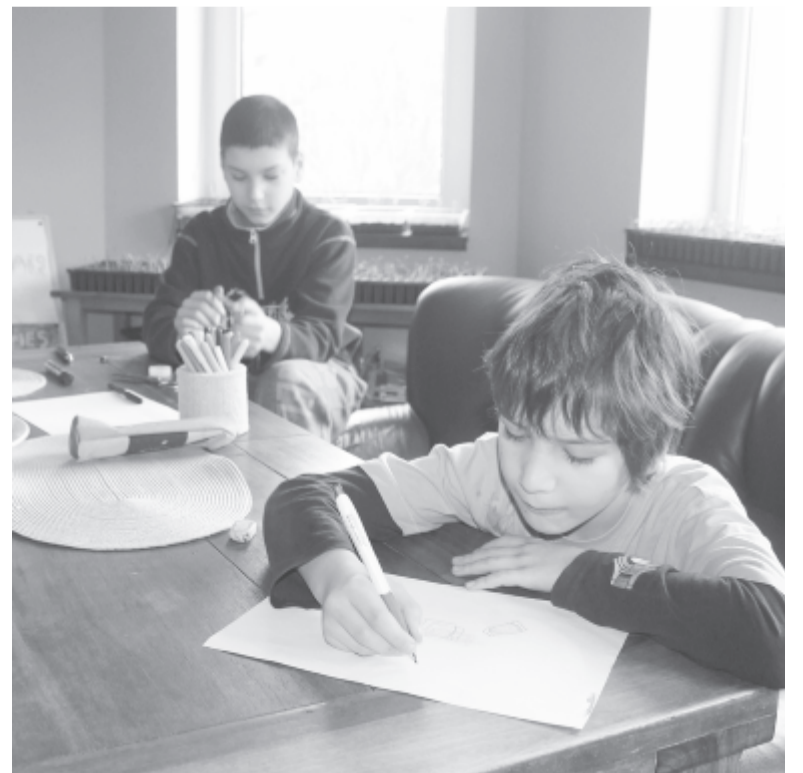
Otthon is tanulnak a gyerekek

– A távolságtartó köszönési formák, például a lábak összeérintése valószínűleg beépül a társas kapcsolataikba. Ahhoz, hogy a járvány után minél hamarabb megtalálják a helyüket az időközben megváltozott világban, jó lenne tudatosan figyelni arra, milyen tapasztalatokkal gazdagodtak, mi mindent tudtak meg magukról és szűkebb környezetükről az otthon ülés heteiben. Akár énképdíagramot is készíthetnek arról, hol tartottak a koronavírus-járvány előtt és után. Ugyanakkor már most ki-ki elgondolkozhat azon, hogyan tudna hozzájárulni ahhoz, hogy a COVID-19 után minél hamarabb normalizálódjon az élet.