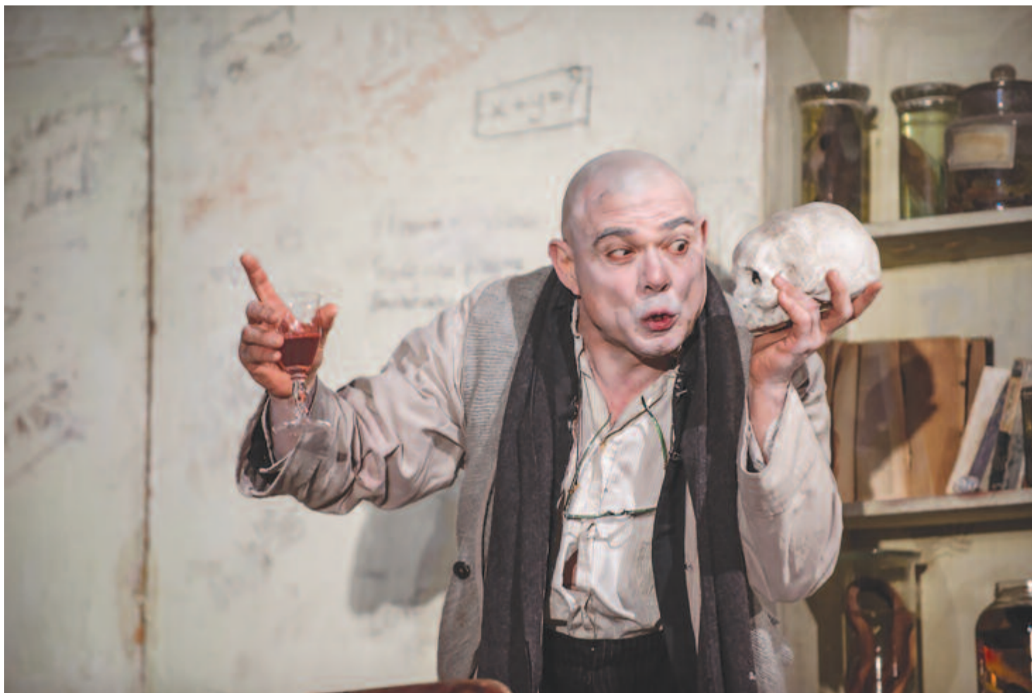
Faust, Radu Stanca Színház

Nincs stratégia arra, hogy mit kezd az ország évente 600 színész végzőssel, amikor ebből alig 15–20 színpadra való. Ha lenne egységes elképzelés, akkor az alapképzést követően – akár a mesterszakon – találnák meg a helyét azoknak, akik nem színpadképesek, hiszen, amint említettem, a színészetnek, a színművészeti eszközöknek hatalmas felhasználási területe van. A társadalomnak szüksége van ezekre az eszközökre, amelyek használata széles skálát ölel fel az üzleti szférától a politikumig. Egy másik fontos terület lehet a szakkollégiumi oktatás. Vannak már színművészeti osztályok liceumokban. Itt különösen oda kell figyelni arra, hogy a szakmaválasztás legérzékenyebb időszakában egy 14–18 éves fiatalnak milyen jövőt adunk a kezébe. Ez óriási felelősség. És akkor megint visszatérhetünk arra a kérdésre, hogy tulajdonképpen mi a színész, a színház: szakma-e vagy művészet? Miként viszonyuljunk hozzá egyszerű nézőként, színművészetis diákként, tanárokként, színházi szakemberekként? Sajnos ezeket a kérdéseket kevesen teszik fel azon fiatalok közül, akik ezt az utat választják. A válasz azonban sokkal szélesebb körű, mint ahogyan beszélgetésünkben kiténik.