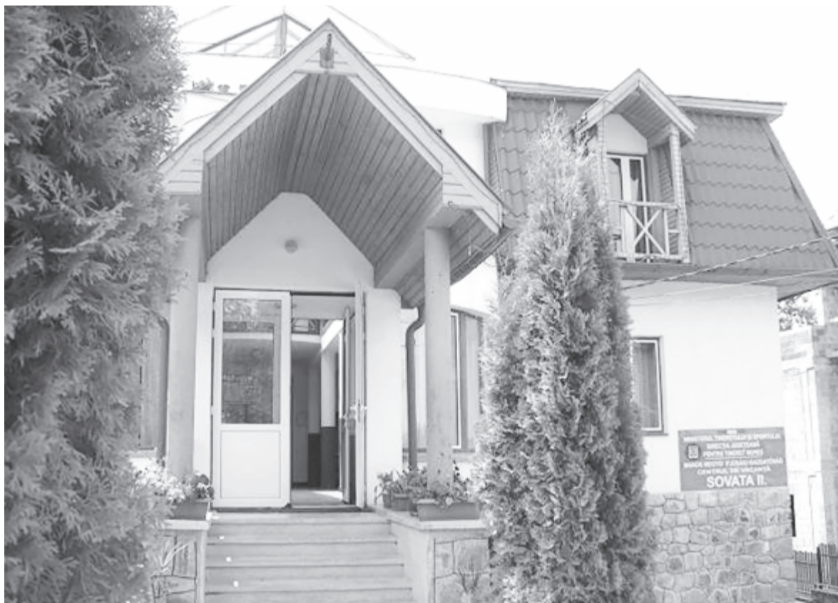
Egyelőre az állami tulajdonban levő két tábor rendezték be karanténközpontnak

A szovátaiak körében megoszlanak a vélemények a karanténközpontok kapcsán: a lakosság egy része elfogadja az intézkedést, főleg, hogy nem az önkormányzat hozta létre, és nagyon szigorú hatóság felügyelet alatt állnak ezek az épületek és a benne elhelyezett személyek, mások viszont felháborodásuknak adtak hangot a közösségi oldalakon. A polgármestertől megtudtuk: a helyi médian keresztül megpróbálta felvilágosítani a lakosságot a helyzetről, és kiemelni, hogy a vesztegzárat nem a város választotta, de ha már Szovátát is kijelölték, kötelességük segíteni. Azt is megtudtuk: a karanténba helyezett személyek telefonon, interneten kapcsolatba tudnak lépni a külvilággal és családjukkal, az épületekben a körülmények megfelelőek, az előjáró is beszélt telefonon néhány beutalttal, és minden rendben van.