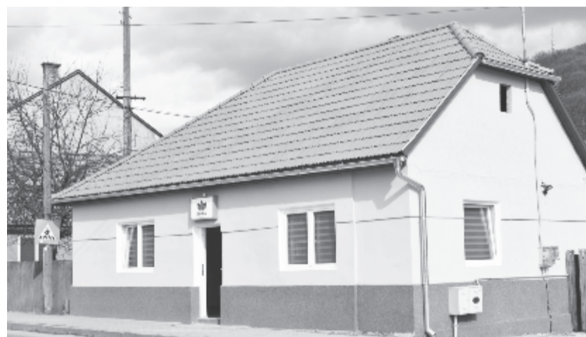
Az iroda közel van a városközpontoz