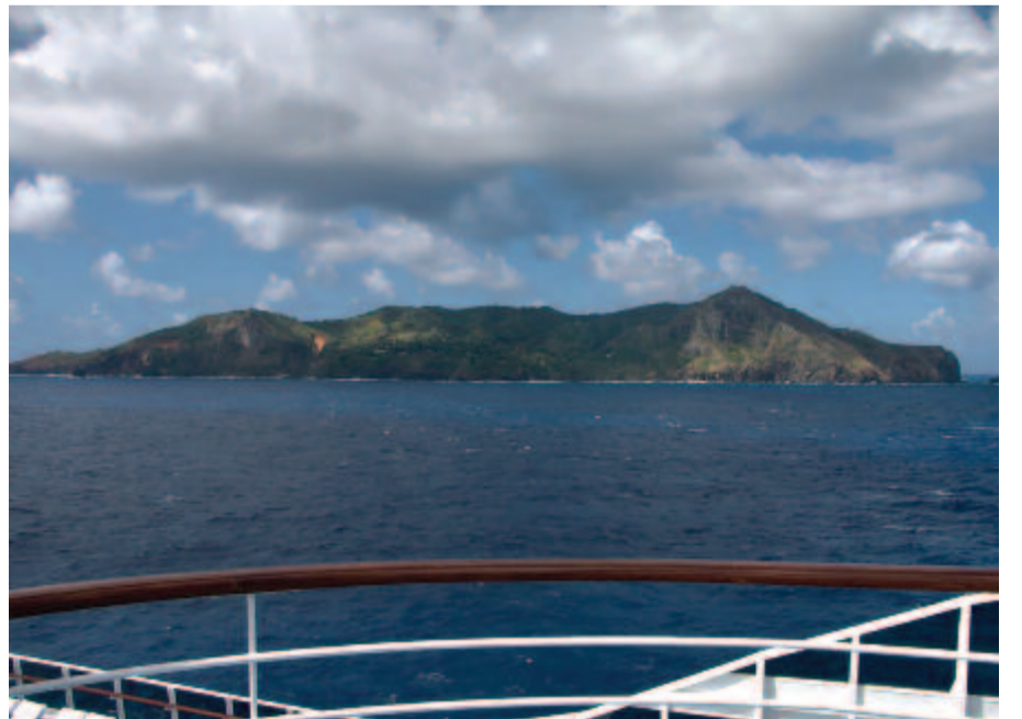
A Pitcairn-sziget a hajónról

pedig közösen használták azt, ami megmaradt. Kezdetben a nézeteltérés, veszekedés napi-rendben volt, de aztán ahogy telt az idő, és kezdtek születni a gyerekek, az érzelmek lecsillapodtak. 1808. február 6-ig a sziget ismeretlen maradt. Ekkor egy amerikai bálnavadász hajó véletlenül felfedezte, de ez feledésbe merült. Végül 1814. szeptember 14-én ismét rájuk bukkantak, és a 25 évi elszigeteltség véget ért. Ekkor az eredeti lázadók közül már csak John Adams élt, a többi vagy meghalt, vagy megölték a bennszülöttekkel való összetűzésekben. A lakosság