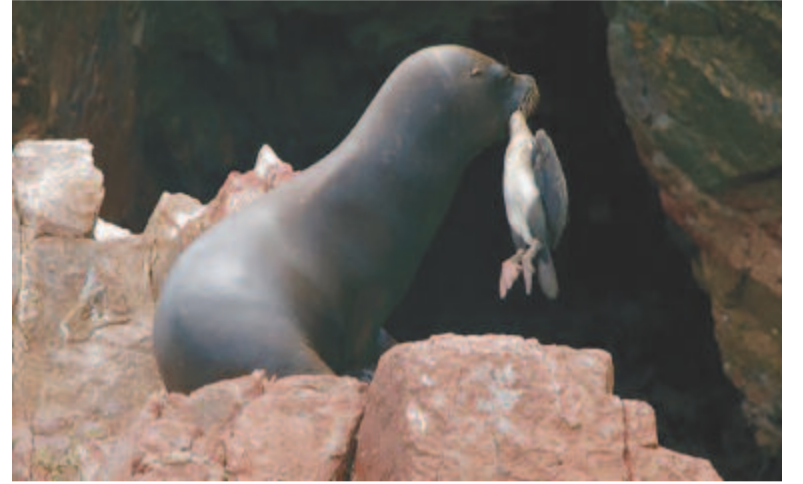
A vérengző foka

árut is hoztak. Volt ott képeslap, bélyeg, fafaragás, primitív ékszerek no meg az elmaradhatatlan pólók. Nem tudom, hogy csak a pólókat gyártották-e Guatemalában, vagy a Pitcairn-szigeti felírás is ott készült. Annak ellenére, hogy drága volt, a keletje talán annak volt a legnagyobb. No meg a helyi méznek, ami állítólag a legtisztább a világon. Ha ez így van, ez érthető, hiszen semmi szennyeződés nincs a szigeten. Igaz, Új-Zélandon se láttam semmilyen szennyeződést, ahol a manukaméz készül, és azt is a legtisztább