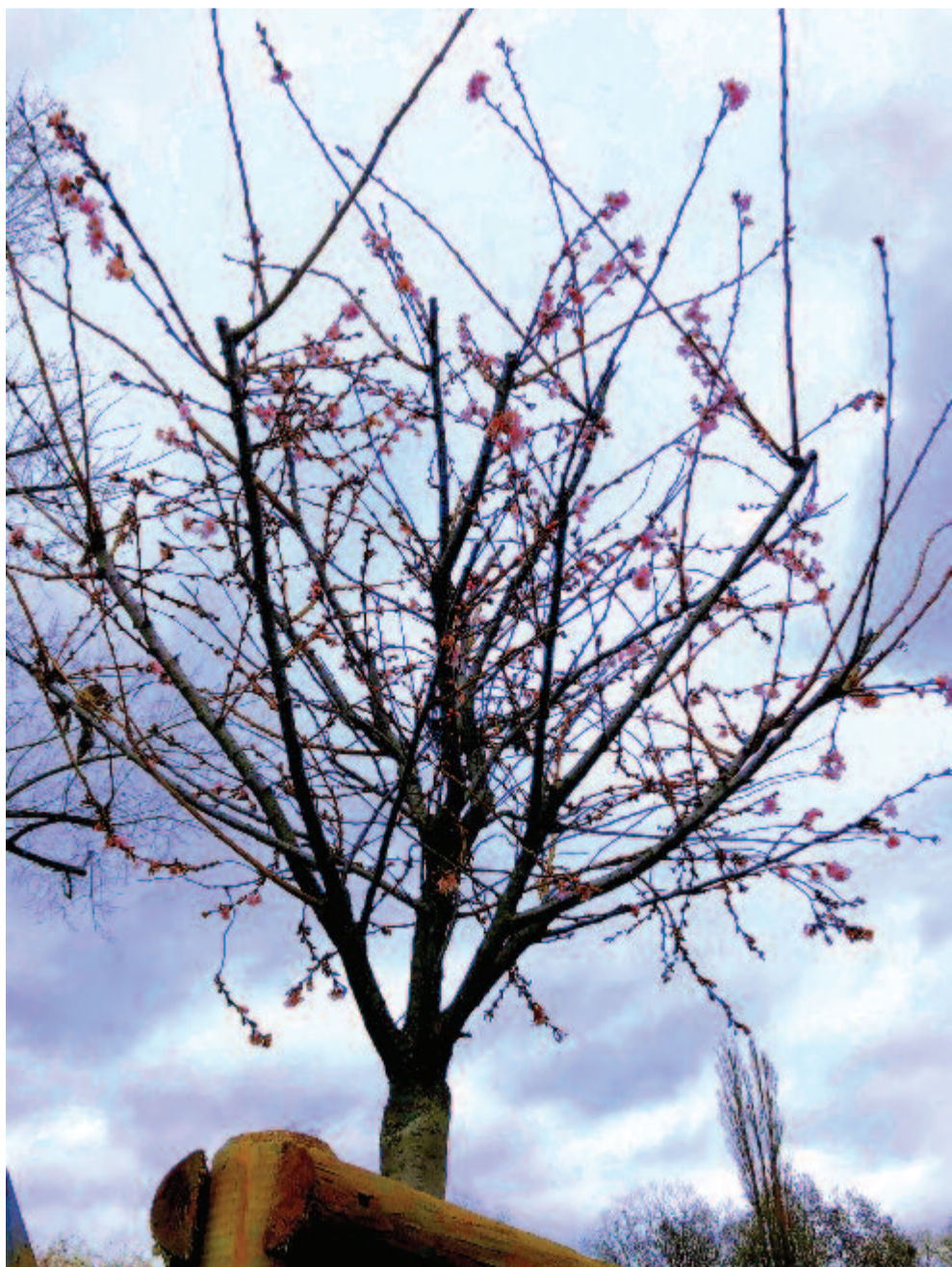
Februári hajnal – a kies tavasz maholnap eljő

Kelt 2020-ban, böjtelő havának hetedik napján