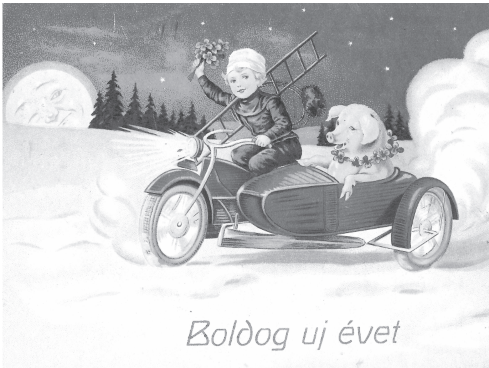
Újévi képeslap 1938-ból

Véget ért a Szilveszter-éji szender. Felkelne az ember. De nem mer. Mert jön a kenetes Basszusú szemetes. És jön a gyászos Szopránú gázos. Jön a májfoltos Sarki boltos. Sőt, jön a bordó Orrú levélhordó. Jönni nem restel Hajlongó testtel Uram s parancsolóm: A házmester. Vele jön nyájas kibice, A vice. Jő és belém kíván sokat A nő, aki rám mosogat. Jön vidáman a szabószámla, S arcáról a bőr le nem hámla. Jön bús, fekete sál alatt A temetési vállalat. S jön az olcsóságmentes Hentes. És buékot nyihogat, ó, Minden páholynyitogató. Fiákeres és ószeres Reámborulnak: ó, szeress! És jön emez, és jön amaz, És jön háromszor ugyanaz. S jönnek tízezeren. S ájultan fekszem. S tolongnak vadul Az ágyam körül, S direkt mind az én Újévemnek örül. Nyüzösögnék zsúfolt rendben A széken, asztalon, kredencen És a sézlongon. És keresztül a sok tolongón Hozzám jutni alig tudá A guta.