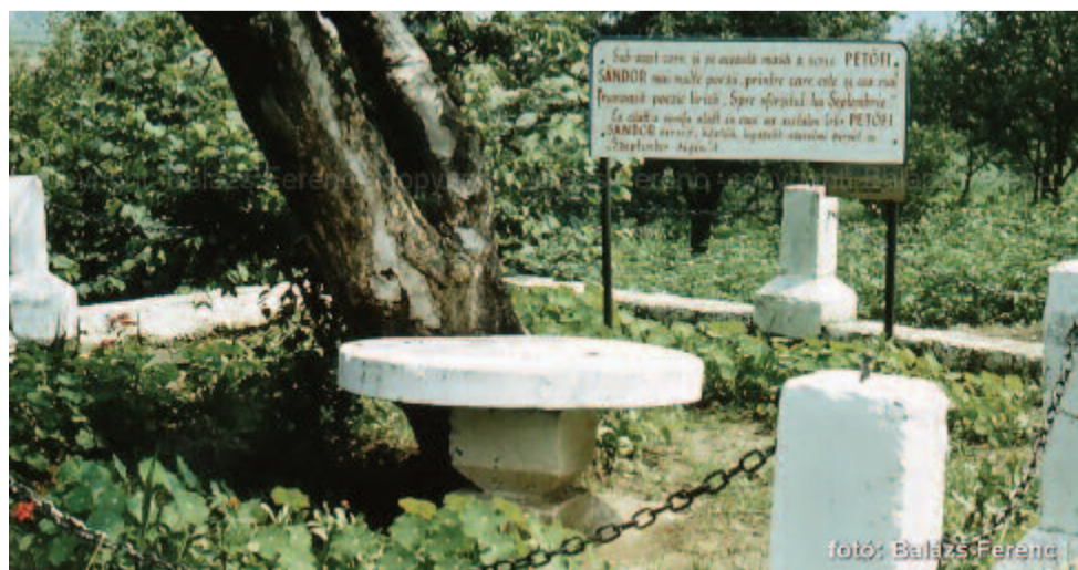
Petőfi kőszegi kastély kertjében 1980-ban