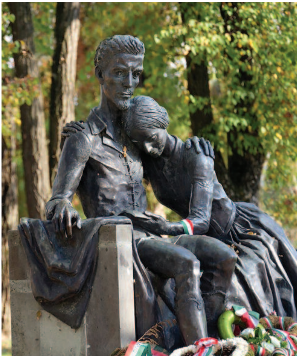
Petőfi Sándor és Szendrey Júlia szobra a koltói Teleki-kastély parkjában

Az isten ítélőszékénél, Még ott sem mondok egyebet: „Hogyszem ezeknek megbocsássak, Inkább elkárhoztott legyek!”