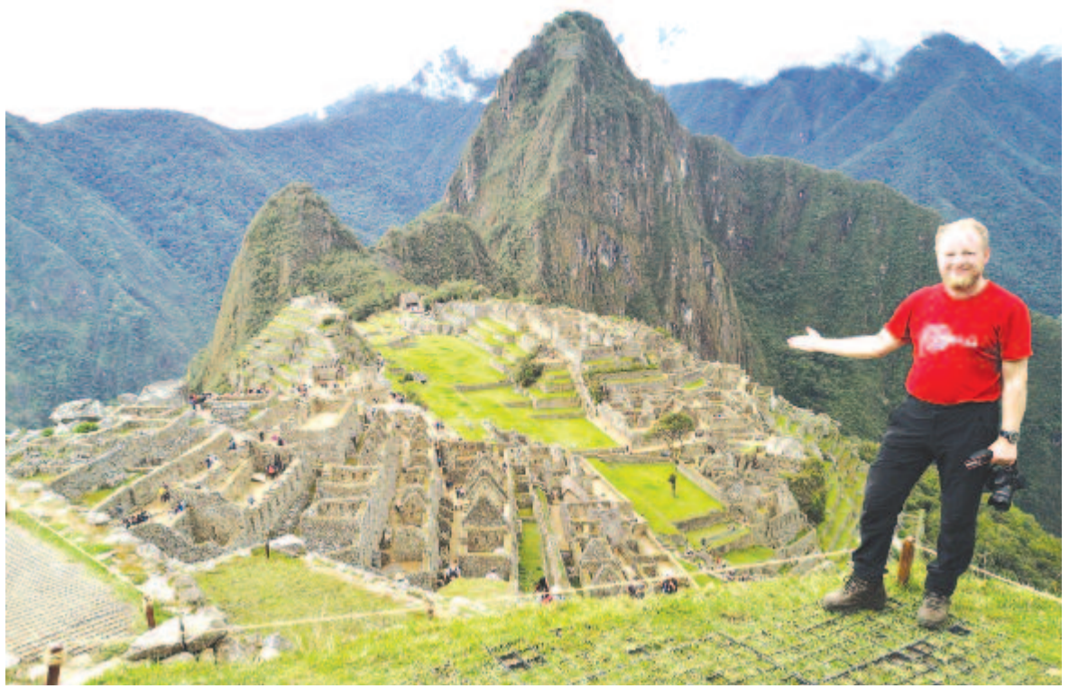
Machu Picchu, a titokzatos inka város

Csillagászati könyv volt, zarándokutakat jelzett, vagy talán az istenekkel akartak kommunikálni azok az őslakosok vagy földönkívüliek, akik az úgynevezett Nazca-vonalakat rajzolták a föld felszínére több mint 2000 évvel ezelőtt? 520 kilométeren át rendkívül