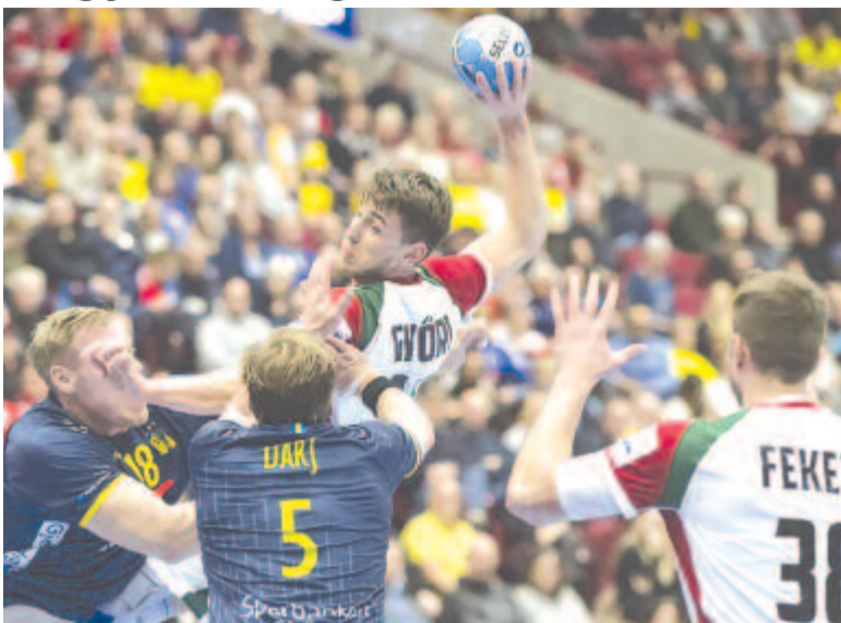
A 48. percben szereztek utolsó góljukat a magyarok, utána nem tudták bevenni az Eb házigazdájának kapuját.