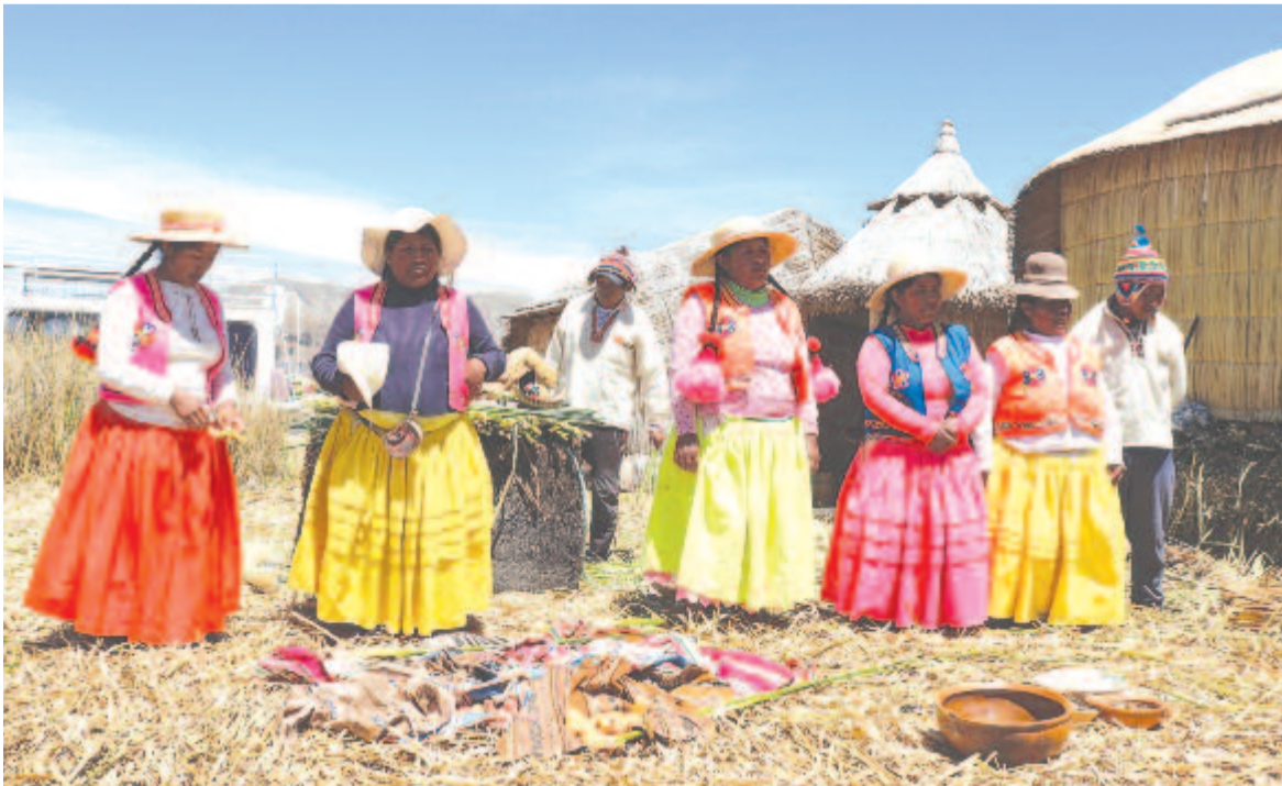
Indiánok az Uros-szigeteken