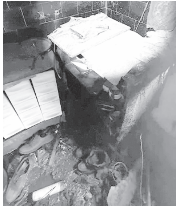
A helyiség teljesen kiégett, de a tűz nem terjedt ki az épület egészére

A szerencsétlenség egy összeeskabált elektromos szerkezet meghibásodása miatt következhetett be – tudtuk meg Német Zsoltól, a helyi önkéntes tűzoltóegység vezetőjétől. A tűz vélhetően valamikor éjszaka keletkezhetett, kiégett az illető helyiség, de oxigén hiányában a lángok nem tudtak átterjedni más helyiségre vagy az épület egészére, viszont teljesen el sem aludtak, mert amikor az ajtót betörték, akkor ismét fellángolt a tűz, de pillanatok alatt el tudták oltani. Az áldozatot az ágy mellett találták a padlón, megégett tetemét a marosvásárhelyi kórbontani intézetbe szállították, hogy megállapítsák a halál okát (füstmérgezés vagy égési sérülések). A 81 éves M. A. egyedül élt, de a sajtóban megjelent hírekkel ellentétben nem volt ágyhoz kötött, kissé nehézkes volt a mozgása, de még az azelőtti napon is az üzletben járt vásárolni – mondta el a parancsnok.