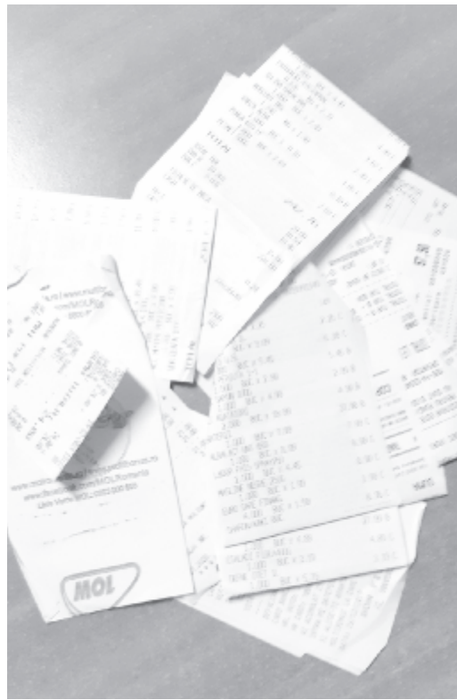
Fotó: Antal Imola