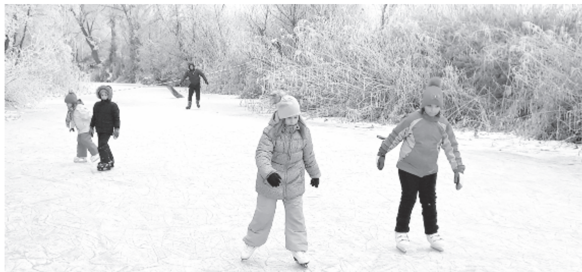
Már pénteken délután ellepték a jeget a korcsolyázni vágyók