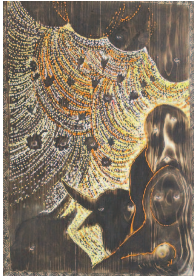
„...Harmatozások, égi magassok...!”

– Igen, mert úgy érzem, hogy van még erőm, tapasztalatom, kedvem ehhez. Sikerült kialakítani egy jó csapatot, amely rendszeresen segít a kiállítások szervezésében, a „kultimunkában”, és remélem, hogy továbbra is mellettem lesz. Azt sem titkolom, hogy ez idő alatt szeretnék valaki olyant magam mellé venni, aki hasonlóan elkötelezett a művészetek iránt, vállalja a szervezési és egyéb önkéntes munkát, hogy majd megfelelően vigye tovább mindazt, ami életben tartja és működteti a Maros Megyei Képzőművészek Szövetségét, sőt új ötletekkel, lendülettel gazdagítja a képzőművészeti kínálatot.