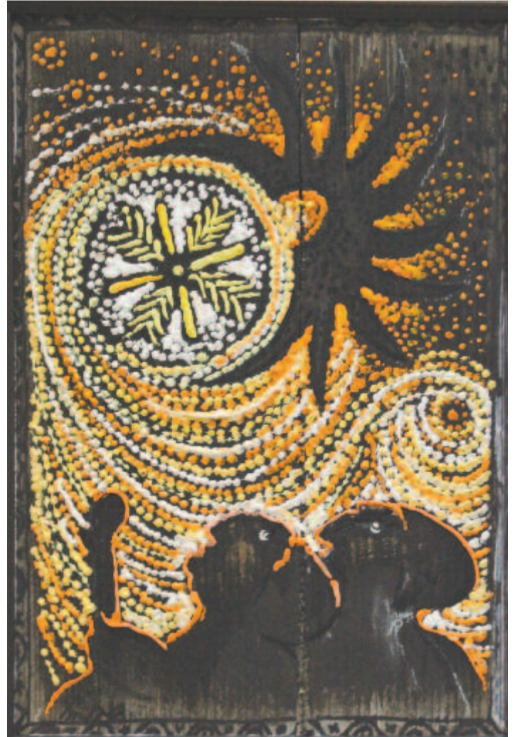
„...jámbor pásztoroknak, utat mutassatok...!”

get. Büszkén mondhatom, hogy a Maros Megyei Tanács támogatásának köszönhetően mandátumom alatt renoválták a galériát, amely az ország egyik legnagyobb, a célnak megfelelően rendbe tett kiállítótere lett. Kolozsváron, ahol nagyobb hagyománya van a képzőművészeti megnyilvánulásoknak, nincs megfelelő kiállítóterem. Azt szeretnénk – más városokbeli galériákhoz hasonlóan –, hogy állandó alkalmazottként foglalkoztassunk egy teremfelügyelőt. Egyelőre ezt nem tudtuk elérni, de reméljük, megoldódik. Kevesebben tudják, hogy a helyiségekben nem csak a közönség számára rendezünk kiállításokat. Itt mindig történik valami. A nyilvános kulturális rendezvények mellett tagjainkkal rendszeres találkozókat tartunk, ahol közös művészfilmműzés és az ezt követő vita mellett beszámolunk egymásnak a külföldi kiállításokról, tapasztalatainkról, alkotásainkról. Tavaly két kollégával két hétig a velencei biennálén voltunk, ahol minden munkát lefotóztam, katalógust hoztam és megmutattam az érdeklődő tagoknak. Van vetítőgépünk, két nagy képernyőjű televízió, amelyeket monitorként használunk, így bárkinek lehetősége van bemutatni tapasztalatait vagy azt az alkotását, amin dolgozik. Kicsérélhetjük gondolatainkat, ihletet adhatunk egymásnak az alkotáshoz. Az Art Nouveau galéria emeletén van egy vendégszoba egy kis konyhával és mosdóval, ahol egy-két napra olyan vendégművészeket fogadhatunk, akik nálunk állíta-