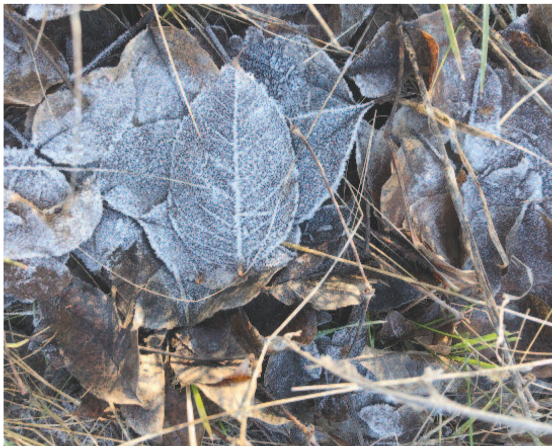
Most fényességbe tér utunk, zúzmarás tisztához jutunk

Erre emlékeztetve, maradok kiváló tisztelettel.