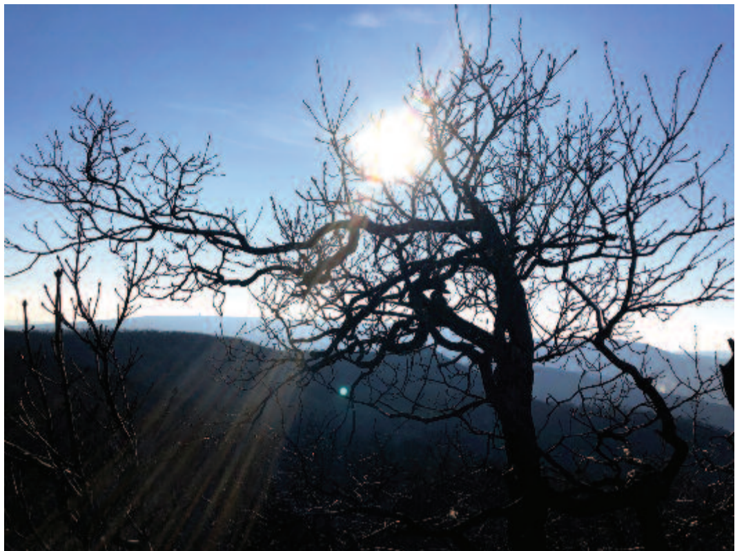
Ott áll a csodás – s körül ragyogás, ragyogás...

Éppen 130 éve, 1890. január 20-án a Magyar Tudományos Akadémián Eötvös Loránd bemutatta, hogy torziós ingájával megmérhetők a nehézségi erő változásai. Méréseinek jelentősége addig elérhetetlennek vélt pontosságában volt: az inga azt is kimutatta, ha egy hajó elhaladt az Akadémia épülete előtt a Dunán. A tudományos eredmények sorában ritkaság, ha egy mérés több mint egy évszázad távlatából nézve is jelentős eseménynek bizonyul. A Magyar Turista Egyesület elnöke munkahelyére, az egyetemre lóháton járt be. Ő szervezte az első tantárgyversenyeket Magyarországon. A Magyar Kárpát Egyesület is elnökévé választotta. Utazásait, expedícióit fényképeken örökítette meg. Népszerűsítette is a természetjárást, de nyári hegymászásai közben is figyelemmel kísérte a kutatómunkát. Méltán viseli nevét a mai Magyarország legnagyobb egyeteme.