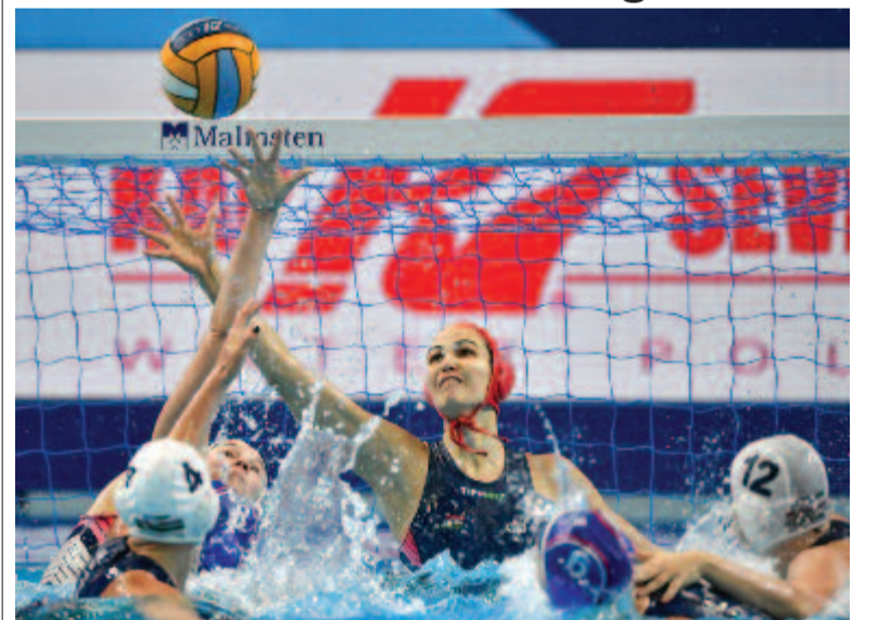
Kasó Orsolya, a magyar válogatott kapusa (k) a budapesti vízilabda-Európa-bajnokság női tornájának csoportkörében játszott Magyarország-Oroszország mérkőzésén a Duna Arénában 2020. január 15-én.