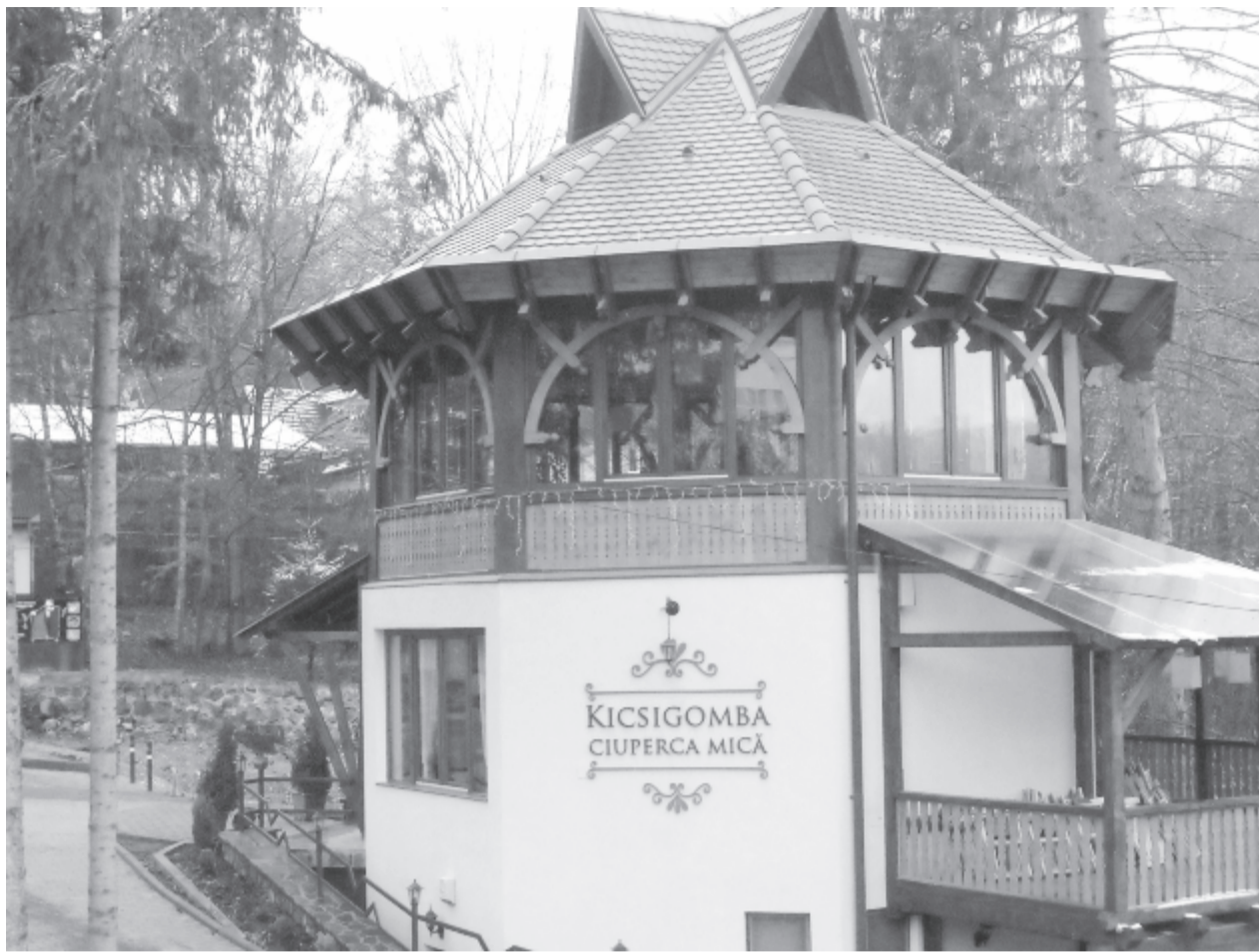
A Kicsi Gombába várják a szovátai kulturákedvelőket