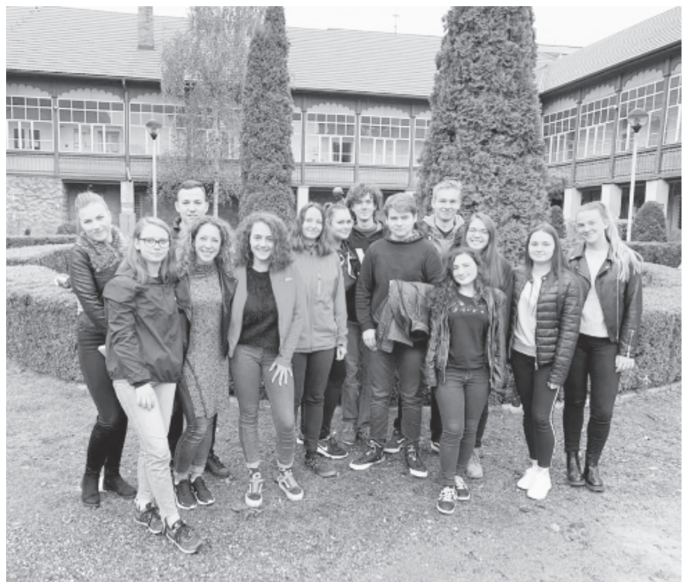
Megújult szervezet, új elnökség, új tervek és kilátások.

Programok szempontjából nem volt szegény év a tavalyi, hiszen a SZISZ gazdag kínálattal fordult a tagság és a város felé. Februárban Hófeszten szerveztek, amelynek az a célja, hogy az egykori Szovátai Téli Játékokat visszahozzák a köztudatba, és ne csak nyári programok, városnapok és tökfesztivál szerepeljen a kínálatban, hanem télen is legyen egy fesztiválhétfője. Március végén karnevált rendeztek, április 11-én a költészet napját jól sikerült verses villámcsődülettel ünnepelték meg. A városnapok egyik programja a diákságnak szól, évek óta a SZISZ szervezi, ahogyan a tökfesztivál diákvételkedőit is a szervezet dolgozza ki és bonyolítja le. Color-on néven új rendezvény jelent meg a palettán, de a ritkább nyári programok nem lazulást jelentenek, hiszen a triatlon-Eb egyik része Szovátán zajlott, és ezen harminc fiatal dolgozott. A szervezet részt vett az őszi Európai Mobilitási Hét akcióiban, a kerékpáros felvonulásban és a zumbás villámcsődületen, ott voltak az adventi vásárnapokon is szervezni és teát osztogatni a résztvevőknek. Az elmúlt évben tehát saját akcióik mellett az önkormányzat munkájában is részt vettek – sorolta fel dióhéjban a tavalyi rendezvényeket az elnök.