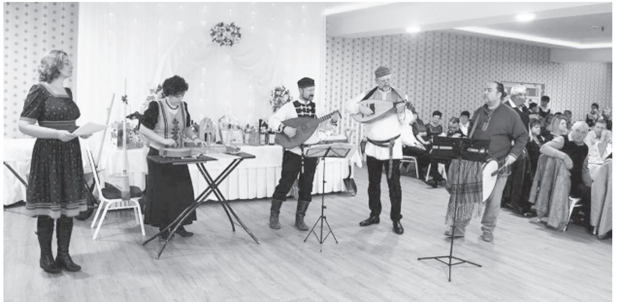
A fergeteges hangulatú bálról nem hiányoztak a szórakoztató fellépők sem