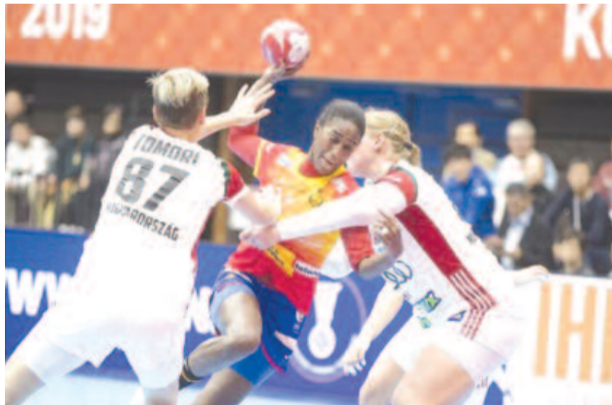
Barbosa sok fejtörést okozott a magyaroknak