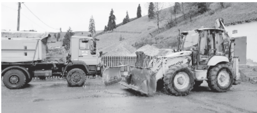
Maros megyei géppark