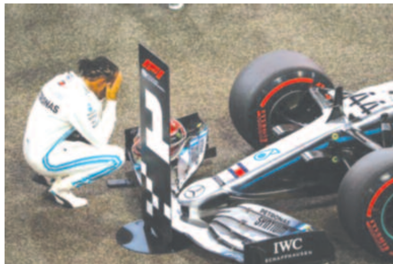
Futamgyőzelem a hatodik vb-címre: a brit pilóta most szusszanhat egyet

* konstruktőrök: 1. Mercedes 739 pont, 2. Ferrari 504, 3. Red Bull 417, 4. McLaren 145, 5. Renault 91, 6. Toro Rosso 85, 7. Racing Point 73, 8. Alfa Romeo 57, 9. Haas 28, 10. Williams 1