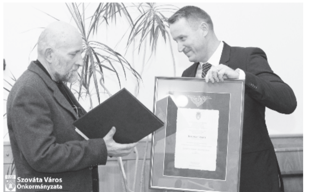
Hetvenedik születésnapján vette át a művész a díszpolgári címet

parkba, azóta pedig nemcsak Szováta, hanem Sepsiszentgyörgytől Marosvásárhelyen és Kolozsváron át Százhalombattáig állnak a Márton Áront, Kálvint, Mikes