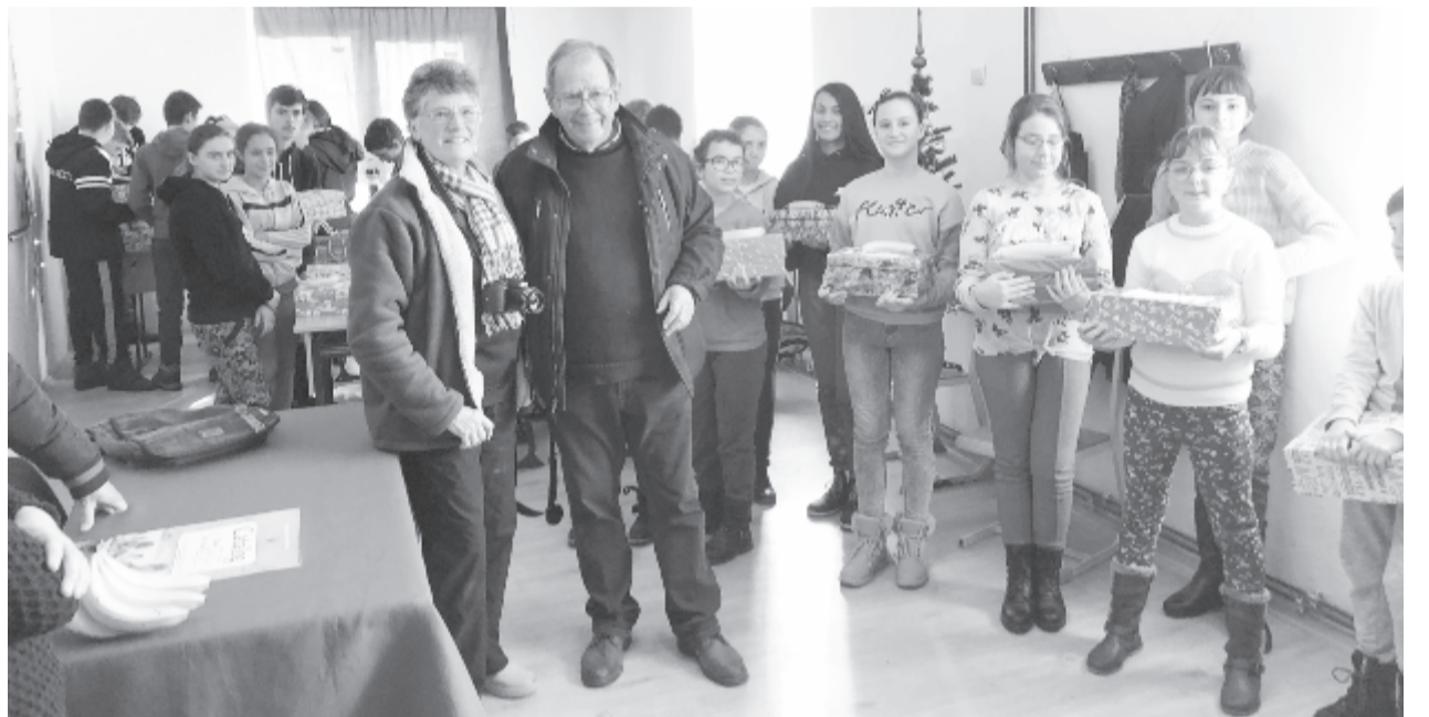
A nagyok az angol vendégekkel

A nagyobb tanulók is csomagot kaptak, így Nagysármáson 104 magyar tagozaton tanuló gyermek részesült az angol vendégek ajándékában. Köszönet érte. (bodolai)