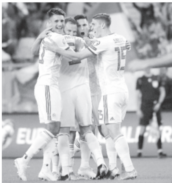
A magyar csapat örül a gólnak a Magyarország – Azerbajdzsán labdarúgó-Európa-bajnoki selejtező mérkőzésen a Groupama Arénában 2019. október 13-án. A magyar válogatott 1-0-ra győzött

Marco Rossi szövetségi kapitány együttese legközelebb november 15-én