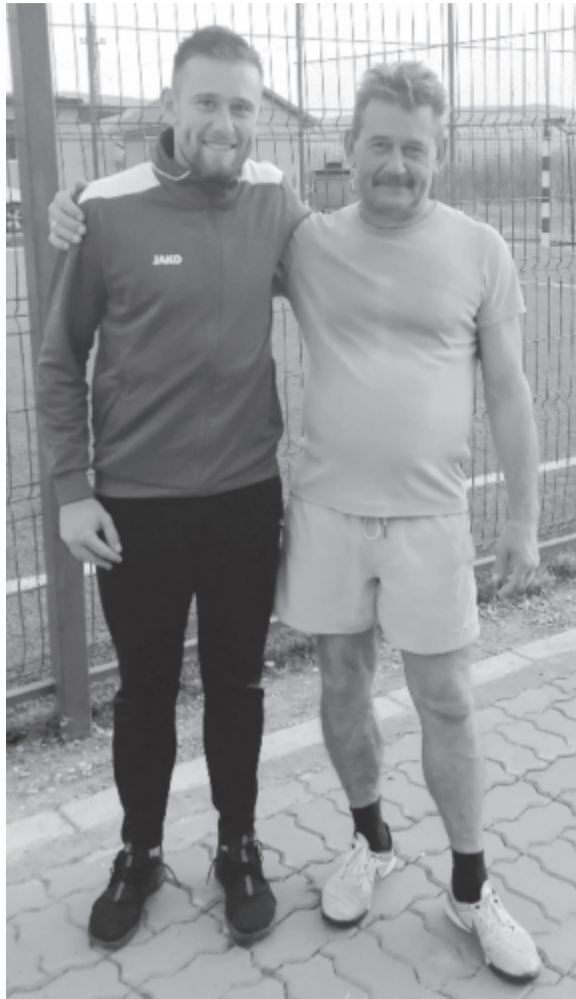
Apa és fia ismét egy csapatban focizott