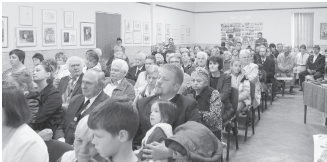
Sok helyit megmozgattak a két nap programjai